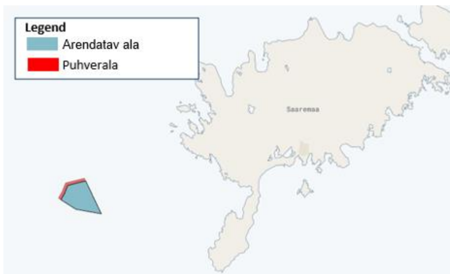
Joonis 1: Projekti kavandatav asukoht

Taotleja eesmärk on arendada, ehitada ja käitada meretuuleprojekti Eesti merealal. Projekt võib siseturu ja regionaalse turu dünaamikast ning toetuskavadest sõltuvalt kasutada erinevaid turule jõudmise viise. Projekti eesmärk on vähendada sisemaise elektrienergia defitsiiti, eriti valitsuse pakutavate elektri hinna tagatiste, näiteks hinnavahelepingute (CfD) kaudu. Alternatiivina võib projekti raames kaaluda üleminekut rohevesinikule või rohevesiniku derivaatidele Power-to-X (P2X) kontseptsiooni kaudu. Selliseid rohevesiniku tooteid on nõudluse korral võimalik tarnida siseriiklikele ostjatele või ekspordida Kesk-Euroopasse arendatavate erinevate ekspordikanalite kaudu. Teine potentsiaalne võimalus on elektri ekspordimine naaberelektriturgudele olemasolevate elektriühenduste või uute Balti riikide ja Kesk-Euroopa vaheliste ühenduste kaudu, nagu nt Läänemere Eesti ja Saksamaa vahele kavandatav Baltic WindConnector. Kavandatav meretuuleprojekt „Edu“ (edaspidi „projekt“) koosneb maksimaalselt 65 tuulikust koguvõimsusega kuni 1040 MW. Eesti mereala planeeringuga („EMP“) 1 kooskõlas olev projekti kavandatav asukoht on kujutatud joonisel 1 .