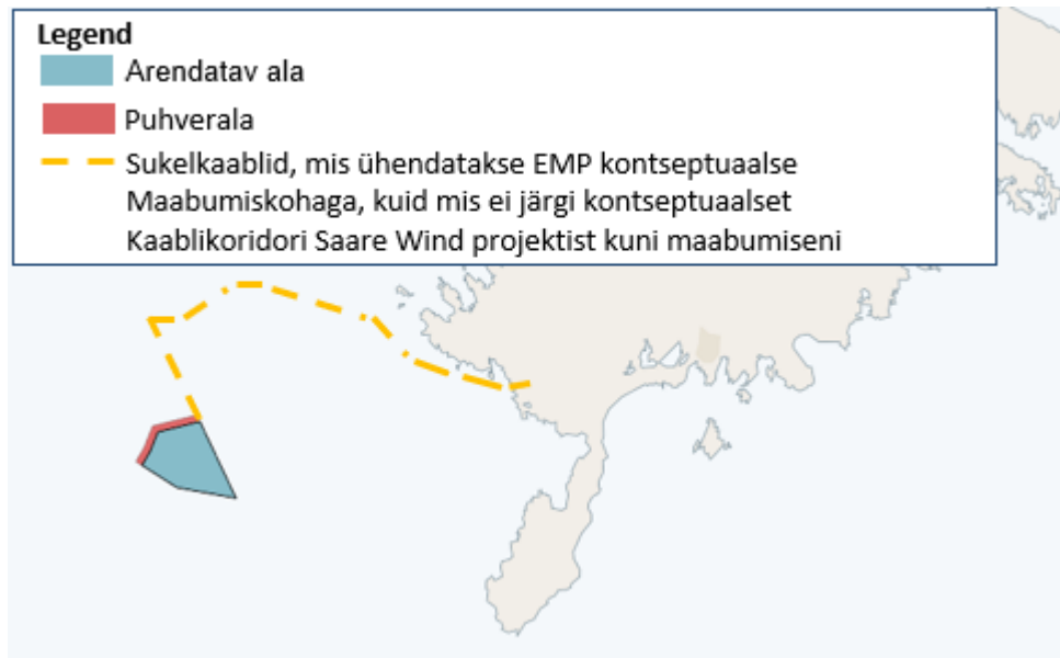
Joonis 3: Kavandatavate ehitus- ja tsiviilehitustööde paigutuse kaart Eesti mereala planeeringu kontekstis 3

Projekti kavandatav ala ja väljapakutav veekaabelliinide koridor. Kontseptuaalne kaablikoridor järgib EMP kaablikoridoride kontseptuaalset asukohta EMP piirkonnas, välja arvatud esimene osa, mis ühendab projekti asjakohase kontseptuaalse kaablikoridoriga.