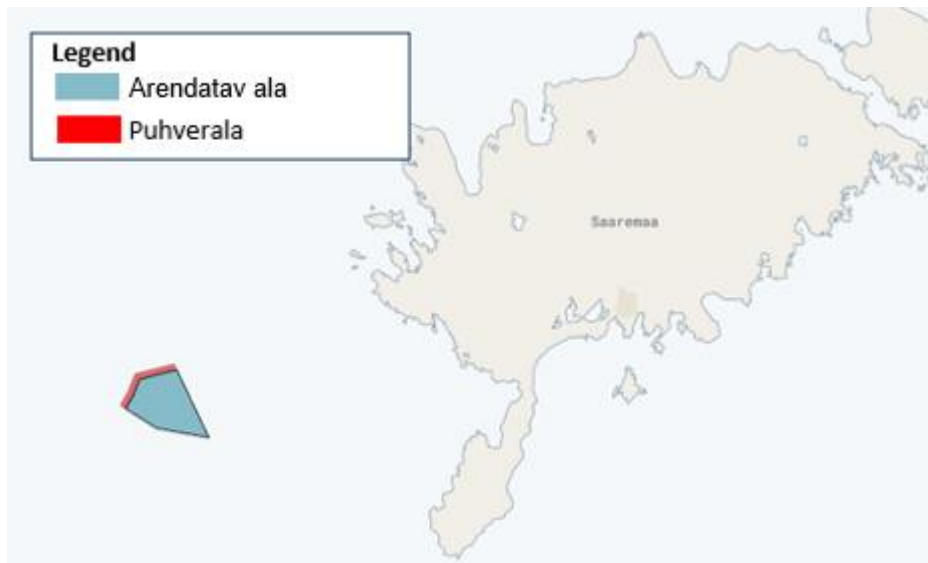
Joonis 2: Projekti kavandatav ala Eesti mereala planeeringu kontekstis 2