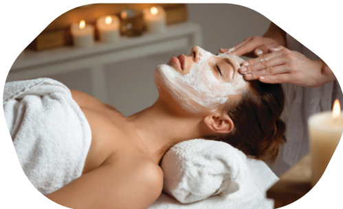
Patīkamas procedūras veselībai un labsajūtai

Hāpsalā reimatismu un citas locītavu slimības ir ārstējuši Krievijas cariskās ģimenes locekļi un Rietumeiropas turīgākie pilsētnieki. Šodien ārstnieciskās dūņu procedūras var baudīt Hāpsalas SPA dziednīcās.