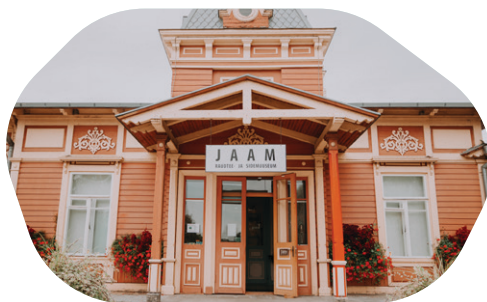
Vēsturiska dzelzceļa stacija kā no 19. gadsimta romāna