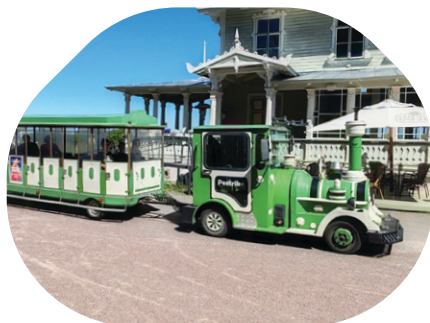
Niprais "Pēterītis" dodas ceļā

Tomēr vilcienu satiksme Hāpsalā nav gluži grimusi aizmirstībā — vasarā no stacijas kursē jaukais vecpilsētas apskates vilciņš "Pēterītis".