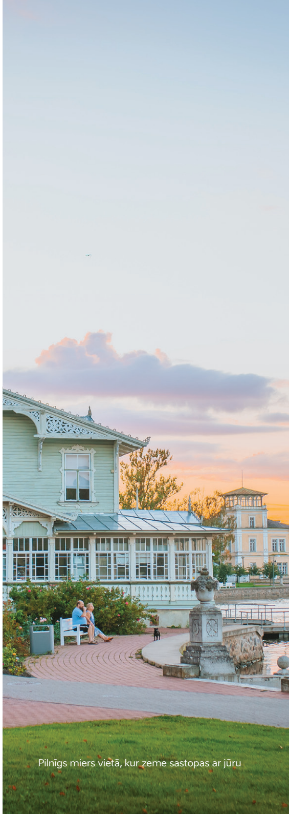
Pilnīgs miers vietā, kur zeme sastopas ar jūru