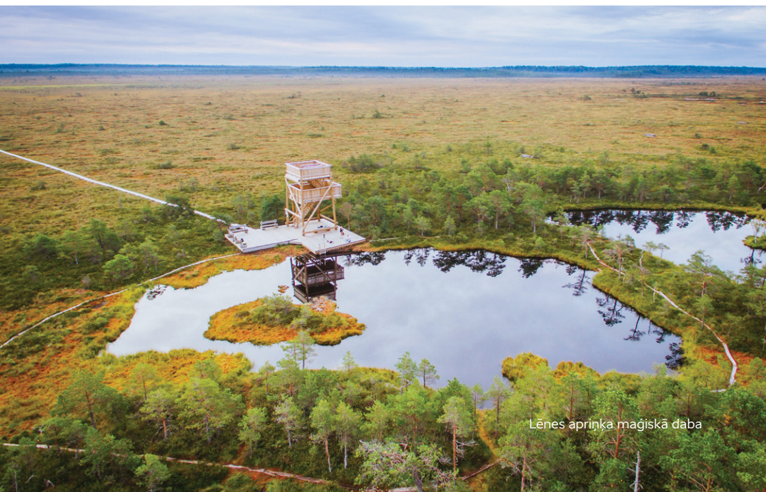
Lēnes apriņķa maģiskā daba