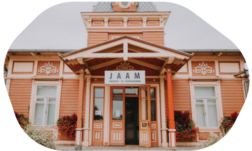
Historiallinen rautatieasema on kuin suoraan 1800-luvun romaanista