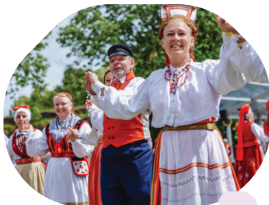
Viron ruotsinkielisten viidennet laulu- ja tanssijuhlat "Läheltä ja kaukaa"