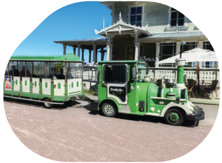
Reipas Peetrike vie ajelulle

Haapsalun junaliikenne ei kuitenkaan ole kokonaan päätynyt, sillä kesäisin asemalta lähtee hauska vanhankaupungin nähtävyyksiä kiertävä juna nimeltä Peetrike (suomeksi: Pikku-Pietari).