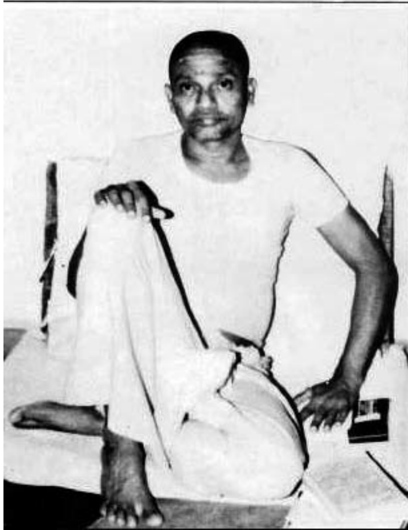
Sri Sadhu Om