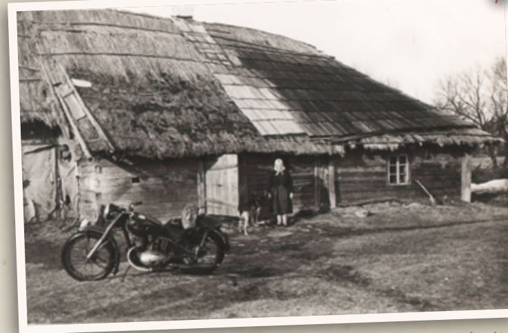
Kihnu tare aja jooksul lapitud katus