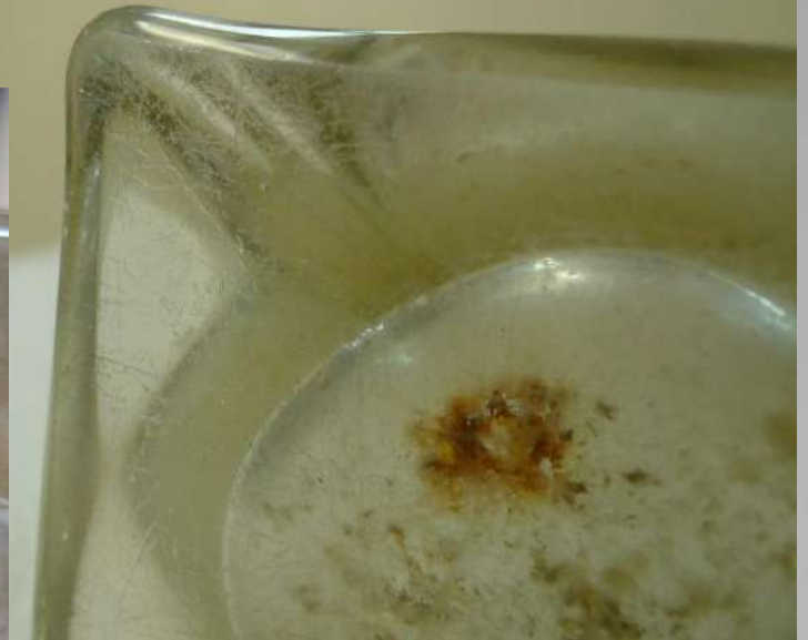
Enne liimiga katmist