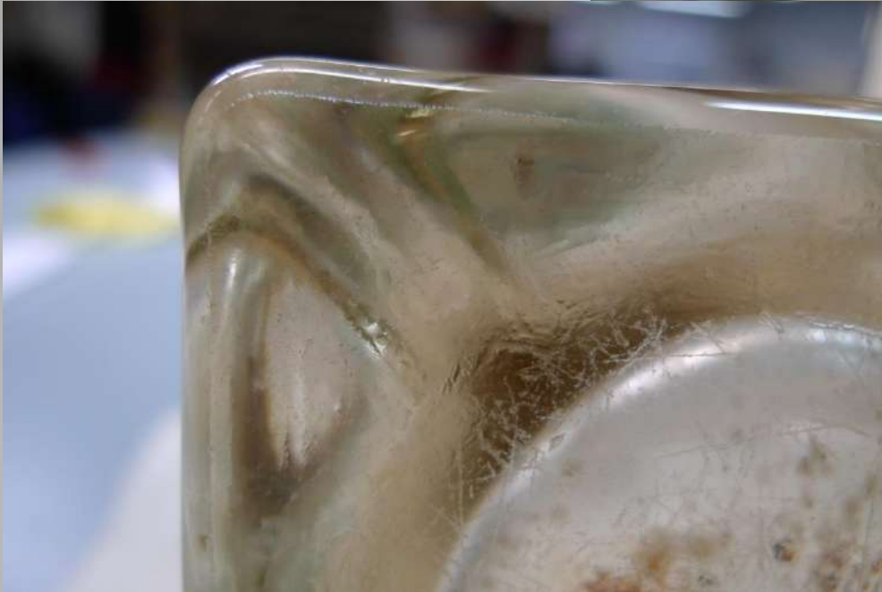
Pärast liimiga katmist