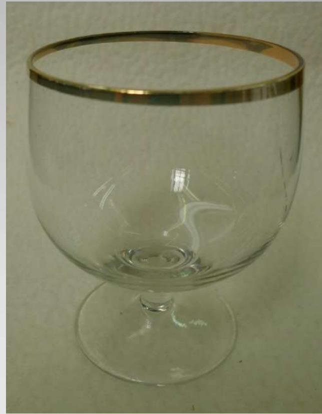
Pragu pärast liimimist