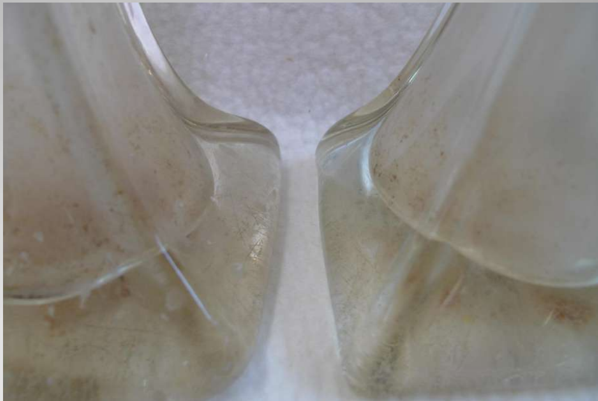
Erinevad klaasi kahjustused