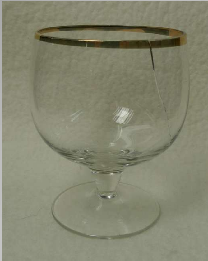
Pragu enne liimimist