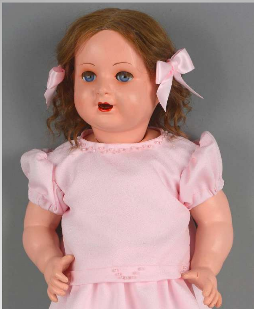
Roosa ja õnnelik silma omanik