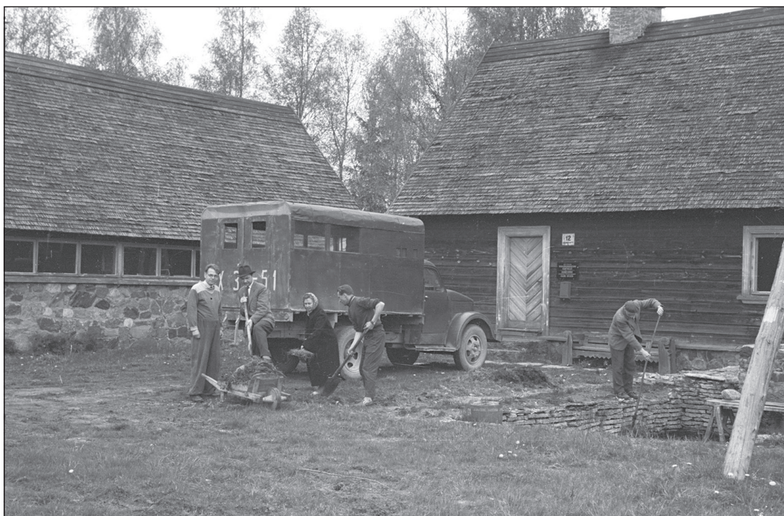
Heakorratalgud Kibuvitsa talu õuel, 1961. Paremal on näha eluhoone ja selle ees asuv paekivivooderdusega basseini, vasakul kõrvalhoone, mis võeti kasutusele kogutud etnograafiliste esemete hoidlana. Foto: Gea Troska. EVM N 42:112.