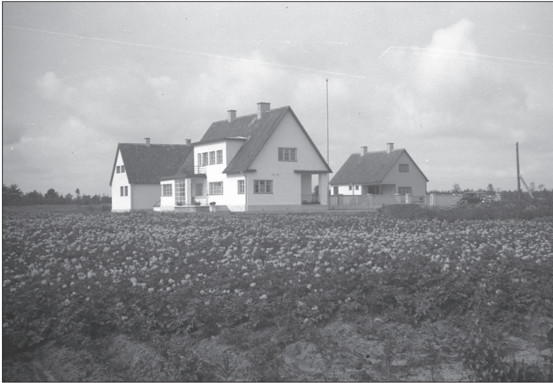
Vastvalminud Lagle talu, 1937. ERM Fk 3039:11.