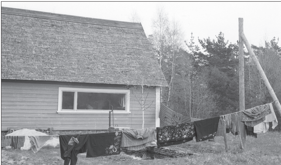
Tekstiilide tuulutamine muuseumi kontori ees. Foto: Gea Troska, 1962. EVM N 81:99.