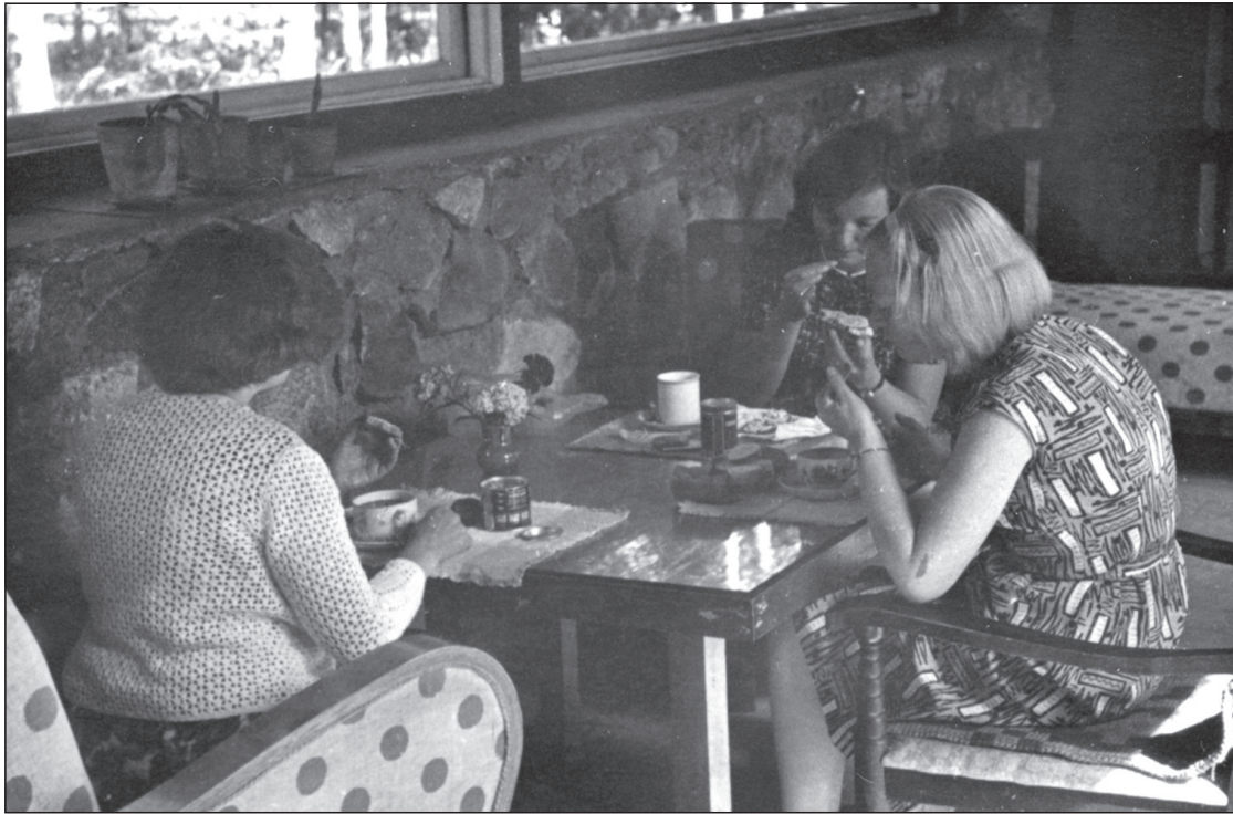
Peamaja keldri ja kasvuhoonega ühendav galerii (veranda) võeti kasutusele puhkeruumina. Muuseumi töötajad einestamas, suvi 1967.