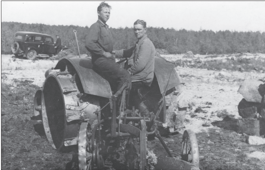
Küünd ratastraktoriga Deering Õismäel Hälli talus 1938. aastal.