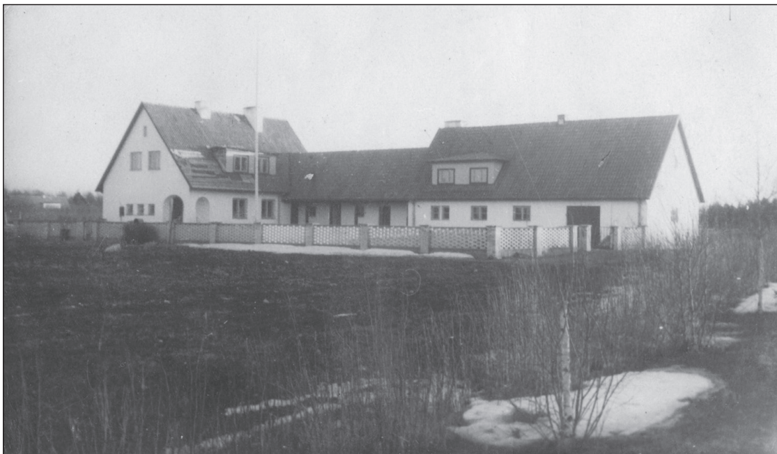
Hälli talukompleks 1940. aastatel.