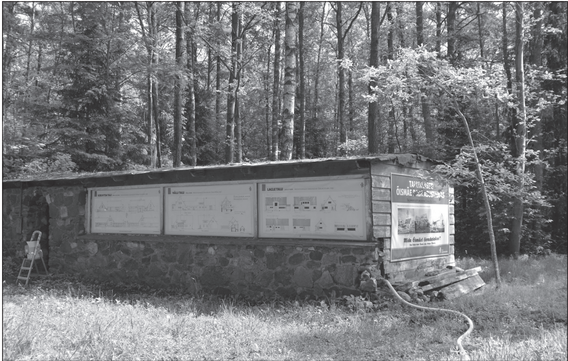
Näitus nn Kibuvitsa galeriis, Herbert Johanson kunagise suvemaja maakividest verandaosas. 2021.