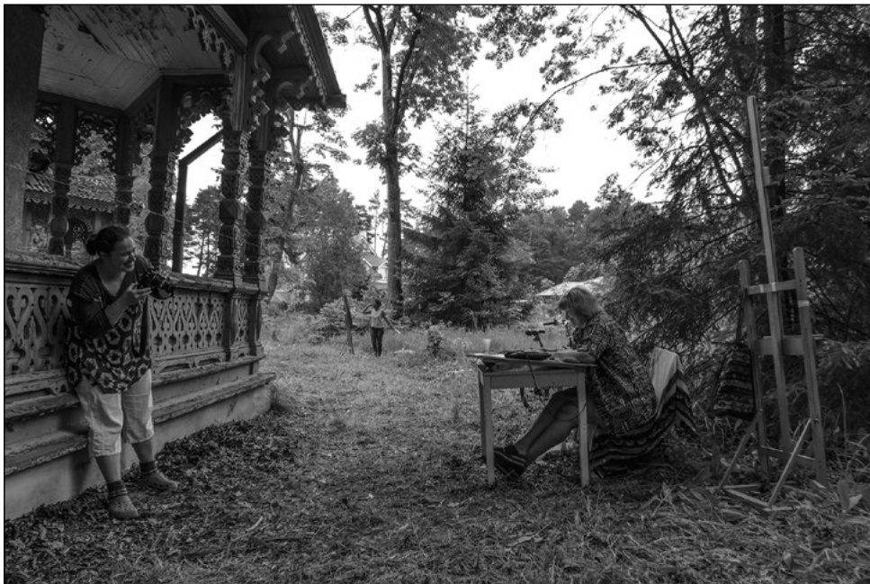
Pantelejevi villa joonised mõõdistati ja vormistati kohapeal hariliku pliiatsiga, abiks horisontaalne null-joone nöö, loodid, mõõdulindid ja hea vaist. Tööaluseks saime Narva Kunstikoolist molbertid (suur tänu!), nutikamad leidsid endale ka laua ja tooli. Foto: J. Metslang, 2014.