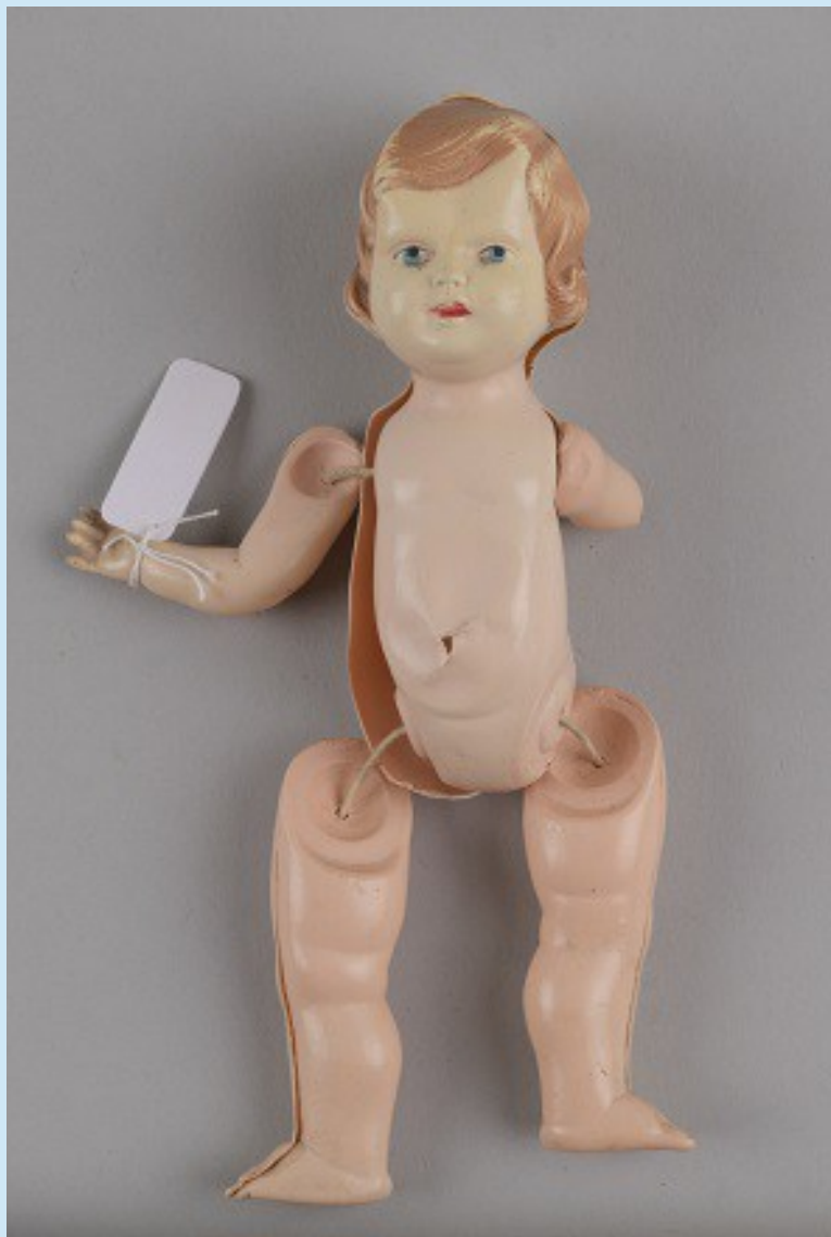
Palamuse O. Lutsu Kihelkonnakoolimuuseum, pastikust nukk, kaubamärk NERV, mõõdud: 13,5 cm