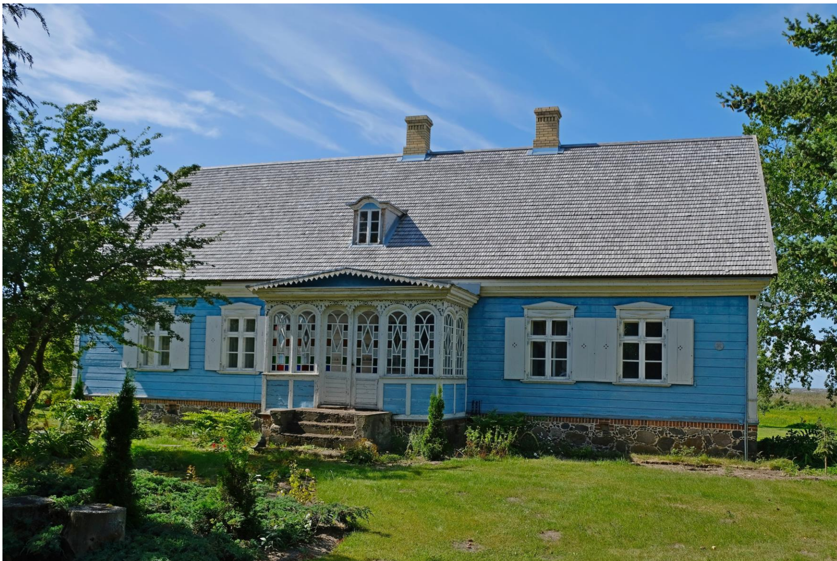
Jakob Marksoni maja (1889) Kablis on üks kõige paremini säilinud kaptenimaju terves Eestis. Maja õnneks on see läbi ajaloo olnud ühe ja sama perekonna valduses. Alates 1998. aastast muinsuskaitse all