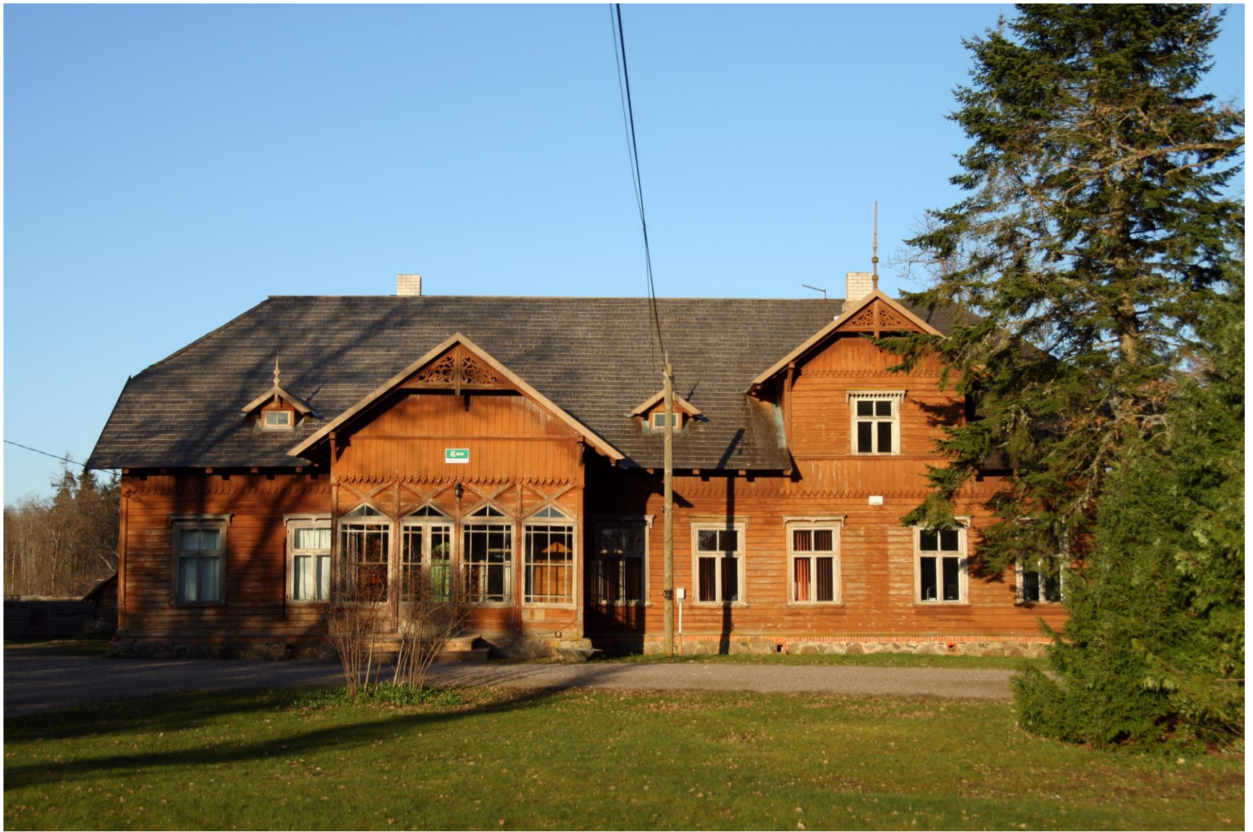
Kilingi-Nõmme metskond. Lähkma, Surju. 1901.a.a