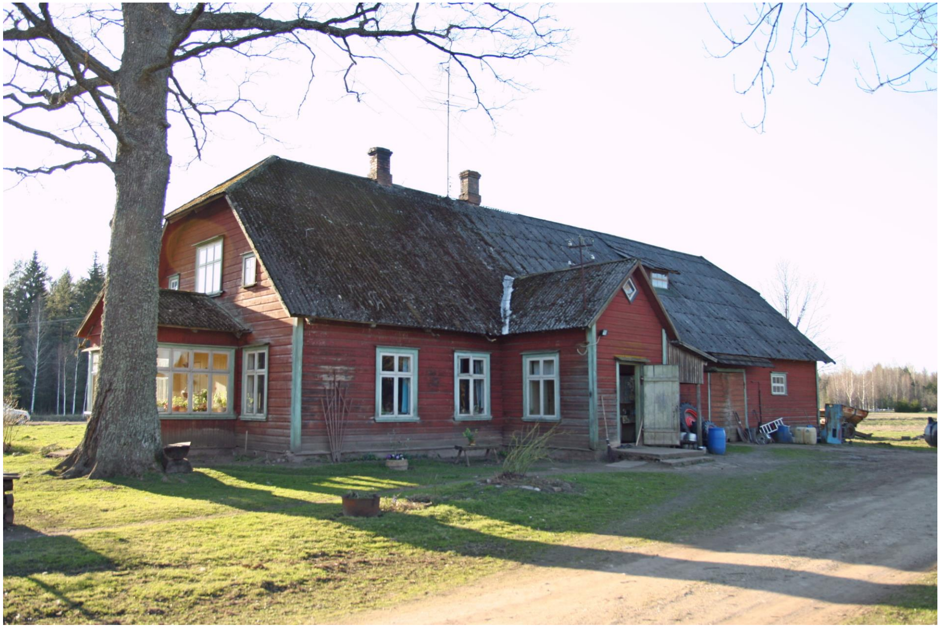
Kivilaane külas asuv Leementi talu rehemaja