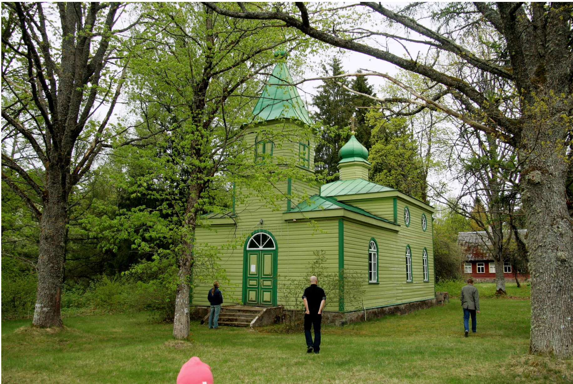
Urissaare õigeusu kiriku praegune hoone Laiksaares ehitati 1927