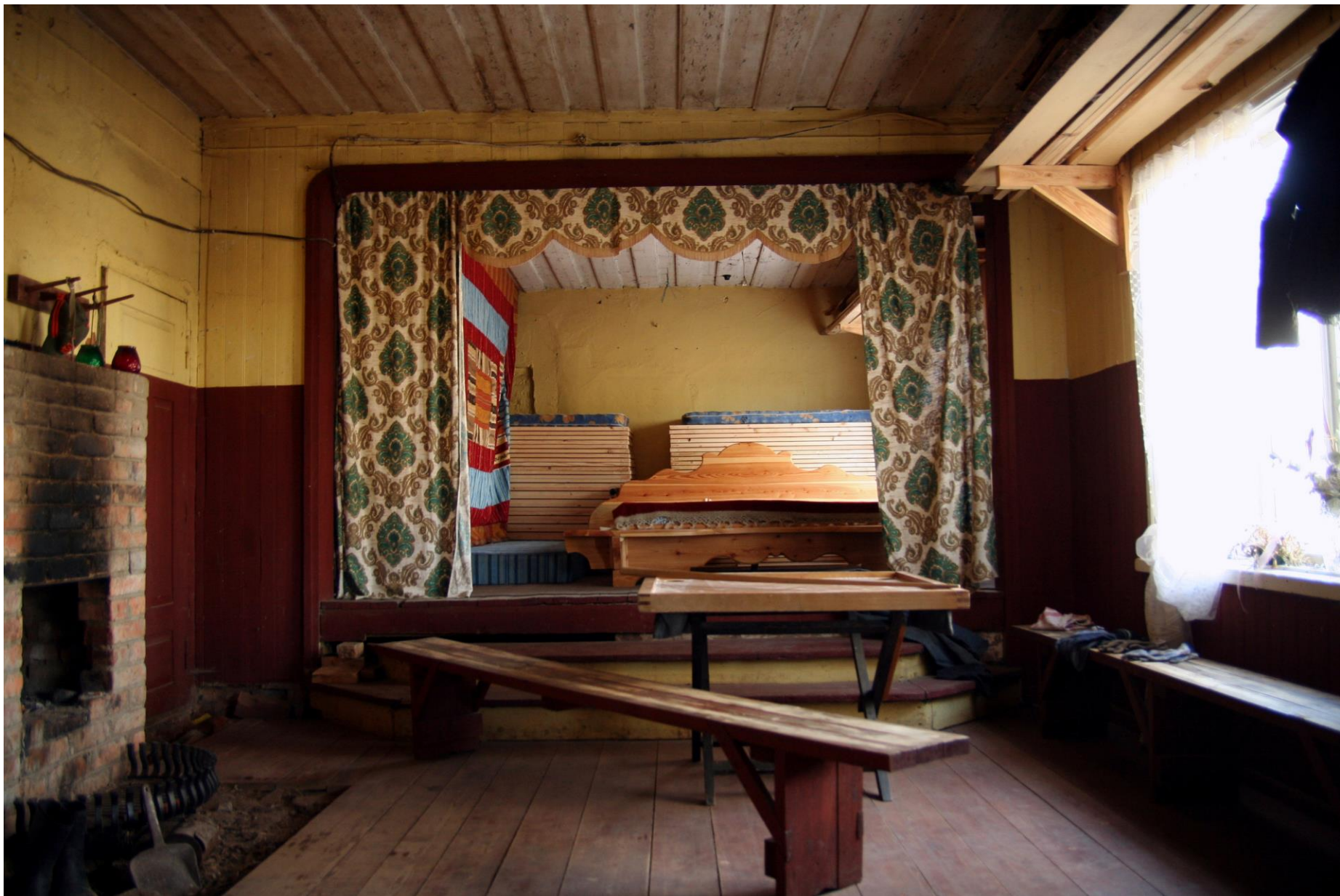
Lanksaare peamaja saali ehitatud lava, kui majas asus nii sovhoosi kontor kui ka klubi (1940-1990)