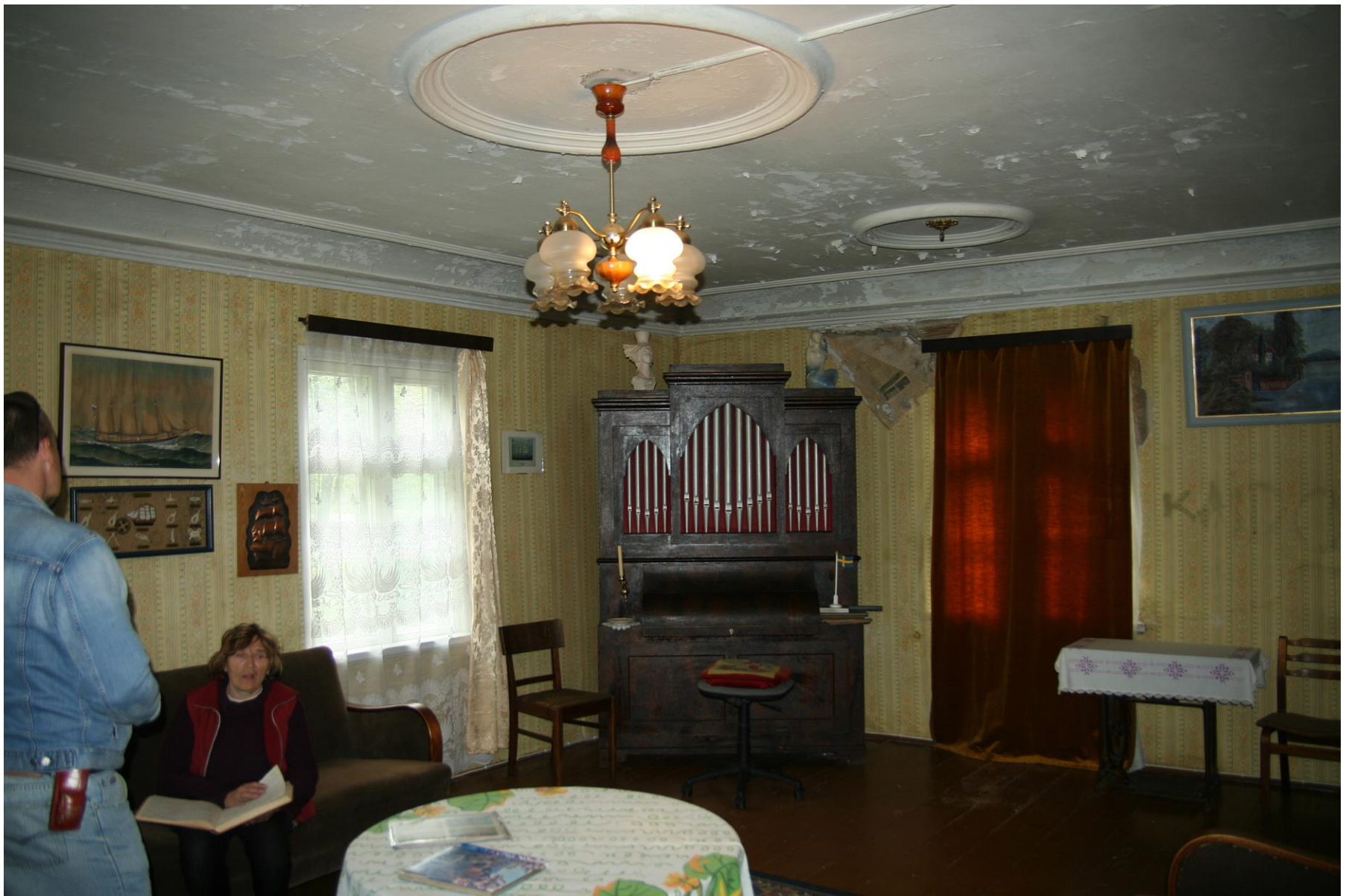
Vaatamata röövlite äraviidud asjadele on Marksoni majas säilinud palju ehedat ja väärtuslikku