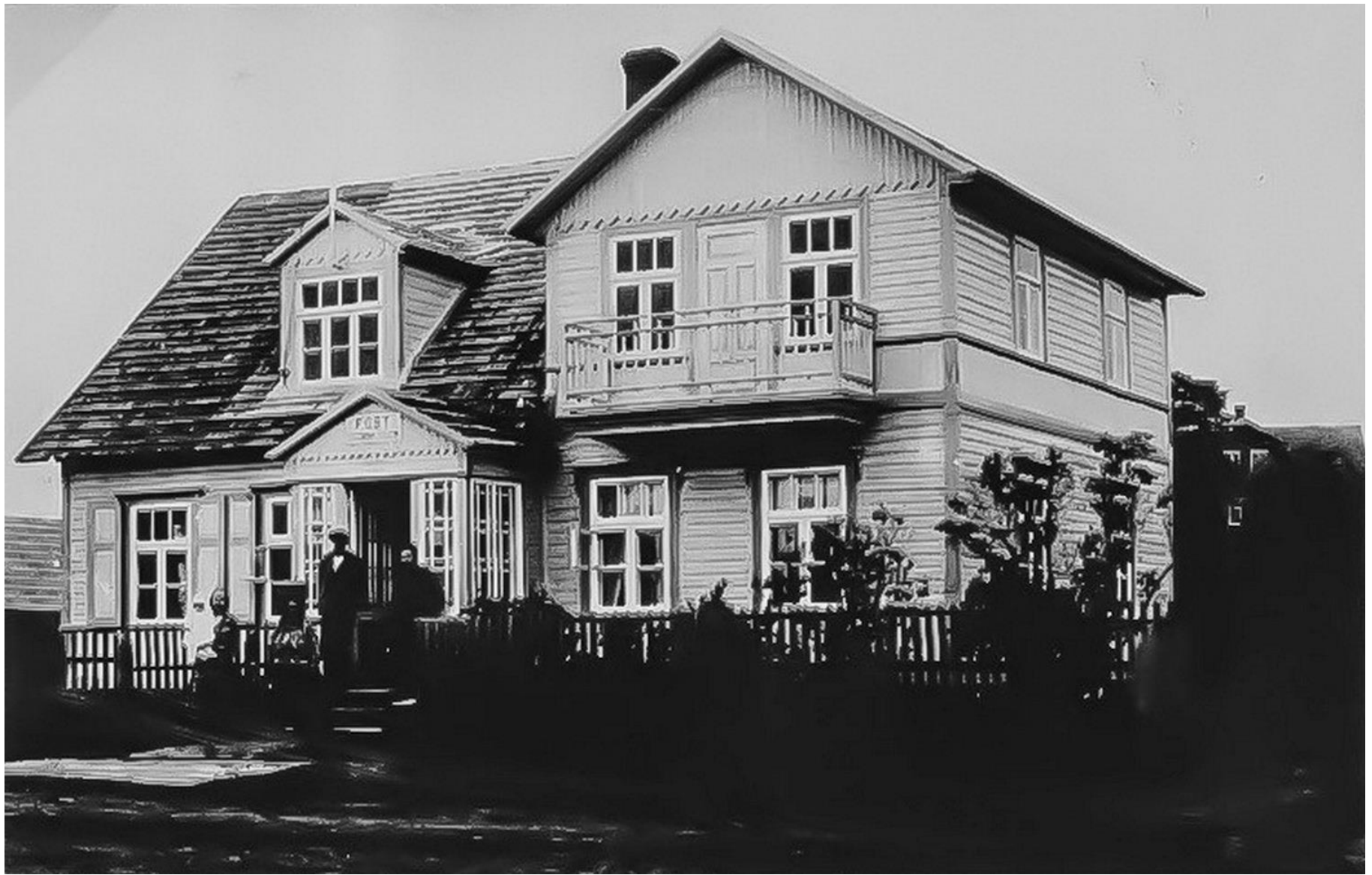
Kapten Gustav Jakobsoni maja Kablis, mille 1934 ostis ära Voldemar Laater, hiljem oli siin postkontor. ERM