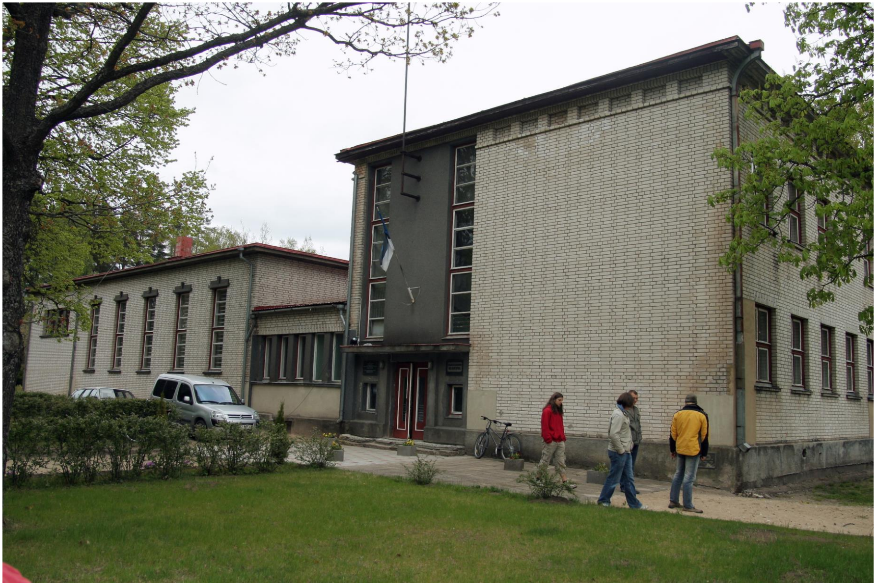
Massiarusse ehitati 1938 moodne funkstiilis avar kool-rahvamaja, kus saalis on kohti 250 inimesele. Arhitekt Märt Merivälja