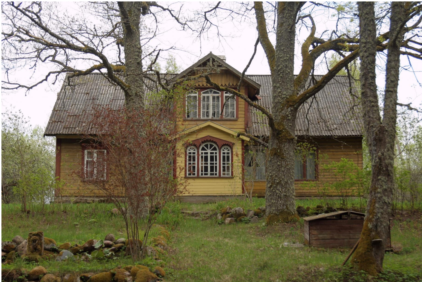
Esinduslik kaptenimaja Jaagupi külas