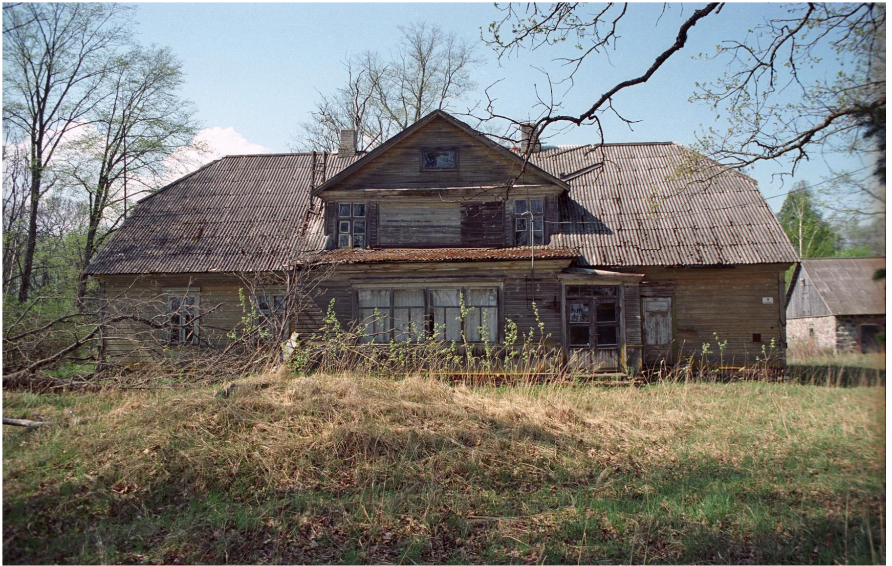
Tali valla Peratsaare talu suur (põhja pindala u 200 m 2 ) stiilne, barokseid poolkelpkatusega vanu kivist mõisahooneid meenutav puumaja. Ehitatud ilmselt 19. saj. lõpus. Siin on olnud kolhoosikontor, hiljem korterid, 2004. aastal oli majal 8 omanikku. Laguneb.