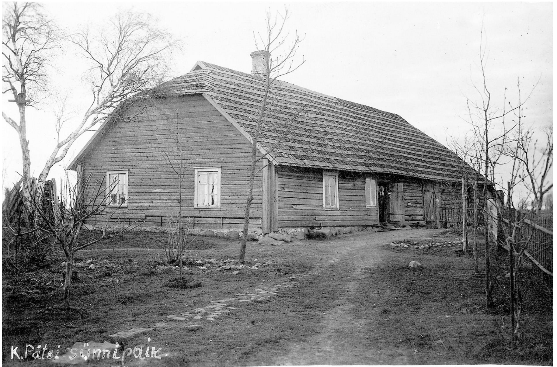
Konstatin Pätsi sünnimaja Põldeotsa talu Tahku külas Tahkurannas