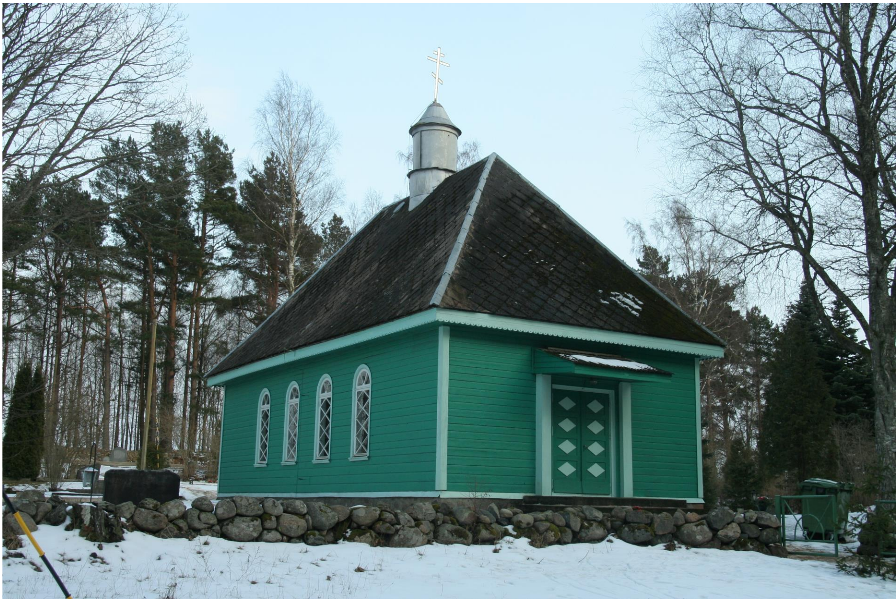
Treimani õigeusu kirik (arhitekt Märt Merivälja) pühitseti 4. augustil 1940 kell 8:00 hommikul