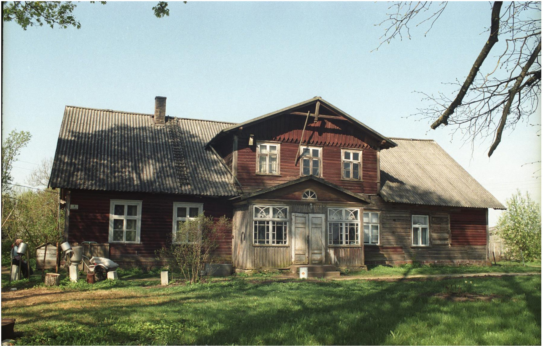
Tali valla Metsa-Tõrsepa talu suur esinduslik häärber 19-20. sajandi vahetuselt. Hiljem on siin olnud väikese kolhoosi ja sovhoosi osakonna keskus