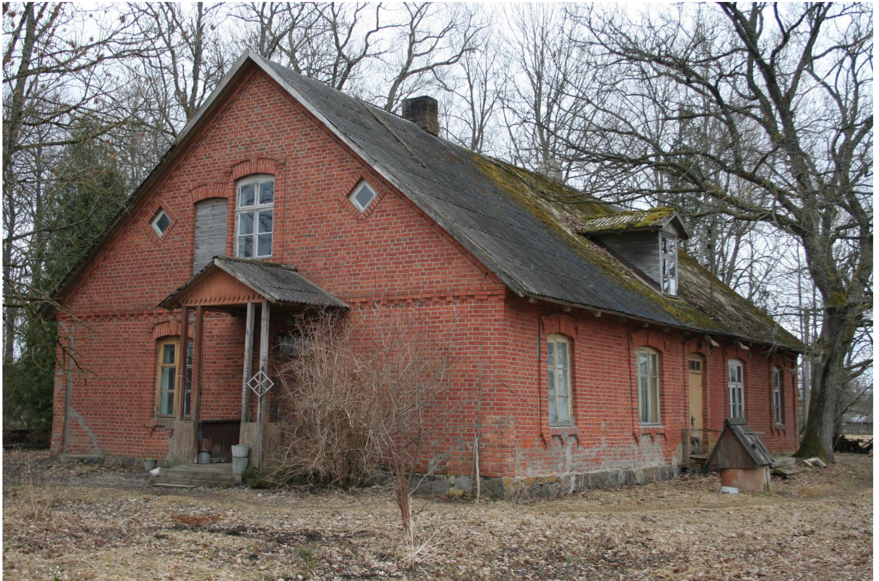
Kortle talu suur tellishäärber Jäärjas on ehitatud 1900.