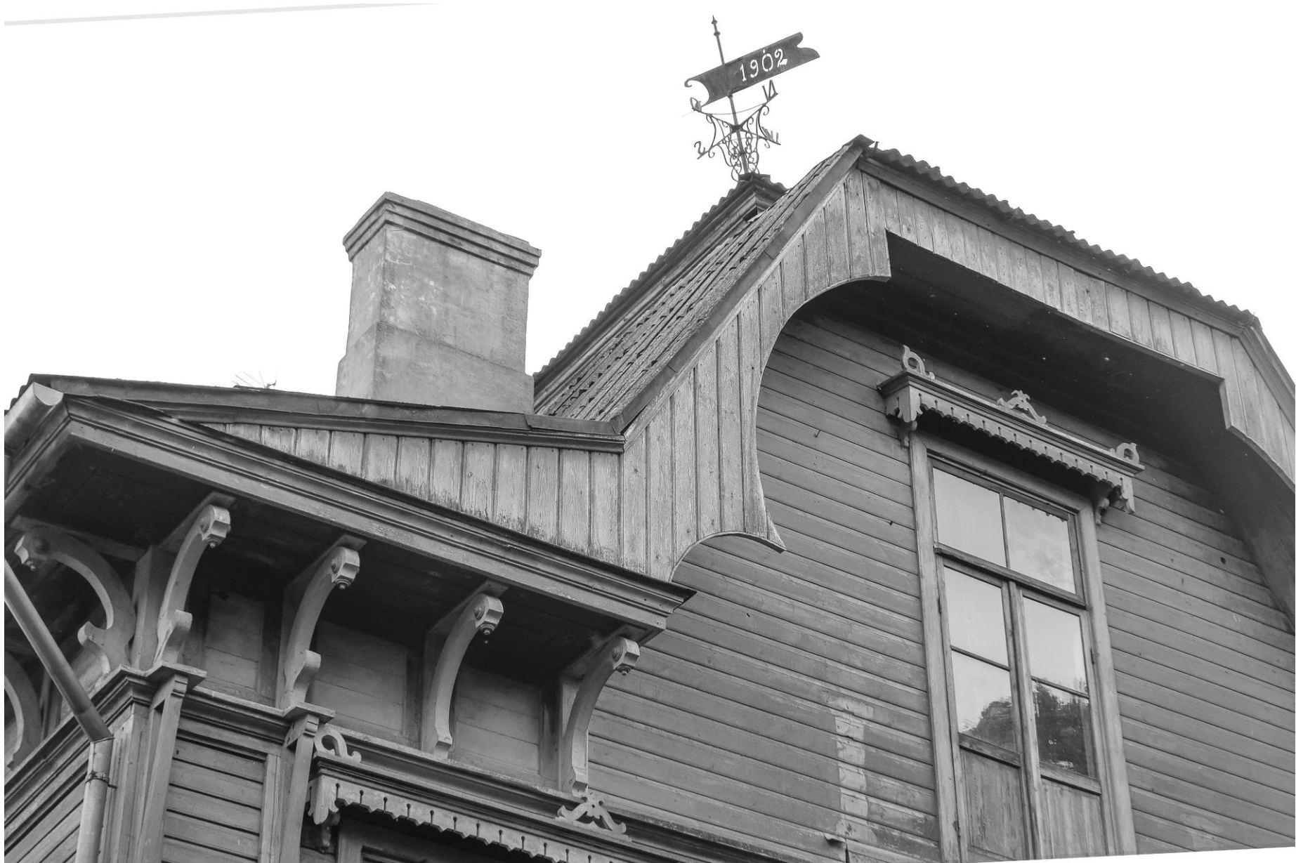
Detailidega selle segastiilis (historitsism) puithoone juures kokku pole hoitud