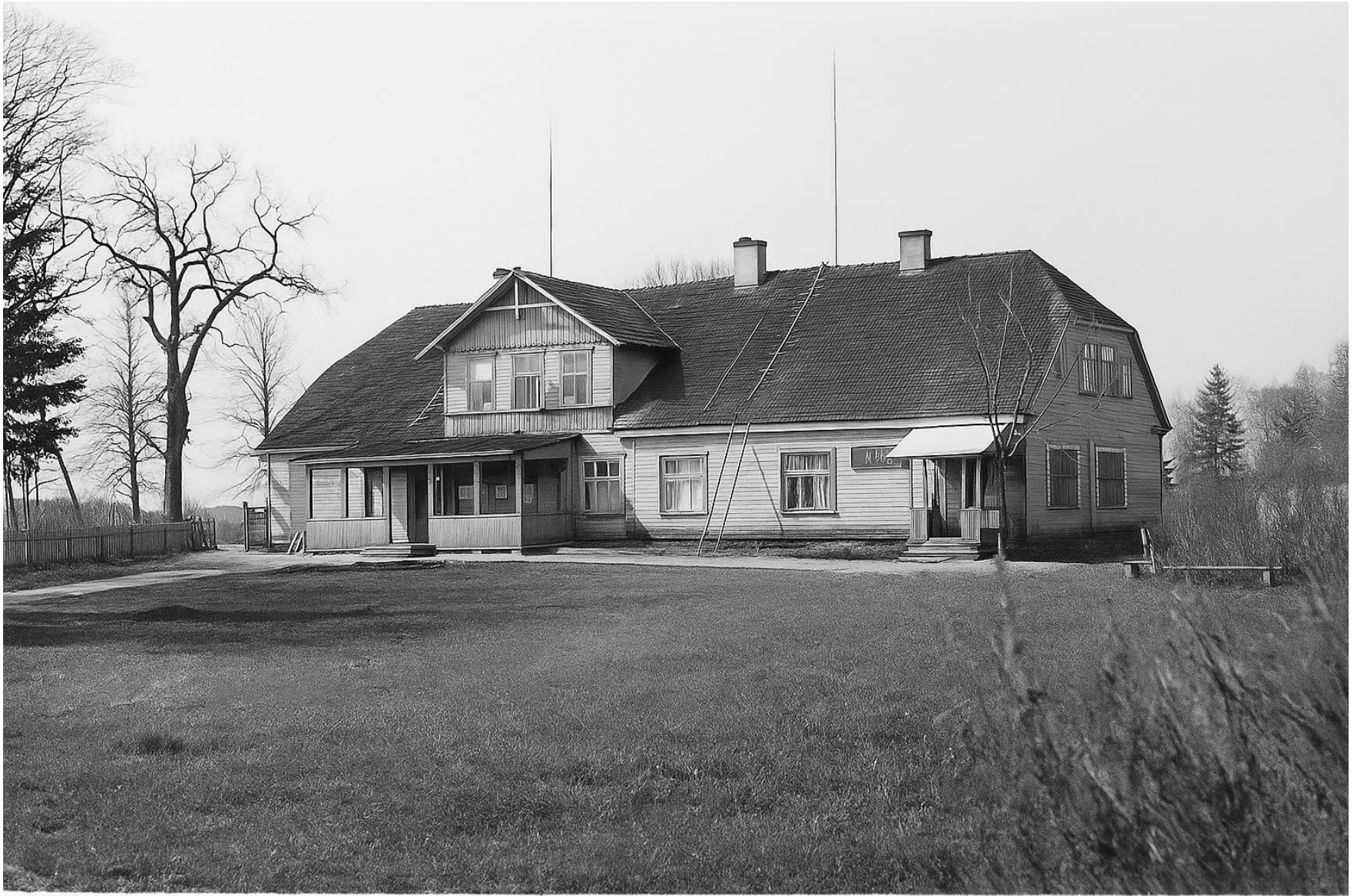
Lanksaare talu peahoone (1870-1880. aastad) ülesvõetuna 1950. aastail, kui siin oli samanimelise sovhoosi keskus, kauplus ja sidejaoskond