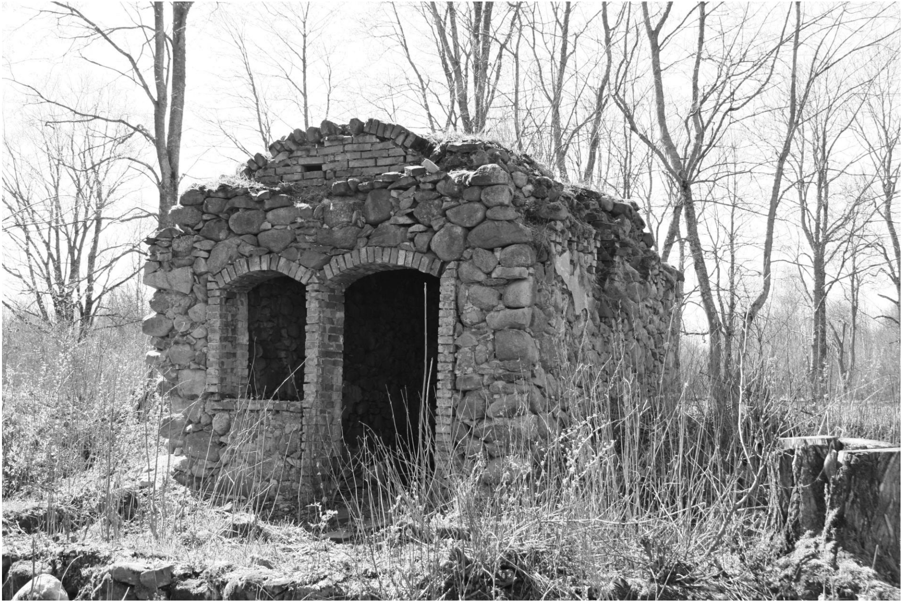
Suurest Tõrga talust vastu Läti piiri pole säilinud midagi peale kivist roovialuse