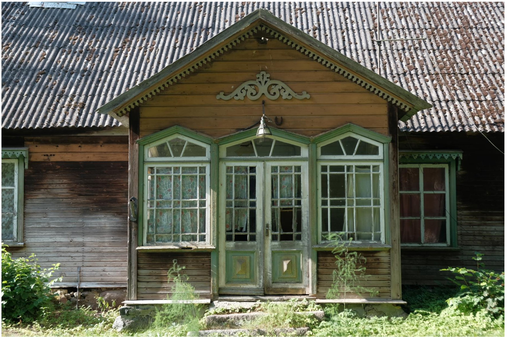
Meerentsi maja veranda Jaagupis