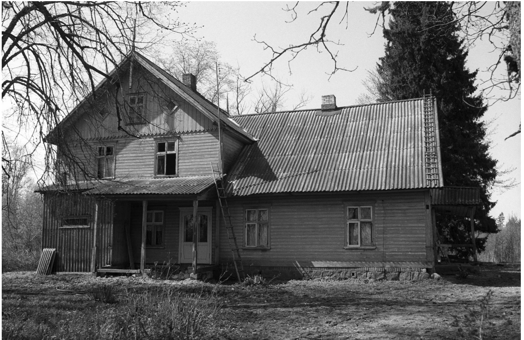
Leppoja talu häärber on tõenäoliselt ehitatud 20. sajandi algul. Kuni 1990.aastate alguseni oli siin kohalik lasteaed, praegu kuulub Lanksaare talule