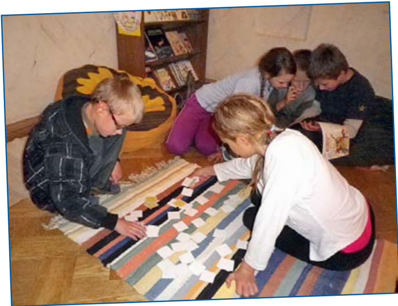
Albu lapsed lugemispesas