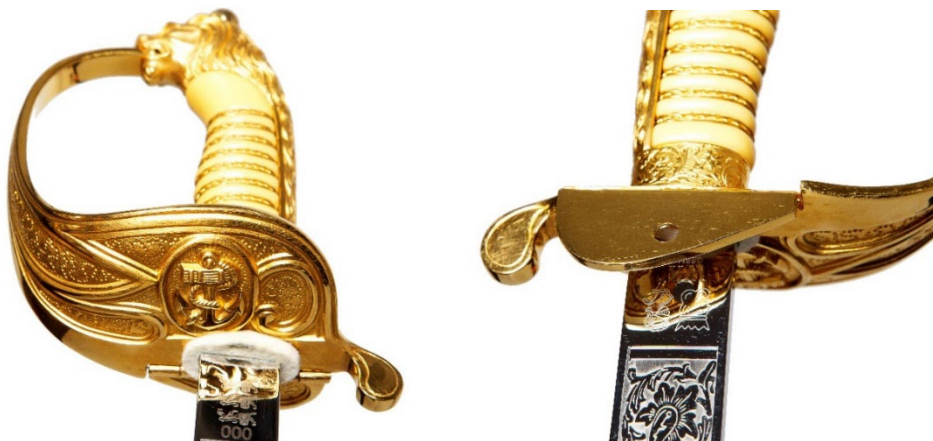
Pilt 4. Merväeohvitseri mõõga käepide

3.3. Mõõga käepide on elevantiluu värvi plastikust ning mähitud üheteistkümne kullatud traadist punutisega. Pideme otsa kinnitatud messingist 24-karaadise kullaga üle kullatud lõvi pea lõuad hoiavad kaitseraua tagumist osa. Käekaitse on messingist, kullatud 24-karaadise kullaga, korvikujuline. Käekaitse teramiku poolisel pinnal on reljeefne ankru kujutis. Käekaitse vasakul küljel on maha käänatav osa mõõga lukustamiseks.