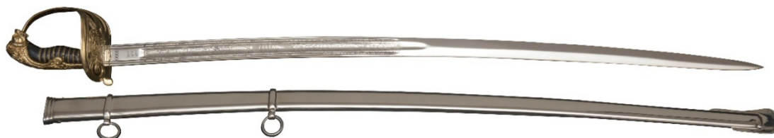
Pilt 1. Maaväeohvitseri mõök