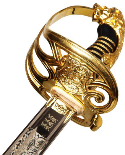
Pilt 2. Maaväehvitseri mõõga käepide

2.4. Mõõgatupp on valmistatud metallist ja kaetud nikli kihiga. Tupe ülemisel küljel on kaks rõngast tupe kinnitamise mõõgarihma kanderihmade külge ning vasakul küljel haak tupe asetamiseks mõõgarihmale oleval hoideklambriks. Tupe ülaossa vasakule küljele, tipesuudme randi alla on graveeritud number, mis vastab tupega komplektis oleva mõõga numbrile.