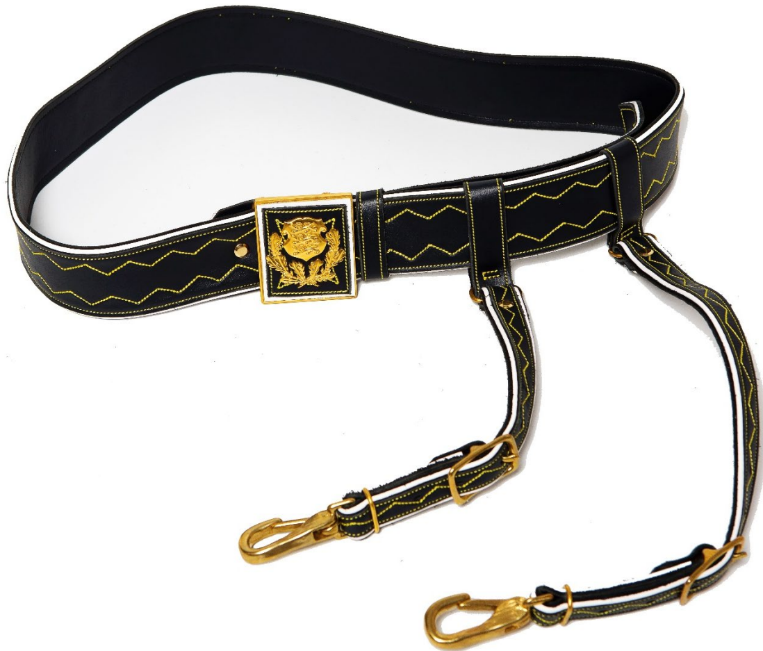
Pilt 11. Sinine mõõgarihm

vastab metallist aas vöö vasakpoolsel otsal. Vööl on kaks 21 mm laiust liukvatel aasadel kanderihma mille otsad on varustatud löksudega (karabiinidega) ja kaetud samasuguse tikandustega nagu vöö. Vöö vasakpoolses otsas on üks liikuv aas vöö reguleerimiseks.