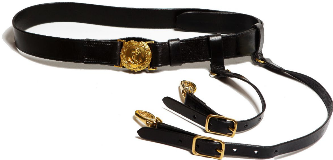
Pilt 10. Must mõõgarihm

Musta mõõgarihma kantakse ainult mereväeohvitseri vormiga ja koos mereväeohvitseri mõõgaga. Must mõõgarihm koosneb vöörihmast ja kahest kanderihmast. Vöörihm on valmistatud 35 mm laisusest mustast nahkrihmast. Metallist osad on kullatud. Vöörihm on sõõrikujuline metallist pannal, mille läbimõõt on 48 mm. Pandla esiküljel on loorberilehti kujutav pärg, mille keskel ankru kujutis; pandla tagumisel küljel on kinnitushaak, millele vastab metallist aas vöörihma vasakpoolsel otsal. Pandla taga on vöörihma otsa kinnitatud naha tükk. Vöörihm on kaks 18 mm laiust liikuvatel aasadel mustast nahast valmistatud kanderihma mille otsad on varustatud lõksudega (karabiinidega). Vöörihma vasakpoolses otsas on üks liikuv aas vöörihma reguleerimiseks.