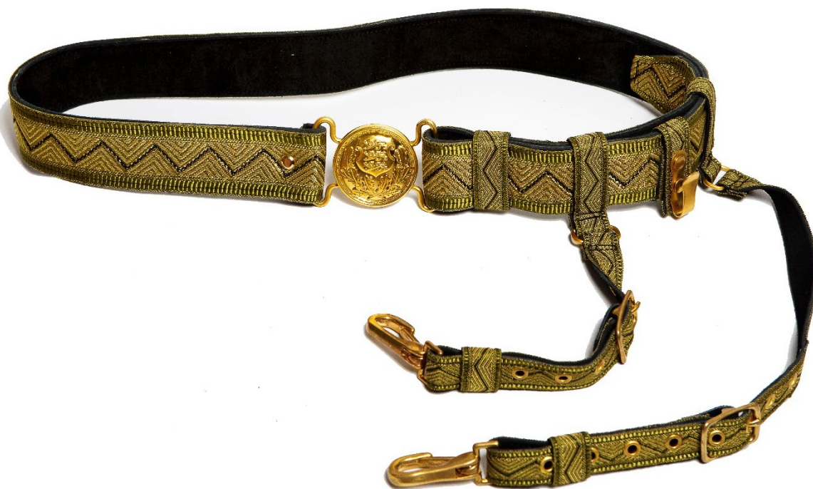
Pilt 9. Kuldne mõõgarihm

Kuldset mõõgarihma kantakse ainult maaväehvitseri tavavavormiga ja koos maaväehvitseri mõõgaga. Kuldne mõõgarihm koosneb vöörihmast ja kahest kanderihmast. Vöörihm on valmistatud pehmest mustast 49 mm laiusest nahkrihmast. Metallist osad on kullatud. Vöörihma katab roheline kuldse muustriline kootud kangas, mille keskohta läbib 90° nurkadega must murd joon. Vöörihmal on sõõrikujuline metallist pannal läbimõõduga 55 mm. Pandla esiküljel asub ornament, suure riigivapi kujutisega; pandla tagumisel küljel on kinnitushaak, millele vastab metallist aas vöö vasakpoolsel otsal. Vöörihma vasakus otsas on üks 21 mm laiune samamuustriline liikuv aasa millega saab vöörihma pikkust reguleerida ja üks liikuv aas mille küljes on metallist konks mõõga riputamiseks. Vöörihmal on kaks 21 mm laiust liikuvatel aasadel kanderihma mille otsad on varustatud lõksudega (karabiinidega), valmistatud mustast nahast ja kaetud samavärvilise kangaga nagu vöörihm.