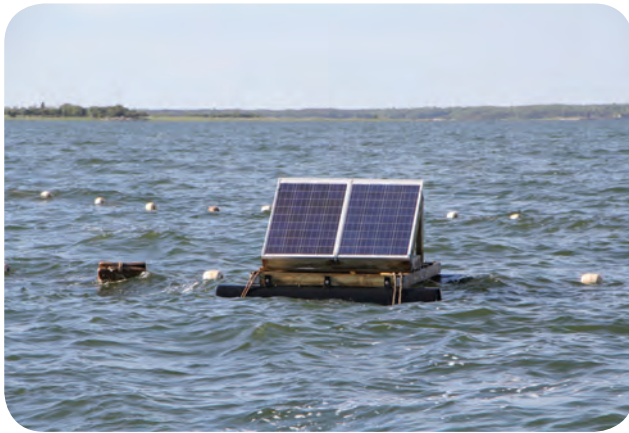
Autonoomse toitega ujuvarvel akustiline hülgepeleti mõrra kõrval Saaremaal.

Arvestades akustiliste hülgepeletite kasutusmugavust, mõju ja hinda, on neid praegusel ajal otstarbekas kasutada ennekõike merekalakasvatuste ja oluliste suuremat saaki andvate mõrrapüügipiirkondade juures. Odavamad akustilised peletid, mis on loodud vaalaliste (delfiinide) triivvõrkude juurest eemale peletamiseks (nn pingerid), on küll odavad ja töötavad ühe laadimisega kuid, ent nende hirmutav toime püsib hüljeste puhul siiski enamasti vaid mõned päevad.