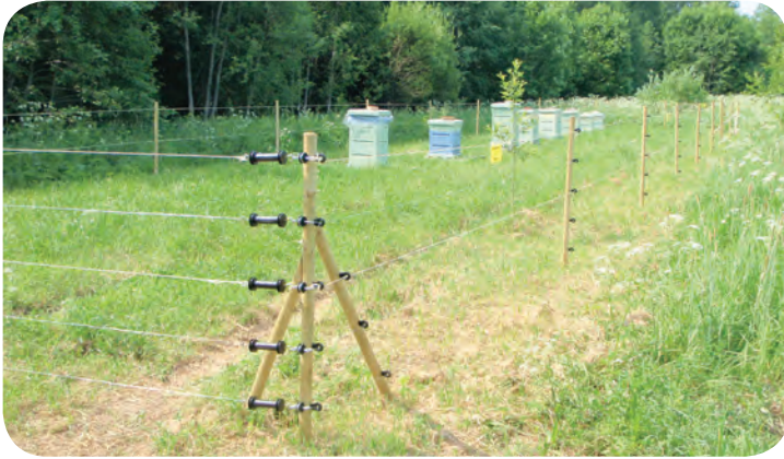
Mesila kaitseks ehitatud eeskujulik aed Jõgevamaal.