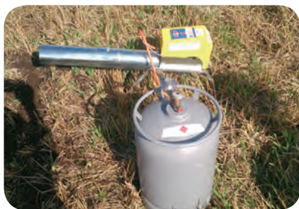
Tõhus lindude peletamise vahend on gaasiga töötav paugutaja.

Efektiivsed ja laialt kasutatavad on ka lindude ärevus- ja hoiatushääli, röövloomade hääli ning inimkõrvale kuuldamatuid helisignaale regulaarselt ja valjult levitavad akustilised peletid. Ka nende peletite tööraadius on lai ning mõjus visuaalsete hirmutitega samaaegsel kasutamisel suurem.