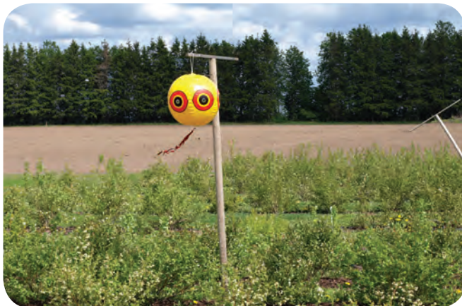
Rändlinde põllumaast eemale hoidev linnupeletuspall.