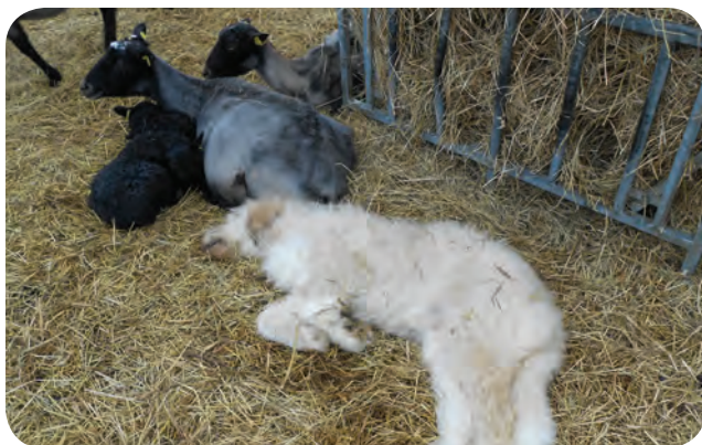
Usaldusväarsus ja turvalisuse sisendamine on karjavalvekoerte olulised omadused. Komondori ja kesk-aasia lambakoera järglane töötab Saaremaa lambafarmis.

Karjavalvekoerte ülesanne on olla kariloomade poolt omaks peetav ja usaldusväärne turvaja. Töökoerteks kasvatatakse karjavalvekoeri lammaste kõrval ja keskel. Tuntuimad ja töökoertena enam kasutatavad karjavalvekoerte tõud on hispaania mastif, pürenee mastif, tiibeti mastif, kesk-aasia lambakoer, kaukaasia lambakoer, pürenee mäestikukoer, estrela mäestikukoer, lõuna-vene lambakoer, maremma-abruzzi lambakoer, podhalani lambakoer, komondor, kuvasz, slovaki tšuvatš jt.