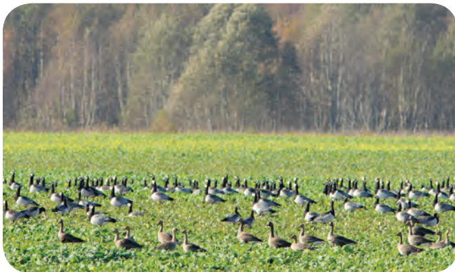
Põllul toituvad valgepõsk-lagled ja suur-laukhaned.

Inimese poolt regulaarne lindude põllumaadelt eemale peletamine on töömahukas ja järjepidevust nõudev tegevus. See sarnaneb veidi karjase tööle. Kuna valdav enamus põldudel toituvate lindude rändeaktiivsusest jääb enamasti mõne nädala kuni kuu pikkusele perioodile kevadel ning paari nädala pikkusele perioodile sügisel, on sellel ajal siiski mõistlik arvestada ka inimese poolt lindude peletamisega. Linde saab põllumaadelt eemal hoida jalgsi või kergema mootorsõidukiga (ATV, mootorratas) ringi liikudes. Mõju suurendamiseks võib lisaks kasutada õpetatud koera, tugevat häält, käed laiali liikumist (meenutab röövlindu lendu), paugutamist jm lisaefekte.