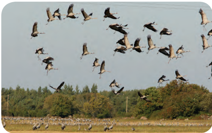
Koristatud viljapõllul toituvad sookured on julged.