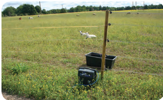
Tõhus ja korralikult rakendatud elektrikarjuse traatide ja lintidega kiskjakahjustuste ennetusaed Järvamaal.

Eestis põliselt elavad pruunkaru, hunt ja ilves võivad toidu otsingul kahjustada mesitaru- sid ja silorulle ning murda kari- ja lemmikloomi. Kiskjakahjustuste oluliseks vähendamiseks ja ärahoidmiseks on mitmeid praktilises kasutuses tõhusaks osutunud abinõusid.