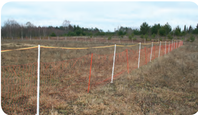
Lihtsalt ja kiiresti tehisdatav elektrikarjuse võrgust, lindist ja plastikpostidest rajatud lammaste ööaedik Harjumaal.

Öise sisseajamise ja ööaedikute kasutamise võib turvalisuse tõstmiseks kombineerida päevase karjuse kasutamisega. Näiteks oleks karjuse karja juures viibimine sobilik hommiku- ja õhtutundidel ning sügisel kiskjate järelkasvu koolitamise perioodil. Loomakarjuse traditsioon on sajandeid kestnud tõhus meetod karjamaal kariloomade suunamiseks, valvamiseks ja turvalisuse tagamiseks. Karjasteks olid talus inimesed, kes olid teiste tööde tegemiseks veel liiga noored või juba eakad. Kariloomad harjuvad karjusega ning kuuletuvad tema korraldustele, karjusel võib olla abiks karjakoer. Eestis oli karjuste kasutamine veel 30-40 aastat tagasi ühismajandite ja külarahva ühiskarjade hoidmisel laialt levinud tava. Kesk- ja Lõuna-Euroopa maades on see ka tänapäeval väga tavaline ning asendamatu töö.