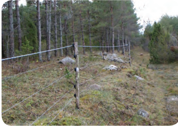
Ka raskel maastikul on võimalik lihtsa ja tõhusa ennetusaia rajamine – karjaaed Kurese maastikukaitsealal.

Kuna enamasti üritavad kiskjad aeda läbida maapinna lähedal karjusetraatide vahelt või aiavõrgu silmadest läbi pugedes, tuleb eriti tähelepanelik olla alumiste traatide paigutuse ja töökorras oleku suhtes. Kui karjamaa paikneb ebatasase reljeefiga maastikul, peab ka karjaaed maapinna kulgemist järgima. Hoolikas peab olema aia üle kraavide, maapinnalohkude, kiviaedade jms viimisel, et elektrikarjuse traadi ja maapinna vahele ei jääks kiskja läbipugemist võimaldavat ruumi. Kindlasti tuleb traatides pingelangu vältimiseks aia alune taimkattest regulaarselt vaba hoida. Võrkaia kasutamise puuduseks on traatvõrgu lähiümbrusest keerukas rohu eemaldamine ning seetõttu ajapikku rohtu- ja kõdusse kasvamine. Samuti venivad traatvõrgust aiad lumerohketel talvedel lume raskuse all välja, kahjustuvad võrgu kinnitused ja aiapostid. Nii kaotavad võrkaiad kiiresti oma vormi ning nende kaitsetõhusus väheneb.