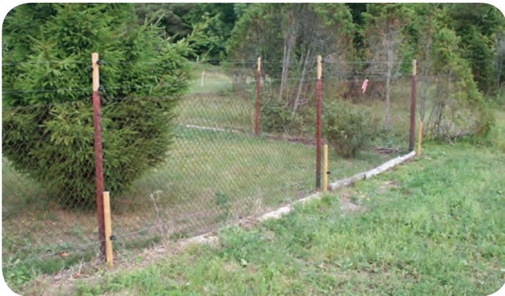
Vana võrkaia saab lihtsalt turvalisemaks täiustada üles ja maapinna lähedale lisatud elektrikarjuse traatidega – aed ümber mesila Harjumaal.