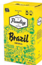
Jahvatatud kohv Brazil Original Paulig, 500 g, 12,98/kg

• Toodeid Eestis. Piltidel on illustreeriv tähendus. Pakkumised kehtivad kuni kaupa jätkub.