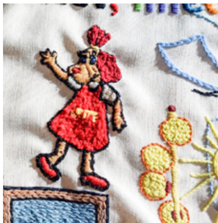
Leiuatajateküla Lotte.