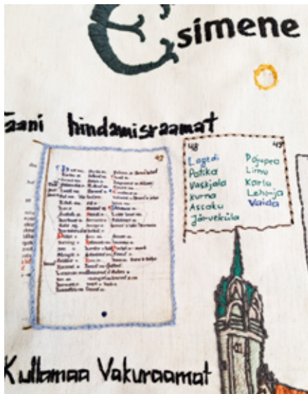
Taani hindamisraamatus mainitud tänase Rae valla külad.