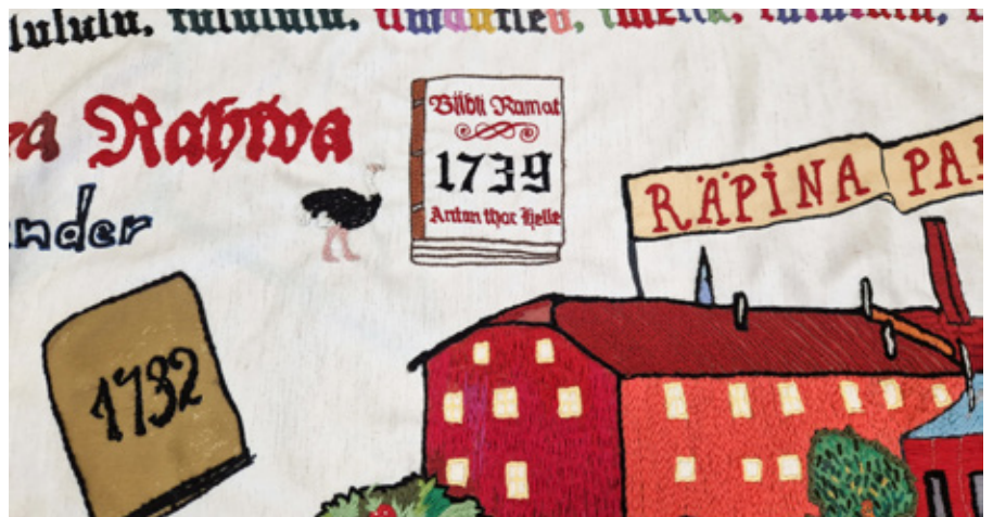
Esimene eestikeelne piibel ja jaanalind raamatuaasta vaibal.