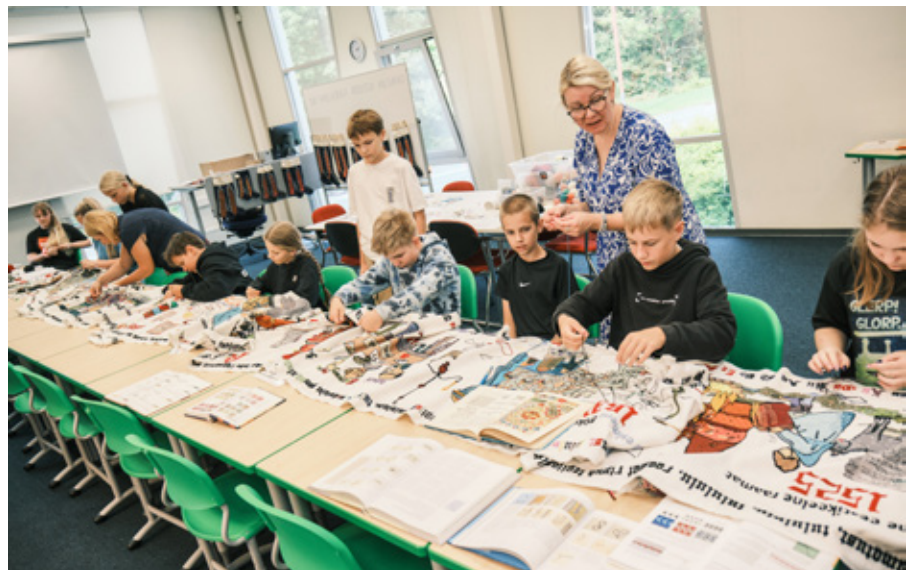
Piltvaipa käisid Jüris tikkimas ka kooliõpilased.