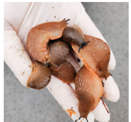
Hispaania teetigu.

• Uusi taimi koju tuues tee neile hoolikas kontroll, istikute mullapall istuta sügavale ja tihenda mullaga, võimalusel hoi taimepotti läbipaistvas kile-