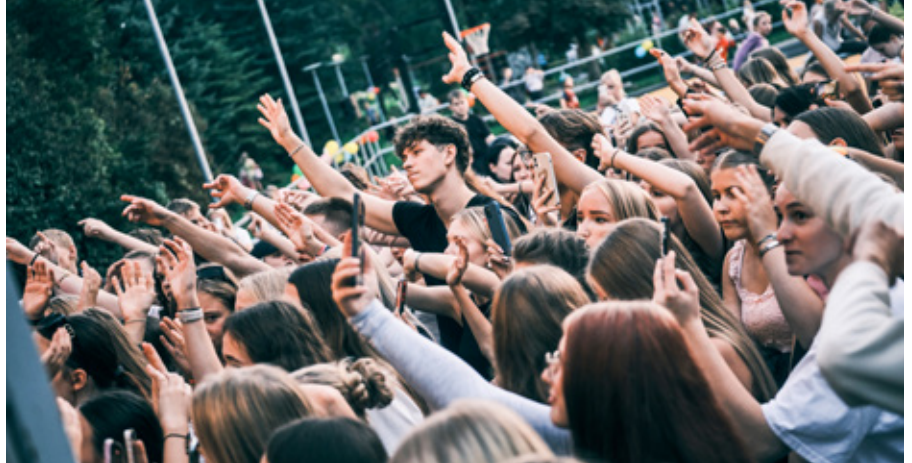
Rae noortefestival 2025.

Rae noortekeskusel on siiralt hea meel näha, kui palju aktiivseid, loovaid