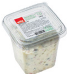
Laadasalat Selveri Köök, 700 g, 5,27/kg