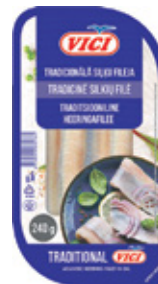
Traditsiooniline heeringafilee Vici, 240 g, 8,29/kg