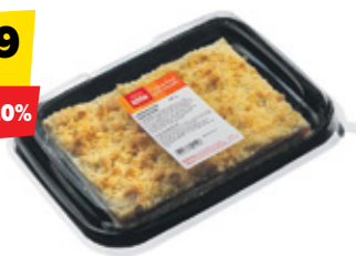
Laadakook (purukook) Selveri Köök, 400 g, 6,73/kg