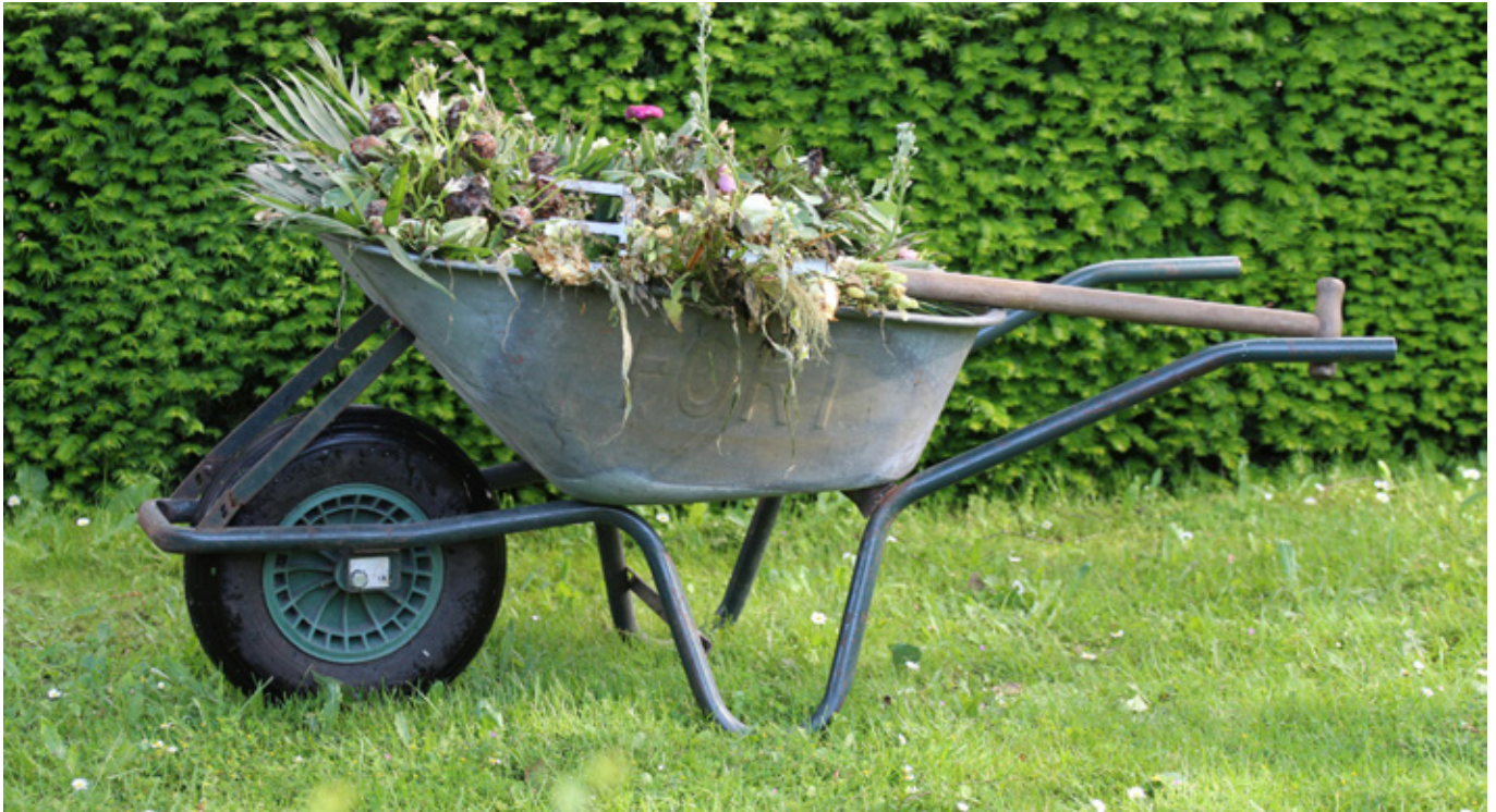
Aiajätmed komposti kohapeal või anna üle selleks ettenähtud kohta.