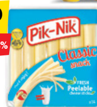
Juustupulgad Pik-Nik, 280 g, 12,46/kg