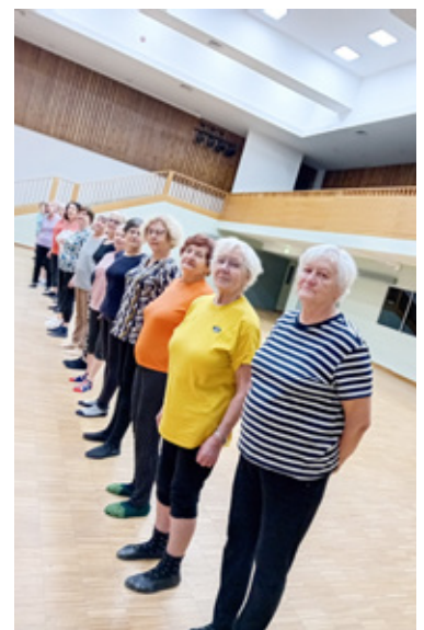
Eakad tervisevõimlemise tunnis.

Rae sotsiaalkeskuse päevakeskus on avatud tööpäevadel kell 10.00–15.00. Pakume võimalust ühiselt aega veeta, ajalehti ja ajakirju lugeda, filme vaadata jm individuaalseid tegevusi ette võtta. Lisainfo telefonil 5880 3504 või 5647 4797 või e-posti aadressil virve.sepp@raesotsiaalkeskus.ee .