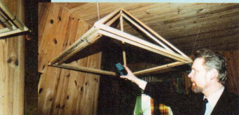
Aparaat näitab, et püramiidi all on õhk ioniseeritud

päripäeva mööda spiraalset trajektoori liikudes. Miinuslaengud tõusevad ka üles, plusslaengud ei lase neid aga välja ja miinuslaengud kogunevad tipu alla ning on sunnitud uuesti tagasi liikuma.