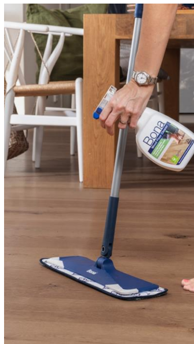
Bona pesuaine kõvadele põrandatele, 1 l spray