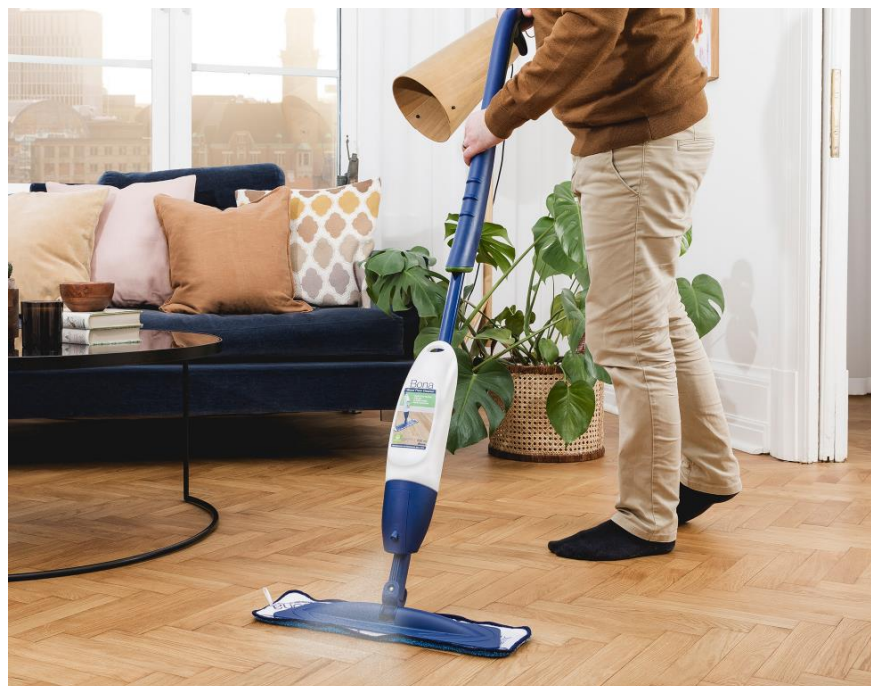
Bona pesuaine kõvadele põrandatele, 4 l