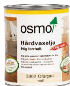
Osmo 3062 õlivaha