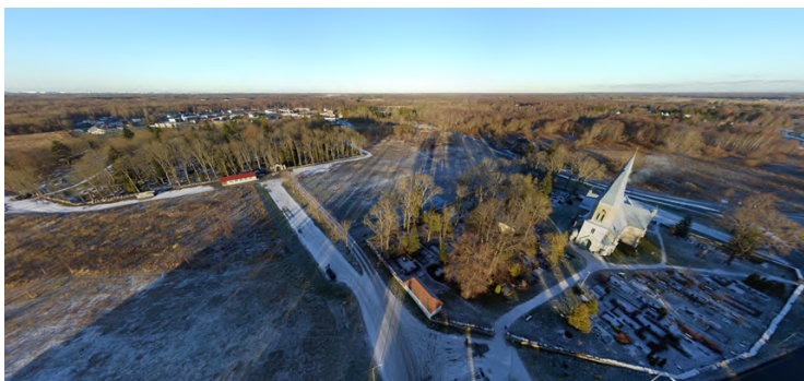
Jüri kalmistu ja kirikaed CopterCam panoraamil.