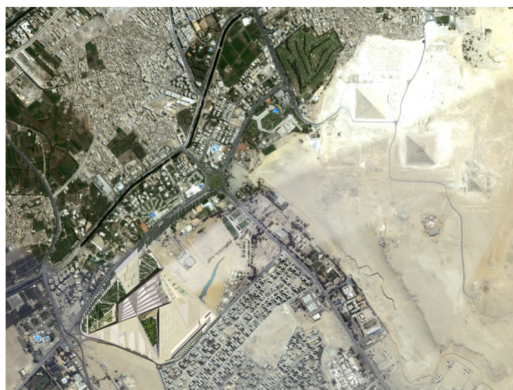
Grand Egyptian Museum'i üldplaneering ja maastikukujundus