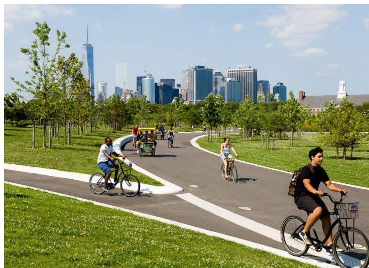
Governors Island'i park ja avalik ruum