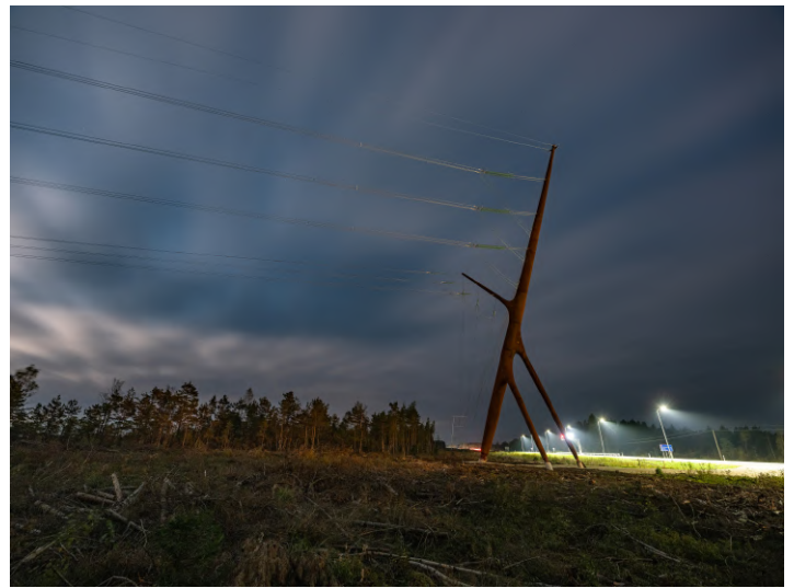
2020 võitja rajatiste kategoorias: kõrgepingemast "Soorebane", Empower AS ja arhitektuuripraxis PART.

Kandidaatide esitamise tähtaeg on 13. september . Konkursi tingimused on leitavad EKELi kodulehelt .