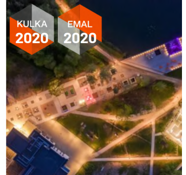
EMALi aastapremiad 2020 laureaadid Täpsemalt vaata Eesti Arhitektuuripremiate kodulehelt