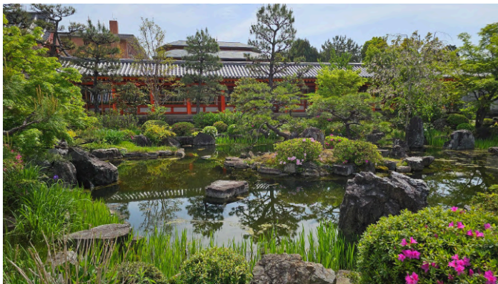
Sanjūsangen-dō templi Hoju-deni tiigiaed