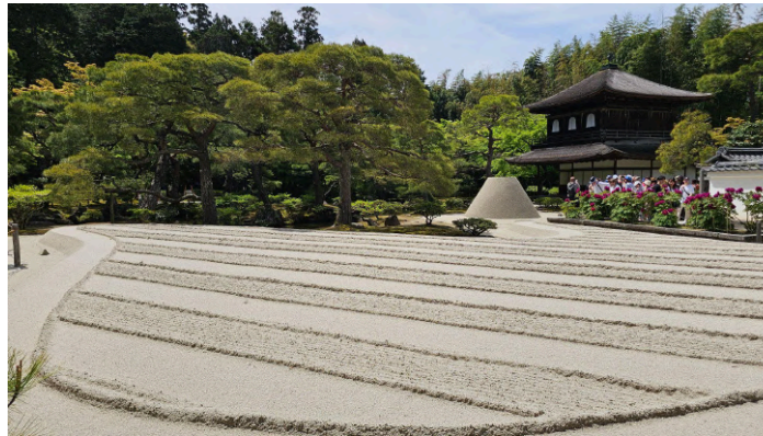
Kuiv maastikuaed/zen-aed Miyama külas

Eriline kogemus oli ka matkapäev mägedes, mille vältel kulgesime piki 8 km pikkust ajaloolist postiteed ühest postijaamast ja külakesest teise. Teekond pakkus hulgaliselt hunnituid loodusvaateid, kus vaheldusid metsad ja mäed, jõed ja orud, kosed ja pühamud. Kuna mägedes on kliima natuke jahedam kui mujal, siis saime teepeatusel rändurite puhemajas nautida ka kuulsat sakurat. Kui mujal oli kirsside õitsemise tippaeg aprilli keskpaigaks juba möödas, siis siin oli veel võimalik seda ilu kogeda. Päeva lõpetas traditsiooniline jaapani onsen, et järgmisel päeval sukelduda Tokyo keeristesse puhta keha ja puhastunud meelega.