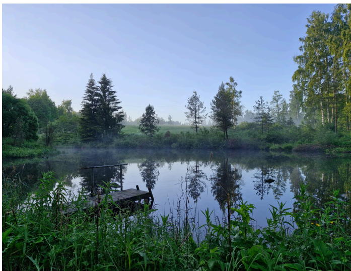
Vihmajärgne udu Põlvamaal

Ärge siiski suvetoimetuste keskel unustage, et aeg-ajalt tasub ikka kiigata EMALi kodulehele ning jälgida meid ka FBs ning Instagramis , et aegsasti kõigi maastikuarhitektuuri uudistega kursis olla. Kohtumiseni sügisel ja ilusat suve!