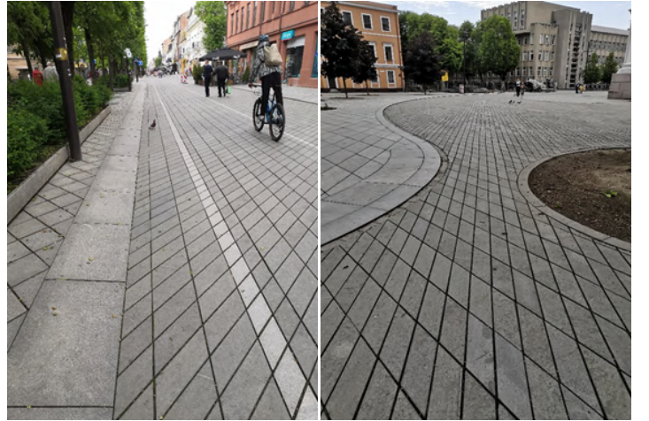
FOTOD 15 ja 16: Rattatee markerimine segaliiklusega alal ning kaarjad äärekivid on vaatamisväärsus omaette!