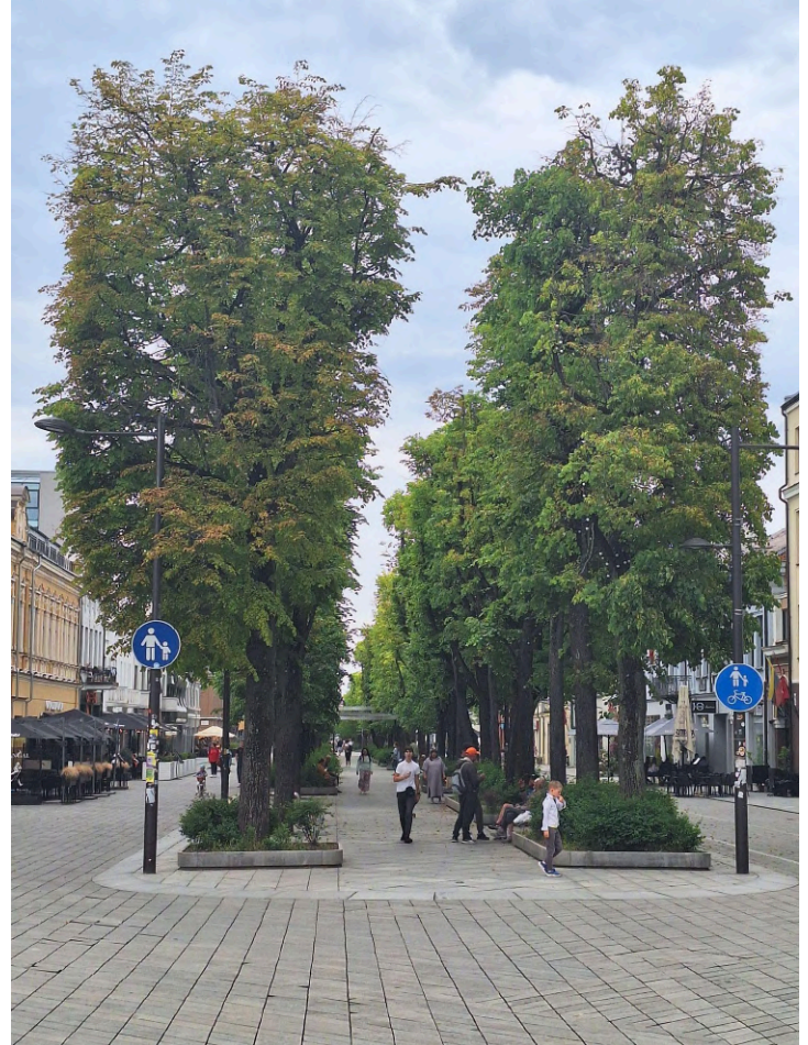
FOTO 8: Kaunase kuulus pika ajaloo jalakäijate tänav Laisves (Vabaduse) puistee

Rekonstrueerimist iseloomustab selge, põhjalikult läbimõeldud kontseptsioon ning kivatendi põhjalikult läbimõeldud paigaldusviis ja silmatorkavalt hea paigalduskvaliteet viitab projekteerimise kõrgele tasemele.