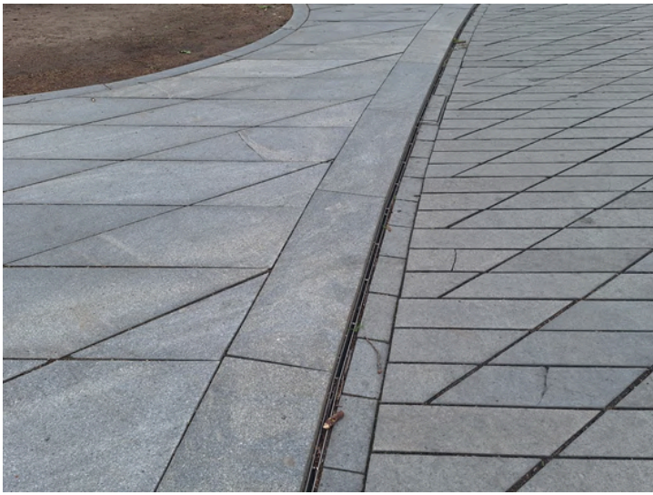
FOTO 10: Kaunase jalakäijate tänaval näeme kivistendi põhjalikult läbi mõeldud paigaldusviisi ja silmatorkavalt head paigalduskvaliteeti, mis viitab projekti kõrgele tasemele