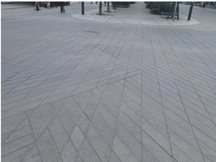
FOTO 11: Ristmik, kus kaks paralleelteed äärmiselt täpselt ühilduvad