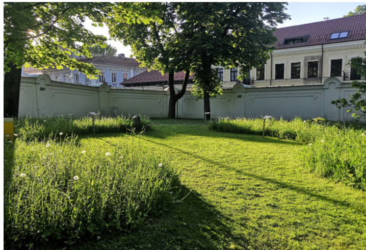
FOTO 5: Vilniuse presidendikantselei aed. Elurikkuse saarekesed püगतud murus

Kes juhtub sellel suvel Vilniusesse, sel soovitame külastada ka Vilniuse presidendikantselei parki, mis asub Vilniuse vanalinnas. Lihtsalt imetusväärne, kuidas vanade põlispuude alla on rajatud väikesed lilleniidud ja putukahotellid, mida raamistab madalalt niidetud muru, mis loob õitsvatele lilleniitudele ilusa raami (foto 5). Jälle kord kogesime, et esteetiline linnaruum loob visuaalselt nauditava elukeskkonna.