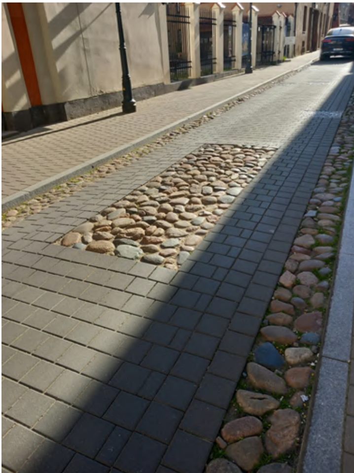
FOTO 7: Vilniuse vanalinna tänavate korrastamisel ja liikluse rahustamisel kasutatakse munakive ja siledapinnalisi graniitpätse. Munakividest saarekesed keset sõiduteed on nii ristmike ees kui ka pikematel teelõikudel kiiruse rahustamiseks

Vilniuse vanalinna tänavate korrastamisel kasutatakse munakive ja siledapinnalisi graniitpätse (foto 7). Kõnnitee ääres munakivi ja keskel sile tasapind. Liikluse kiiruse reguleerimiseks on tee keskele laotud munakividest alad ehk nii autol kui jalgratturil on võimalik õiget kiirust valides sõita siledal alal. Vanalinna teenindav ja hooldav transport, mida meie kohtasime, oli väikesegabariidiline ja elektrimootoritel töötav. Rasked masinad lõhuksid teekatendi konstruktsiooni.