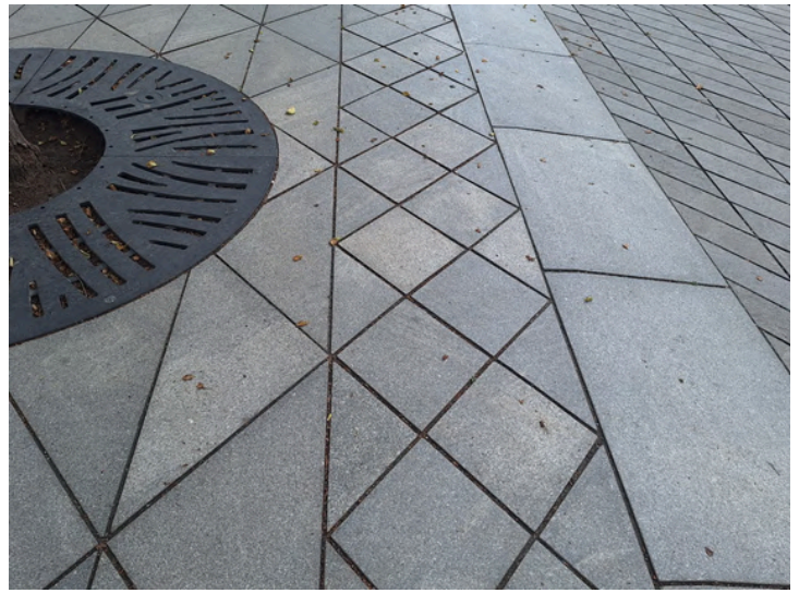
FOTO 14: Kõrguste vahed jalakäijate liikumise tasapinna ja kergliiklustee tasapinna vahel on laia äärekivi abil sujuvalt nulli viidud. Pööra tähelepanu äärekivi profiilile.