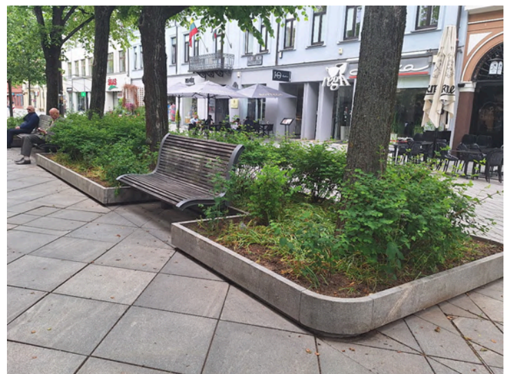
FOTO 9: 1980. aasta jalakäijate ala kujundusest pärinevad puude ümbrised

Tähelepanu vääriks on jalgrattatee markeering kirikuesisele sillutisel, kaevuluukide viimistlus, ühelt kivisuuruselt teisele üleminek, kaarjad äärekivid ning kergliiklusteede ja jalakäigu tsoonide kõrguslik tundlik eristamine (fotod 10–16).