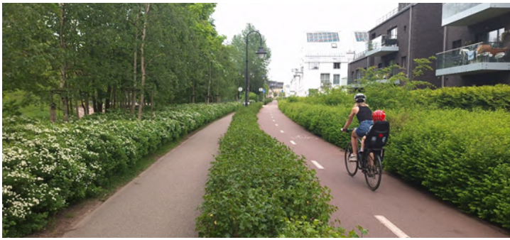
FOTO 6. Uusarenduste jalgteed, rattateed ja hoonestus on üksteisest eraldatud põsaste rida- ja erineva kõrgusega põsaste lausistutustega

Vilniuse vanalinna tänavate korrastamisel kasutatakse munakive ja siledapinnalisi graniitpätse (foto 7). Kõnnitee ääres munakivi ja keskel sile tasapind. Liikluse kiiruse reguleerimiseks on tee keskele laotud munakividest alad ehk nii autol kui jalgratturil on võimalik õiget kiirust valides sõita siledal alal. Vanalinna teenindav ja hooldav transport, mida meie kohtasime, oli väikesegabariidiline ja elektrimootoritel töötav. Rasked masinad lõhuksid teekatendi konstruktsiooni.