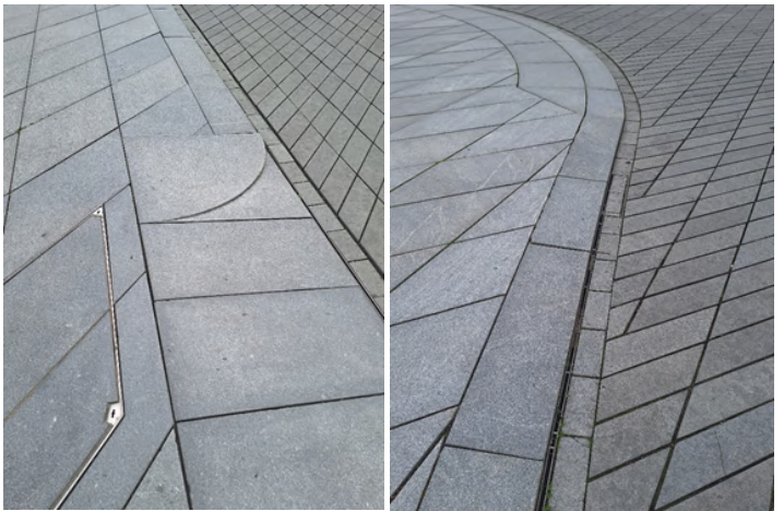
FOTOD 12 ja 13: Jalakäijate liikumise tasapinna ja teenindava transpordi tasapinna erinevus on ca 1cm. Kõrguste vahed on väga tundlikult ühildatud laia ümardatud servaga äärekivi abil. Äärekivi ees on pilurenn, mida on võimalik ka kaarjalt paigaldada. Pööra tähelepanu sissesõidutee kivi profiilile! Tähelepanu väärivad ka kaevuluukide kivi vormist tulenev rombjas kuju ja selle katmine kõnniteekiviga.

Kokkuvõtteks – tundsiime Leedus lugupidavat suhtumist haljastusse ja nägime linnaruumi projekteerimise ja rajamise kõrget kvaliteeti. Kindlasti on linnaruumi süstemaatilisel korrastamisel abiks 2021. aastal koostatud „Vilniuse tänavadisaini juhend“.