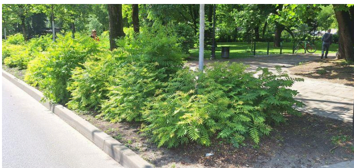
FOTOD 1–3: Suurte puude alla istutatud põõsad