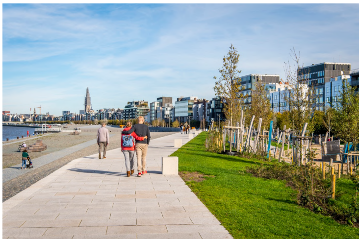
Schelde jõe kaid

Avaliku ruumi kategoorias andis žürii välja kaks võrdse kaaluga esikohta. Neist esimeseks on Schelde jõe kaid Antwerpenis (autoriks Proap maastikuarhitektuuribüroo), mida tunnustati selle läbimõeldud materjali- ja ruumikasutuse, samuti oskusliku tõusu- ja mõõnaveega arvestamise eest. Teise esikohatöona tõsteti esile Zürichi lennujaama rekreatsiooniala Park (autoriks Studio Vulkan koos Robin Winogronidiga), mida kirjeldati kui "peenetundelist palimpsesti ala kujundanud looduslikest ja inimtekkelistest protsessidest".