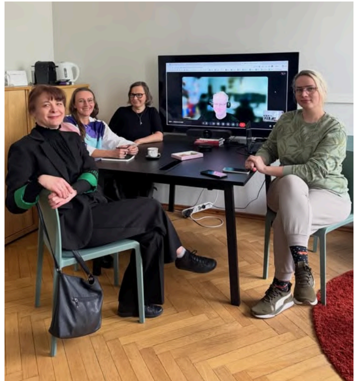
Uus juhatuse esimesel koosolekul

Sügisel lööme ametliku partnerina esmakordselt kaasa ka TABi programmis. Selle raames kureerime Linnahallis toimuva peanäituse "Mis maksab?" väliruumi. EMALi eestvedamisel toimuvad ka välinäitus arhitektuurimuuseumis, rattatuurid ja sügisseminar. Juba 2. juunil toimub Linnahalli katusel EMALi ja TABi ühine avaaktsioon „Mida külvad, seda lõikad. Vahepealne maastik“. Olete kõik lahkesti oodatud!