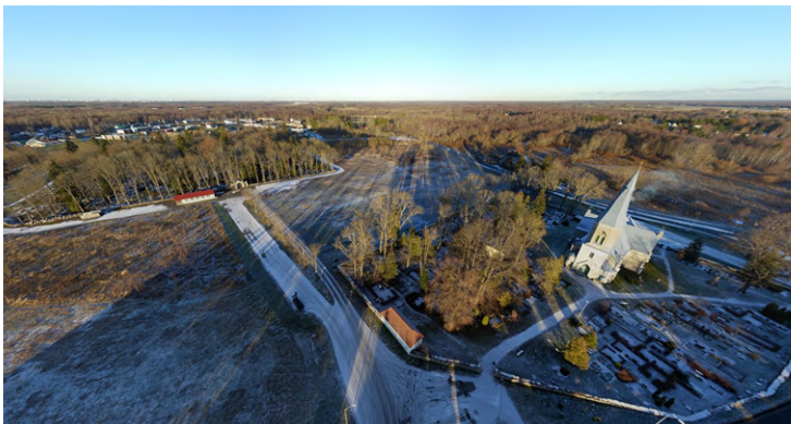
Jüri kalmistu ja kirikaed CopterCam panoraamil. Kuvatõmmise allikas SIIN