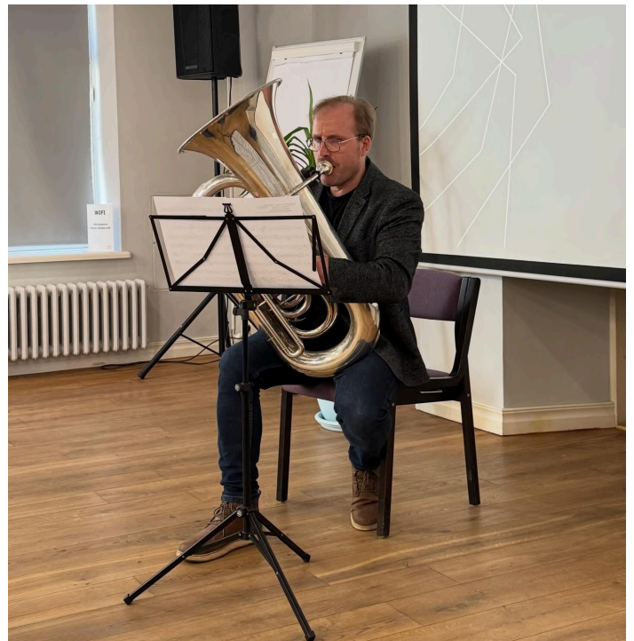
Remi tuubasoolo kevadseminaril.

Lisaks pinnale, kus meie tublid töötajad saavad töötada, tähendab see laiemalt ka sarnaste eesmärkidega seltskonnas kohal olemist. Samas sild Tartuga peab jääma olulisele kohale, kuna see on EMALi sünnipaik ning vaimne kodu, kus maastikuarhitektuur Eestist sellisena, nagu me seda praegu tunneme, üles kasvas.