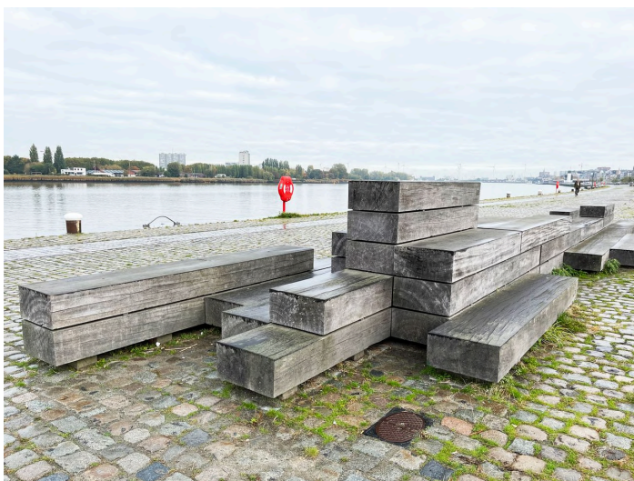
Scheldi jõe kaldakindlustused on lahendatud maastikuna