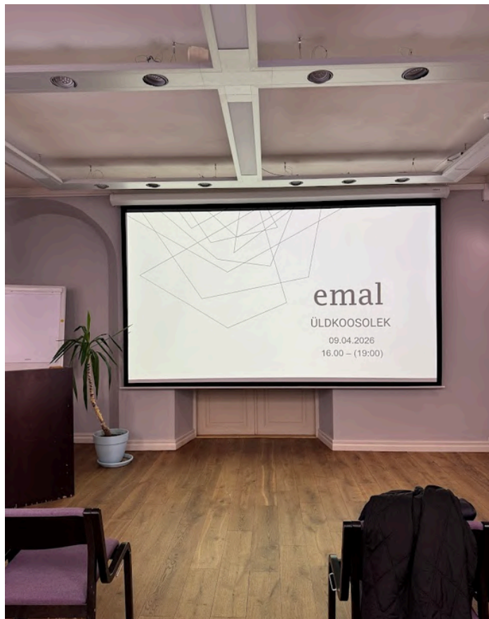
Üldkoosoleku algus