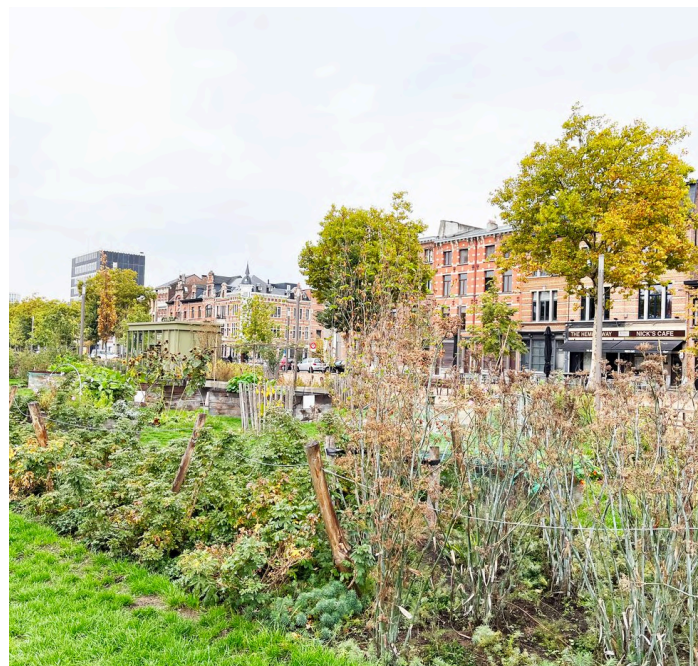
Amsterdami Zuidpark on rajatud endise suure parkla asemele

Kokku on saanud mitmed ohtlikud tegurid. Kõige hullem on ilmselt autoritaarsete poliitiliste suundumuste esilekerkimine. Psühholoogiliselt on väga lihtne rõhuda varjatud hirmudele ja eitamismehhanismidele. Kui inimesed hääletavad poliitiku poolt, kes räägib linnade rohestamisest ja looduse taastamisest, siis tunnistavad nad justkui, et oleme katastroofi lävel. Aga niikaua, kui nende auto sõidab ja kõik tundub korras olevat, eelistavad nad mitte teada ja tunnistada, kui ulatuslikult on maailm muutunud. Inimkond ei ole valmis muutma oma suhtumist ja suhet loodusesse, vähemalt mitte ulatuses, mis on muutuse saavutamiseks kriitiline.