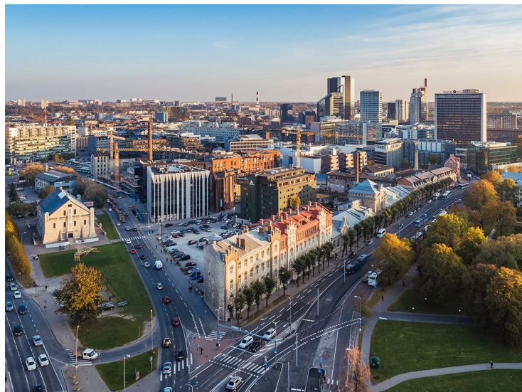
Installatsiooni ala.

Tallinna Arhitektuuriennaali TAB 2022 rahvusvaheline installatsioonivõistlus „Rahulik ehitus“ pakub arhitektuuritalentidele võimalust kavandada ja ehitada eksperimentaalne avaliku ruumi installatsioon Tallinna südalinnas. Installatsioonivõistlusele oodatakse noortelt arhitektidelt ja disaineritelt projekte, mis läheneksid ehitustehnoloogiatele inimkeskselt ning süvendaksid meisterlikkust, toetaksid traditsioonilisi oskusi ja kohalike materjalide taaskasutust, leidlikkust ja keskkonnaga kohandumist. Installatsiooni asukoht on jalakäijatele mõeldud roheala linna ühe tihedama liiklusega tänava ääres, mis ühendab sadamat ja kesklinna. Installatsioonivõistluse esimese etapi tähtaeg on 22. aprill , teise etapi tähtaeg 10. september . Lisainfo SIIN .