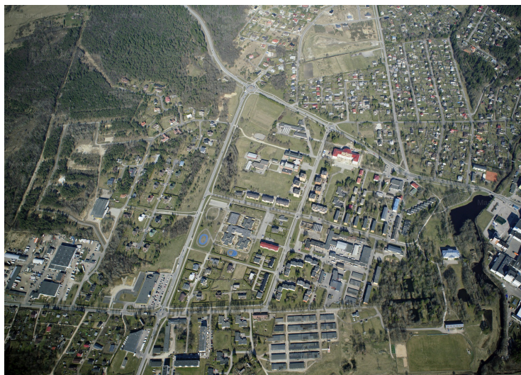
Maa-ameti fotoladu 2020

Saku Vallavalitsuse eesmärk on rajada Saku aleviku keskuse alale kaasaegne vallasüda, mis toetab aastaringseid tegevusi, loob uue ruumilise kvaliteedi, on valla esindusala koos olemasolevate ja loodavate vaatamisväärsuste ja maamärkidega. Tulemuseks peab olema inimhõõtmeline, multifunktsionaalne ja universaalse tänavadisaini põhimõtetest lähtuv avalik ruum. Võistluse tulemusena soovitakse näha vallasüdame ruumilist visiooni. Konkursitööle võib järgneda täpsustav kujunduskava koostamine, et Saku aleviku tulevased suuremad ruumiotsused oleksid läbimõeldud, terviklikud ja ühtsed. Kava on edaspidi aluseks kõikidele Saku aleviku avaliku ruumi projektidele. Pakkumuste esitamise tähtaeg on 30. aprillil . Lisainfo SIIN .