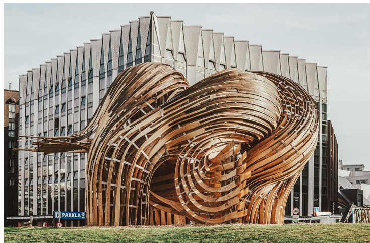
TAB2019 installatsioon "Steampunk".