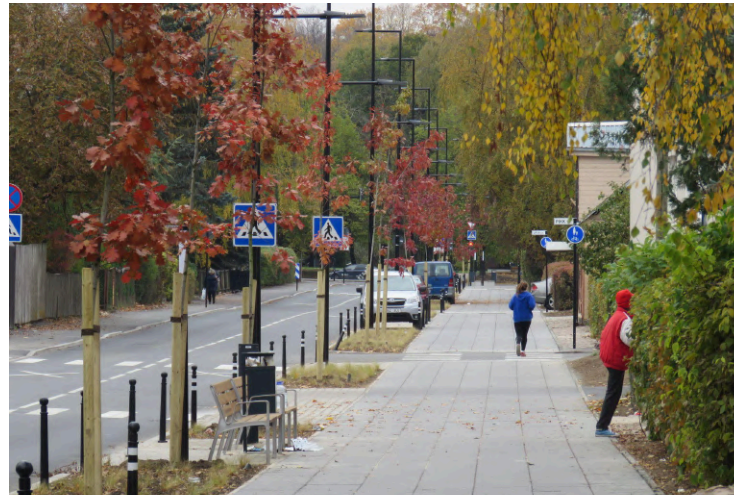
Roosi tänav.