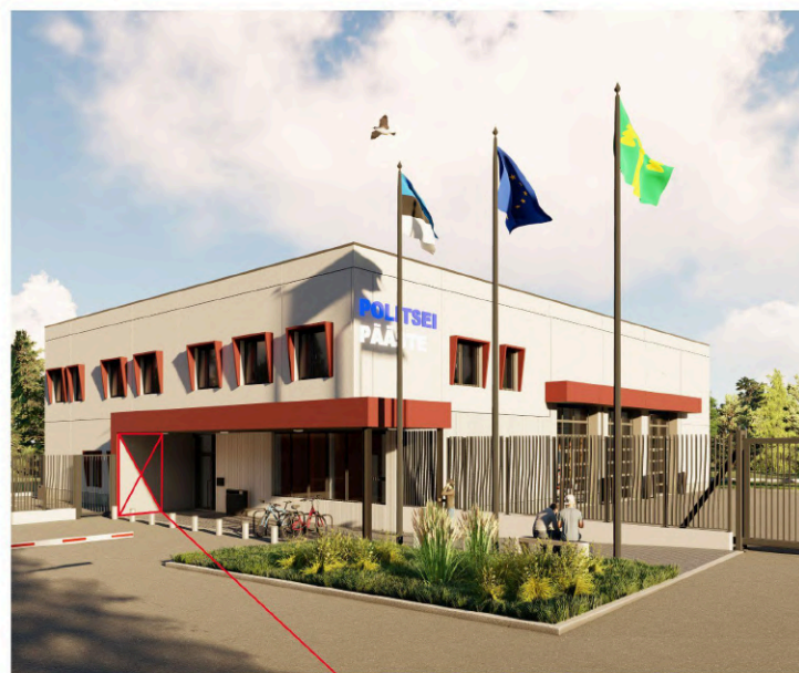
KUNSTITEOSE VÕIMALIK ASUKOHT

Osalemistaotluste ja kavandite esitamise tähtaeg on 21. veebruaril