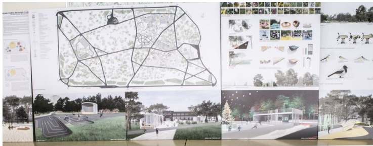
Eelmisel aastal toimunud Männi pargi ideevõistluse tööd

Võistluste töögrupis osalemise soovist palume teada anda 7. veebruariks aadressil info@maastikuarhitekt.ee