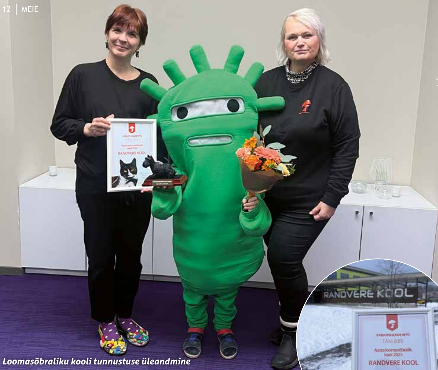
Loomasõbraliku kooli tunnustuse üleandmine