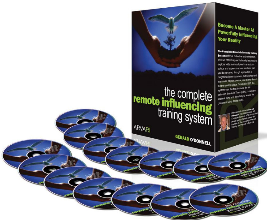
Täielik Kaugmõjutamise treeningsüsteem