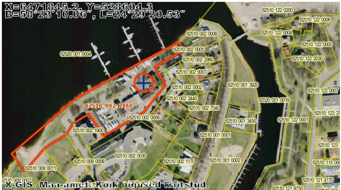
Lisa 1. PJK jahisadama maa-ala plaan