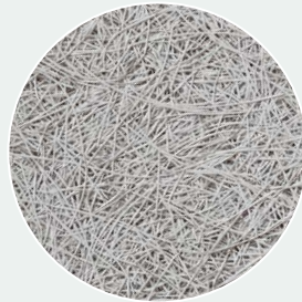
Stein-Grau gestrichen Stone Grey (SG) RAL 7035*