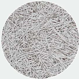
Wolken-Grau gestrichen Cloud Grey (CG) RAL 7047*