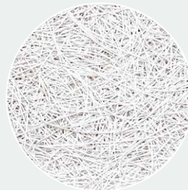
Weiß gestrichen (WP) RAL 9003*