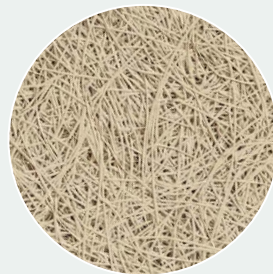
Natürlich gestrichen (NP) RAL 1015*