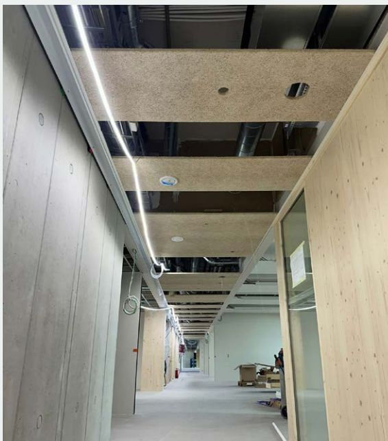
CEWOOD koridora plātnes

! Lai iegūtu detalizētas uzstādīšanas instrukcijas un svarīgu informāciju, skatiet failu "Koridora uzstādīšanas risinājums", kas pieejams CEWOOD lejupielāžu sadaļā, sadaļā "Uzstādīšanas norādes".