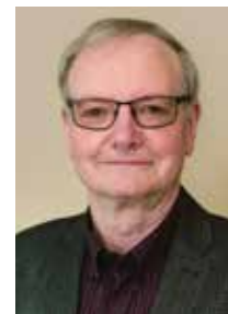
Ingo Normet teatrilavastaja