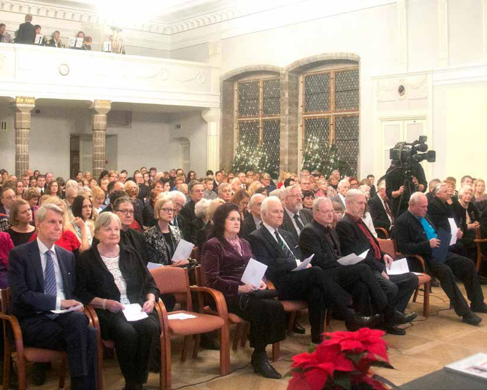
Sponsorite ja stipendiaatide austamiskontsert Mustpeade Majas 14.12.2014