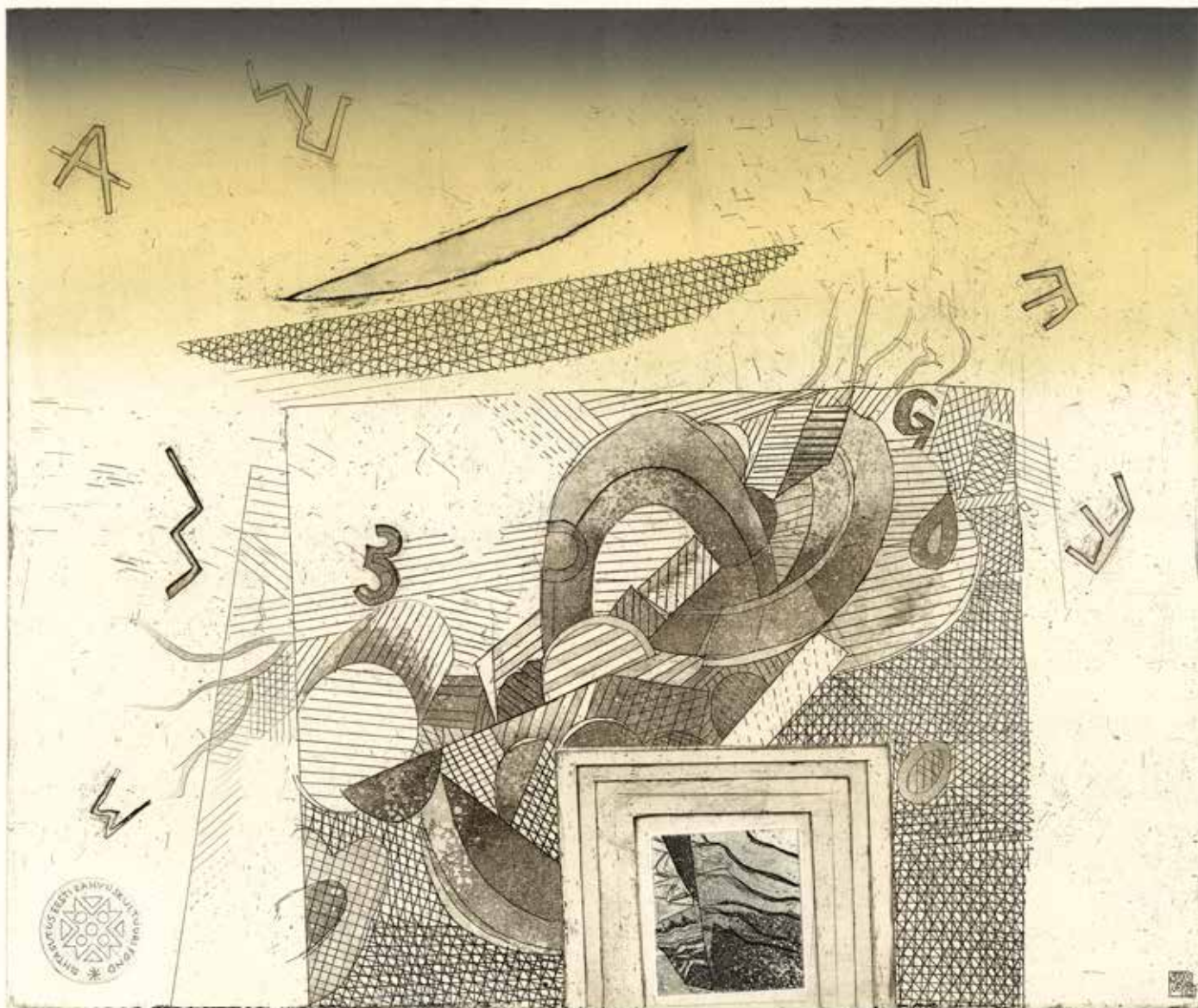
5/25 „Salasõna” (söövitamine) Vive Tolle „Salasõna”. Söövitus, 2012.