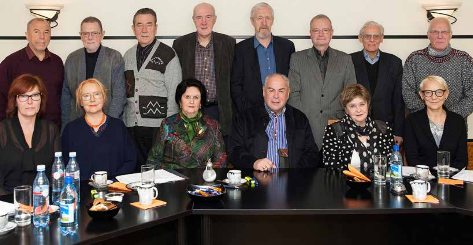
SERKF nõukogu liikmed ja töötajad 22.11.2014