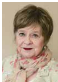
Leelo Tungal kirjanik