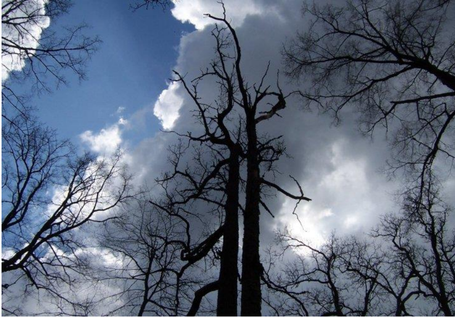
Zilākalna ozoli ir ne vien neparasti slaidi un gari, bet aug arī pāros