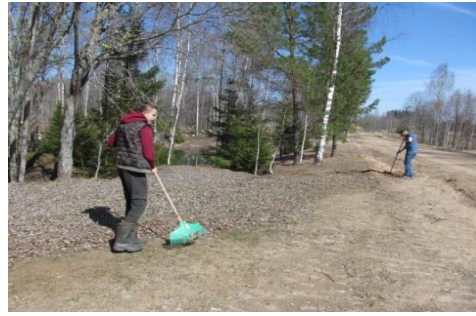
2018. 29.04 pie Staru akmeņiem.