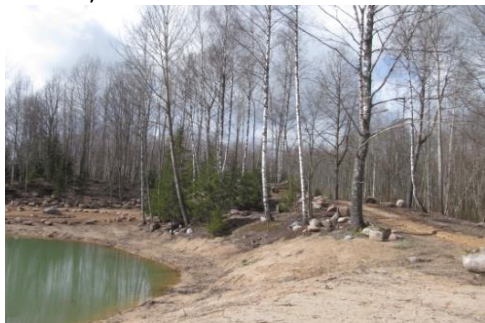
Māras dīķis, dziedinātava u.c. dīķi izveidoti par cilvēku saziemotiem līdzekļiem