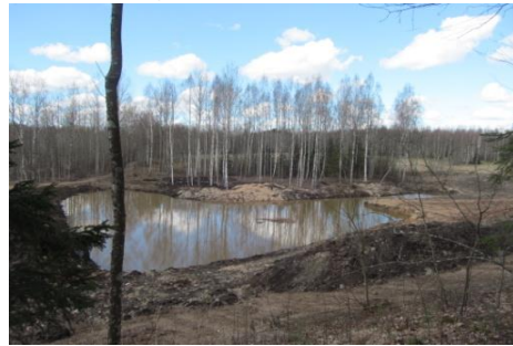
Kalna otrā pusē Saules dīķis