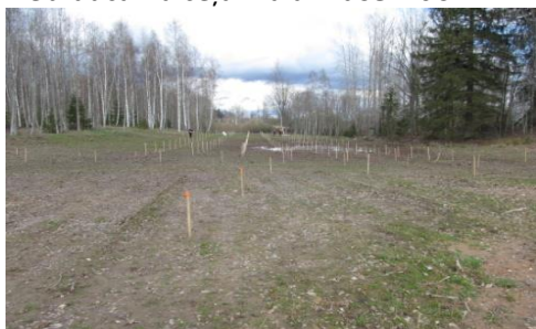
Birztaliņas staru stādīšana 29.04.