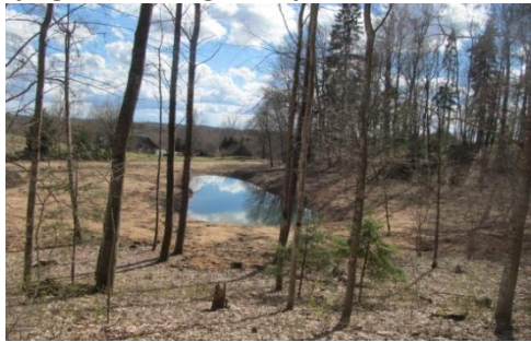
Piebraucamā ceļa malā Auseklītis