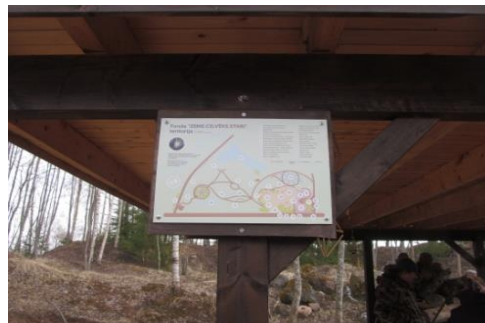
Ģimenes stūrītis, nojume uzcelta par ES projekta līdzekļiem