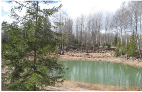
Māras dīķis un Zemapziņas aplis.