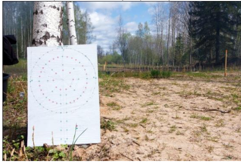
Svētbirzs centra apļos 33 ozoli, 33 liepas, 33 bērzi, vidū spoguļšķīvis, iegādāti par fonda cilvēku saziemotiem līdzekļiem