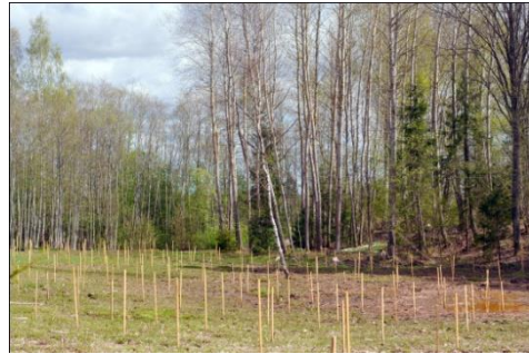
Staros 300 bērzi- Kocēnu novada domes dāvana.