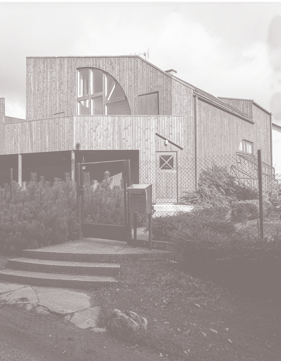
11 Nn Venna maja Tallinnas Meriväljal Ida tee 50. Eesti Arhitektuurimuseum.