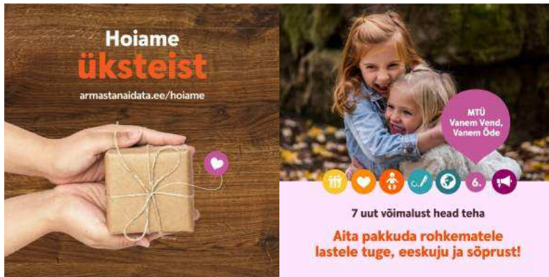
Valik 2021. aasta kampaaniate visuaale

Vahetult enne jõulukampaaniat ehk 30. novembril toimusid annetustalgud, millega kaasnesid samuti kommunikatsioonitegevused. Talgupäeva jooksul toetas enam kui 2100 annetajat “Ma armastan aidata” keskkonna vahendusel enda jaoks südamelähedasi organisatsioone, annetades neile kokku 54 153 eurot. Koos Swedbanki võimendusega kasvas talgupäeva annetuste kogusumma 94 153 euronit.