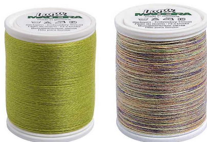
Madeira villane niit.

vesipesu, mitte kasutada klooriühendeid. Toodetakse Saksamaal 379 värvitoonis. Tootevalikus on esindatud ka metallikniidid DECORA, villased niidid LANA (sobivad tikkimiseks ja masinal õblemiseks), siidlõngad, rayon, polyester ja viskoosniidid.