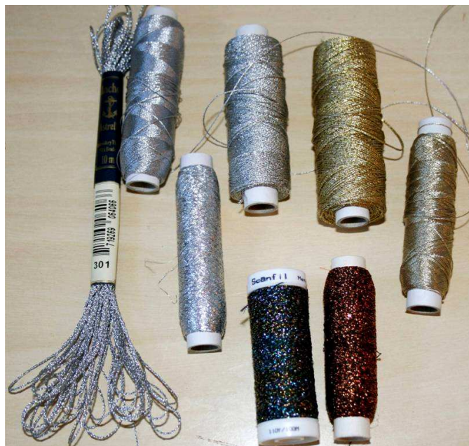
Erinevad metalliklõngad.