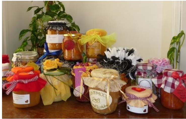
Foto 1. Tudengite hoidised