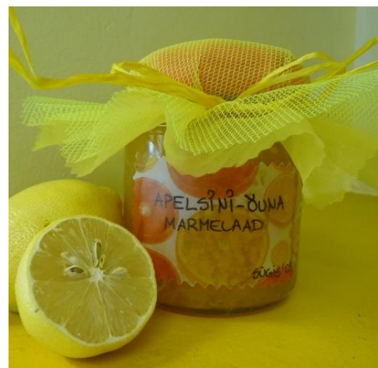
Fotod 2-3. Võimalusi hoidiste kaunistamiseks