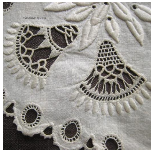
Fragment laudlina mustrist.

Kuni 20. sajandi keskpaigani oli linane kangas voodipesu põhimaterjal ning neid tekstiile valmistati ja kaunistati tikandiga kodus käsitsi. Linasest riidest valmistati ka aluskleite ja särke. Alates 1800. aastate keskpaigast tõusis puuvill linase tikandimaterjali kõrvale.