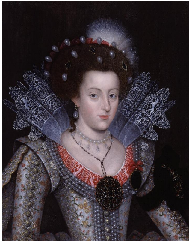
Printsess Elizabeth Stuart, hilisem Böömimaa kuninganna, kandis reticella pitsiga kraed Tundmatu kunstnik, 1613, National Portree Gallery, London.

Lõuna- ja Kesk-Euroopas arenesid 16. ja 18. sajandil välja peened tikanditehnikad, mille mudelid avaldati trükitud mustiraamatutes Itaalias, Prantsusmaal ja Saksamaal. Kesk-Euroopas kasvatati lina ja toodeti väga peeneid kvaliteetkangaid. Välja töötatud tikkimistehnikad: