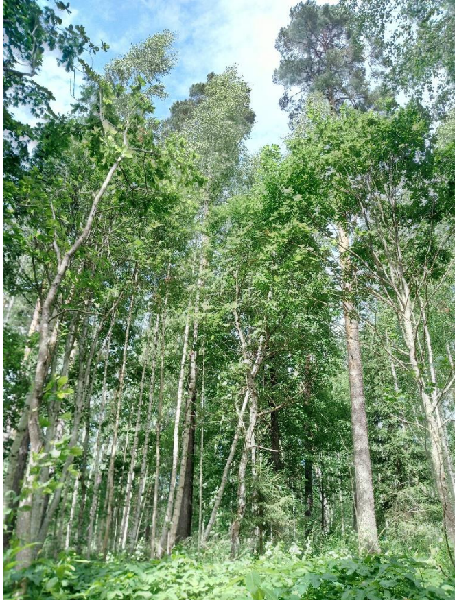
Pildil on puhkemajanduslikult väga aktiivselt kasutatav eramets asula servas, kus on tehtud ca 25 aastat tagasi turberaieid ning hiljem on valgustusraiega eemaldatud sarapuuvõsa. Männik asendub järk-järgult eriliigilise lehtpuumetsaga, järelkasvus on näha kuuske.

Surnud puid tuleb hoida ka puhke- ja virgestusaladel, kuid teeradade ümber tuleb ohtlikele puudele pöörata eritähelepanu ning need vajaduse korral eemaldada. Surnud puud metsas võivad olla