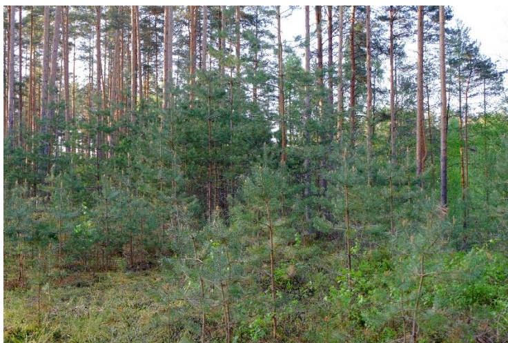
Kui kasvukoht on sobiv, siis on valikraietega võimalik männikut majandada nii, et peapuuliik ei muutu. Pildil valikraietega majandatav männik, kuhu rajatud häilus on näha elujõulist järelkasvu.

Kohalike kaitsealade puhul kehtib looduskaitsealade määratletud piiranguvööndi režiim, mis vaikumisi keelab uuendusraieid, kui kaitse-eeskiri ei sätesta teisiti. Seega võib ka kohalike kaitsealade puhul uuendusraieid välistada ja majandada kogu ala püsimetsana, kui see on säilitavate väärtuste seisukohast vajalik. Kui eesmärk on kaitsta metsa kui ökosüsteemi, siis on püsimetsandus selle sihi saavutamiseks väga hea valik.