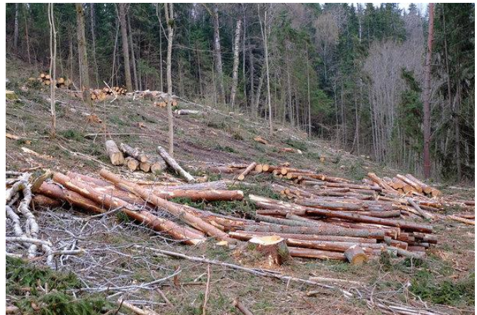
Lageraie Haanjas.

Peale lageraiet istutatakse uus metsakultuur või kasvavad sinna looduslikult uued noored puud. Lageraiejärgselt tekkinud elustik taandub muutunud valgustingimuste, tekkinud okkavariste jt põhjuste tagajärjel. Üldiselt on selliste koosluste elurikkus väga vähene , samuti on tekkinud tihnikud esteetiliselt ja rekreatiivselt väheväärtuslikud.