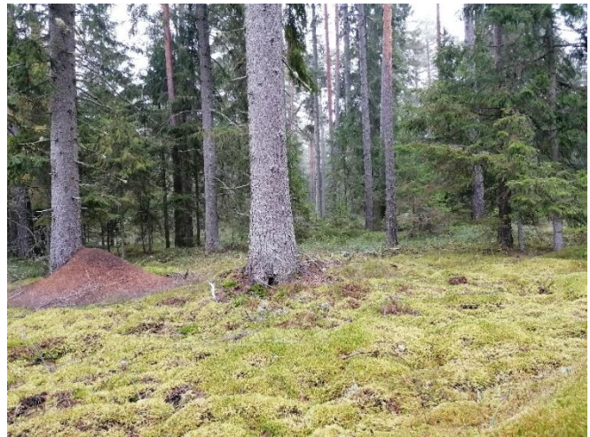
Püsimets Vormsil.

Lageraiete negatiivse keskkonnamõju vähendamiseks soovitatakse sageli metsi majandada püsimetsana. Soovitud jagatakse muu hulgas metsanduse arengukava aastani 2030 alusuuringu mitme peatüki järeldestes. Samuti on sarnasele järeldestele jõutud naaberriikides, näiteks analüüsiti 2018. aastal Soomes biomajanduse strateegiat ja leiti, et metsakasutusvõtete kombineerimine, sealhulgas püsimetsanduse laiem rakendamine aitab leevendada metsakasutuse mahu suurenemise negatiivset mõju elurikkusele ja looduse võimele pakkuda ökosüsteemi teenuseid (Eyvindson, Repo, & Mönkkönen, 2018).