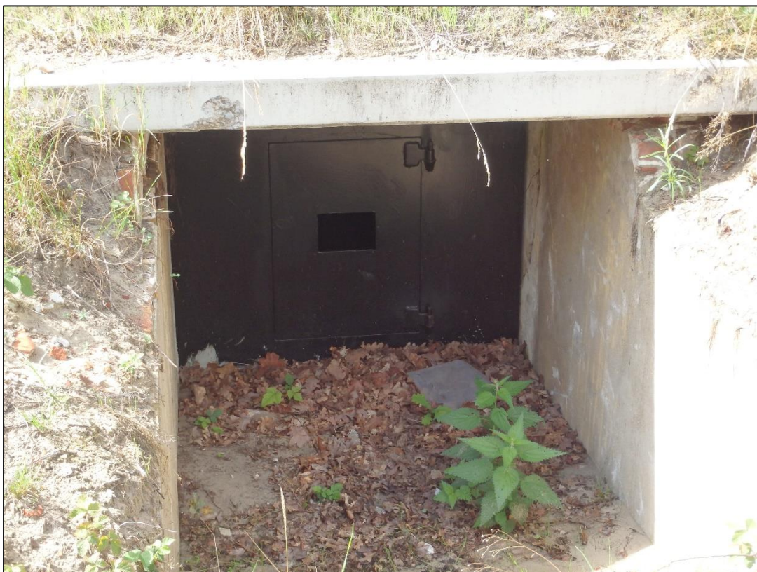
Foto 7. Hollandlaste sõnul on just selline sissepääs nahkhiirtele sobivaim.