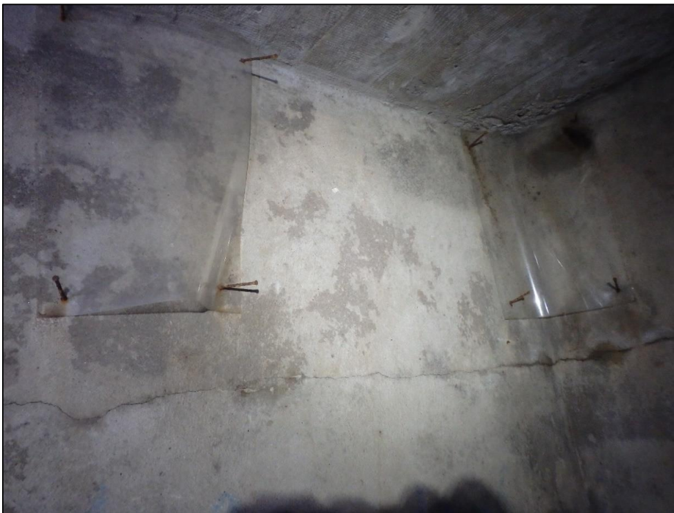
Foto 9. Hollandlased katsetavad, kas nahkhiirtele sobib talvituskohaks kile ja seina vahele jääv pragu.