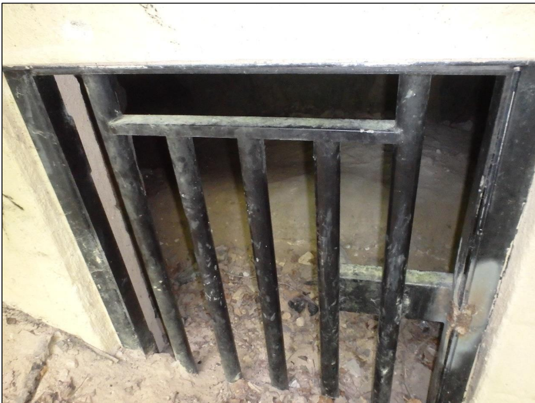
Foto 19. Mõnede avade puhul on loobutud lukustamisest ja kasutatakse keevitamist, st kord aastas, kui nahkhiiri seiratakse, lõigatakse keevitus lahti ja pärast keevitatakse jälle kinni.