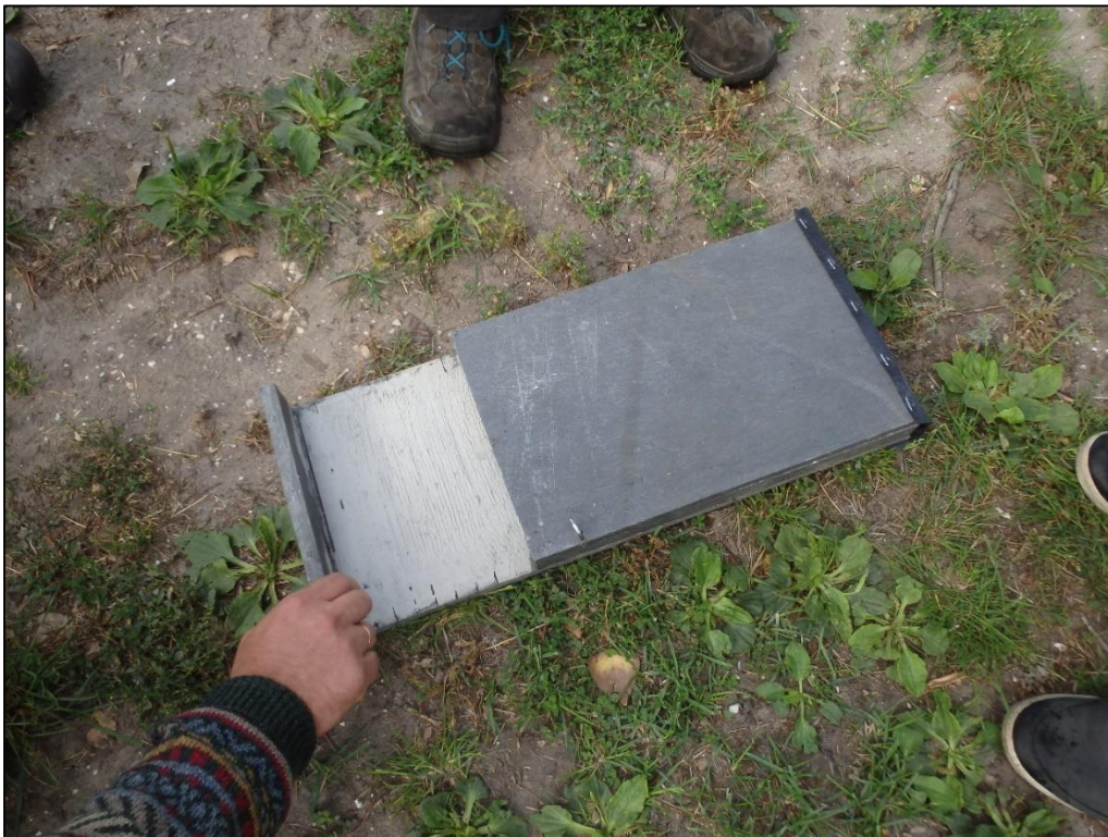
Foto 3. Hollandlaste sõnutsi nahkhiirtele sobivaima ehitusega varjekast.