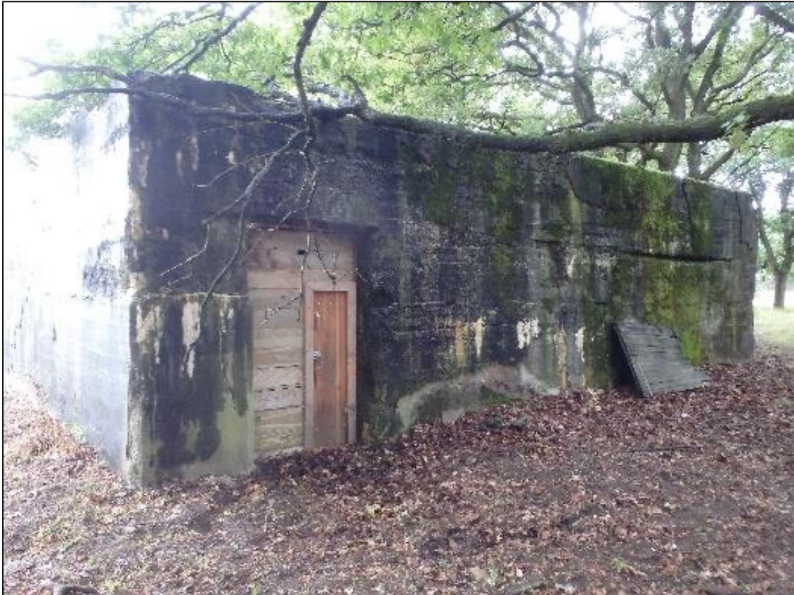
Foto 22. II maailmasõja aegne maapealne punker Schaarsbergen'is. Näha on puituks, mille kohal vaid väike lennuava, aga koolitaja väite kohaselt on see nahkhiirtele piisav.