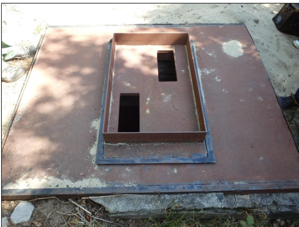
Foto 11. Mõned punkrid on horisontaalse sissepääsuga ja suletud ka horisontaalse terasuksega. Hollandlaste väitel lendavad nahkhiired ka sellistest horisontaalsetest avadest peatumata sisse ja välja.