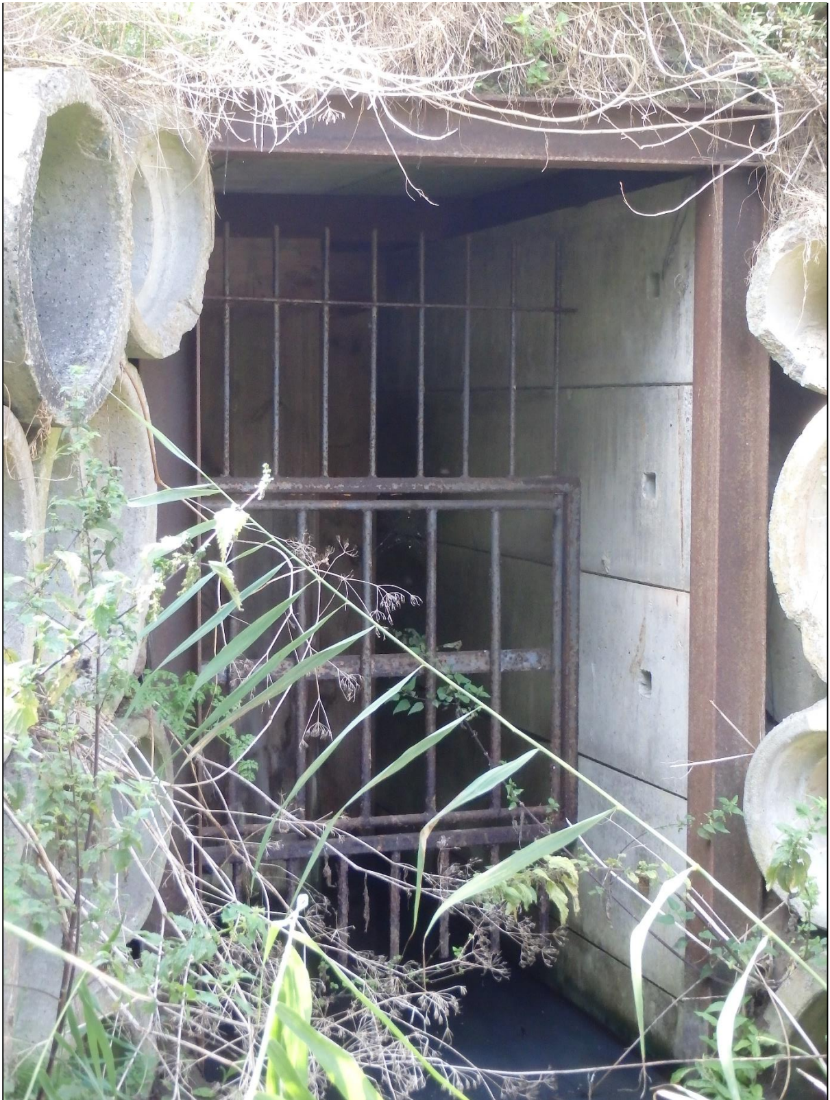
Foto 4. Trellitatud punker Slootdorpi lähisel, kus on kasutatud nii veetõket kui ka vertikaaltrelle. Hollandlaste jutu järgi on see hea kombinatsioon.