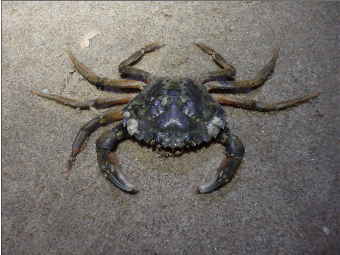
Foto 5. Üks Põhjamere krabidest Julianadorpi lähistel rannal.