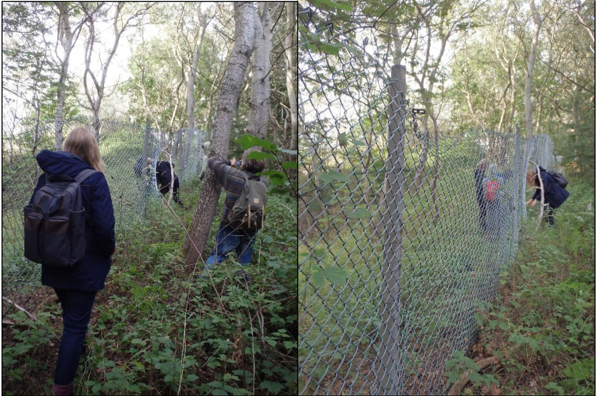
Foto 12. Näide tarast, mis inimesi kaitsealuselt alalt eemal ei hoia.