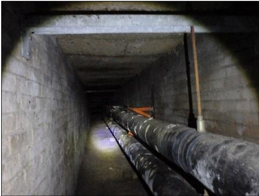
Foto 26. Ka sellistes maa-aluse kütetorustiku ruumides võivad talvitada nahkhiired.