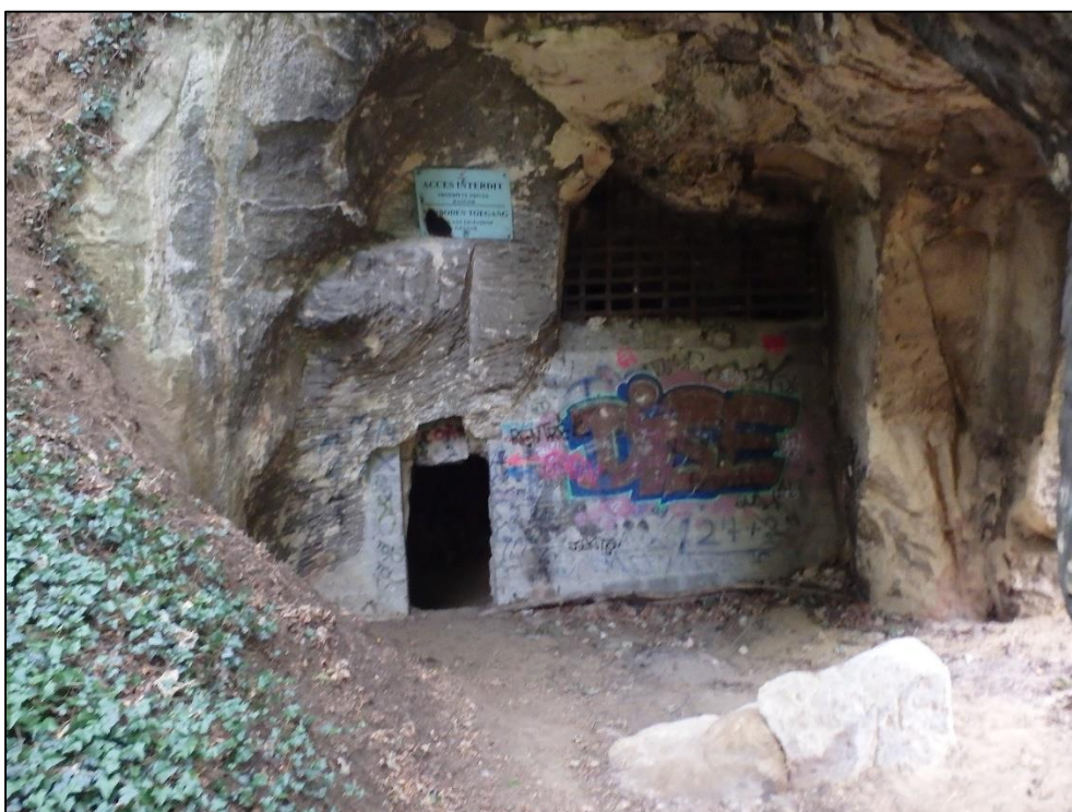
Foto 21. Limburgi päeva viimase kohana sõitsime üle piiri Belgiasse ja külastasime põgusalt kaevanduskäike, mis on inimestele avatud, et saada aimu sellest, millised on näevad siinsed koopad välja seestpoolt.