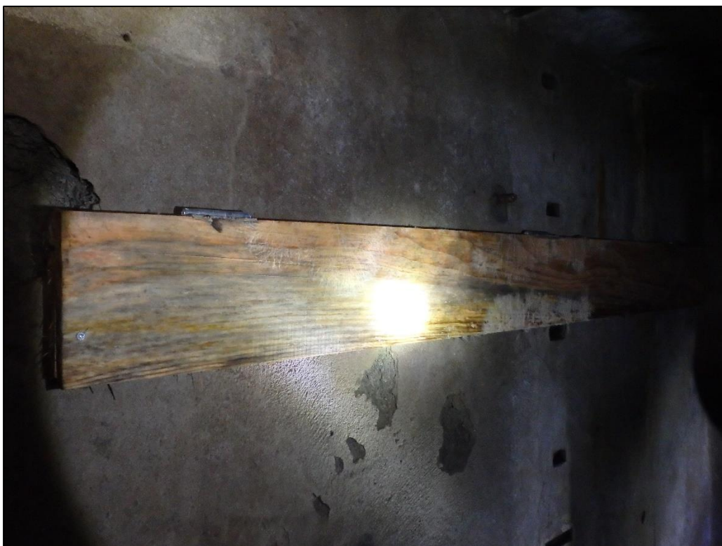
Foto 23. Schaarsbergen'i punkrites leidub teistsuguseid nahkhiirte varjekohti, siin fotol on selleks hingedega seinale kinnitatud laud.