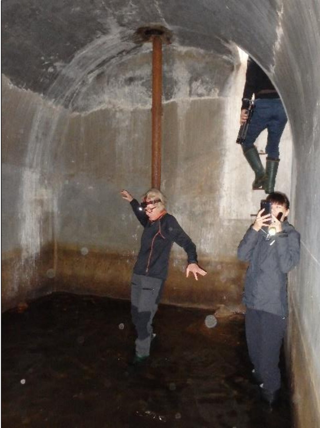
Foto 25. Nahkhiireuurijatel tuleb vahel töötada ka sellistes tingimustes.