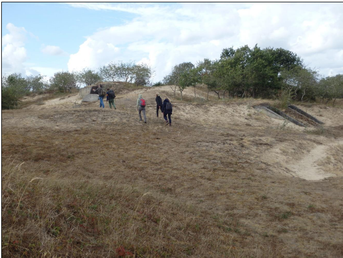
Foto 13. Poolenisti maapealsed avatud punkrid, kus nahkhiired on sagedamini sügisel ja kevadel.