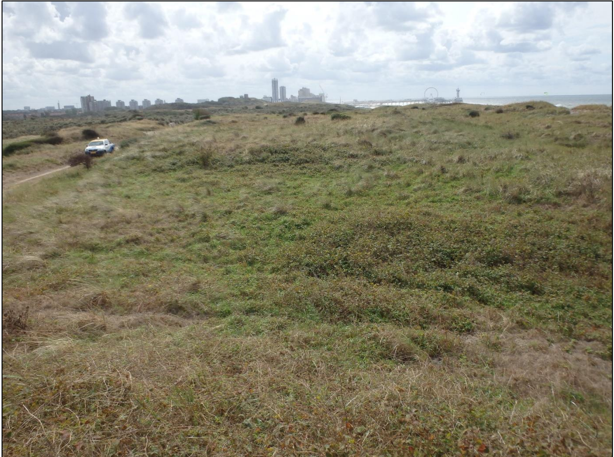
Foto 12. Vaade veekaitsealal asuvale luitestikule, mille all on mitu suuremat punkrite süsteemi.

Pärastlõunal külastame lähikonnas teist punkrite ala, mis asub linnalähedasel mereäärsel luitestikul ja see ala on külastajatele üldiselt suletud veekaitseala, kuhu me saame siseneda eriloaga. Meiega tuleb kaasa ka kohaliku veefirma palgal olev kaitseala töötaja, kelle üks ülesannetest on just ka nahkhiirte kaitse. Sellel alal on suuremad maa-alused punkrite süsteemid. Ka neid punkreid kasutavad tiigilendlased isegi juba augustis, varjevõimaluste parandamiseks on paigaldatud seintele puitbetoonist plaate.