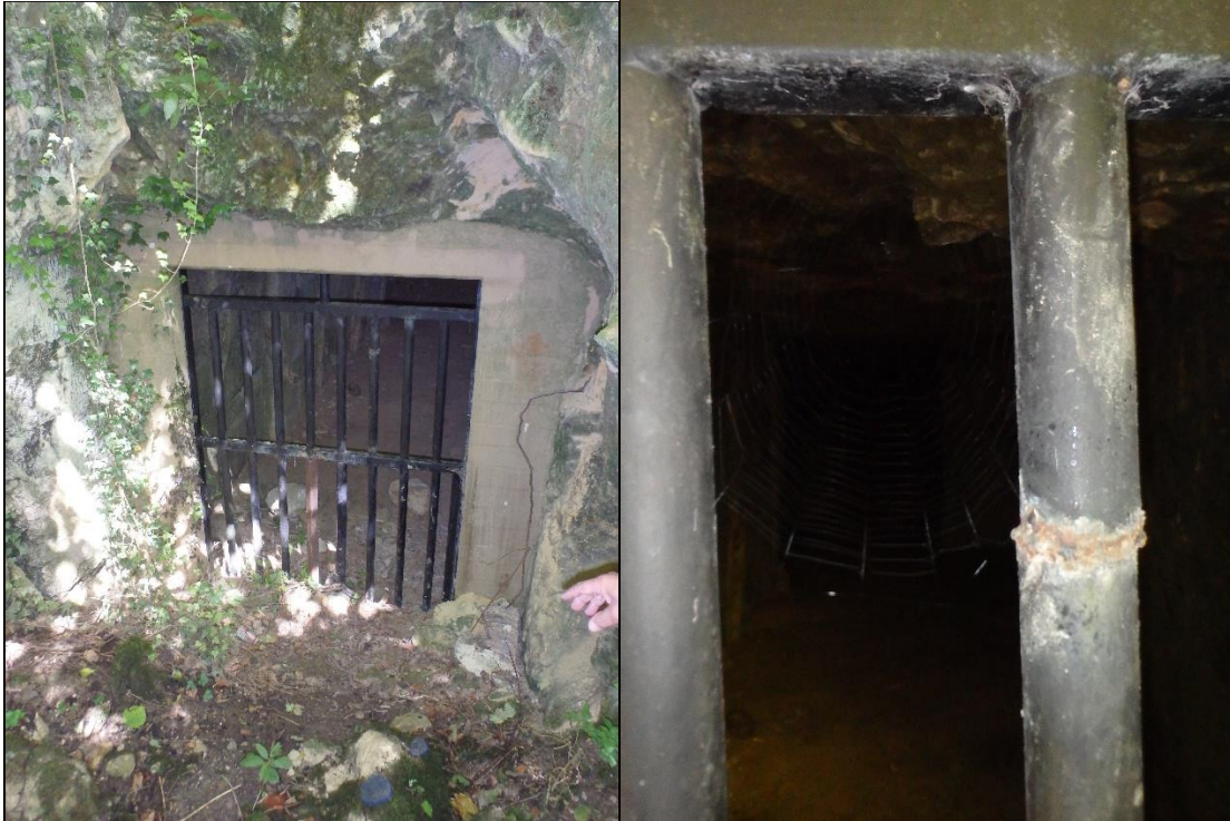
Foto 18. Väiksemate avade trellid. Pea kõikjal oli märke trellide lõhkumisest ja parandamisest. Vasakpoolsel fotol on näha ka et vertikaalse trellistiku ülaossa on jäetud horisontaalsed lennuavad nahkhiirtele.