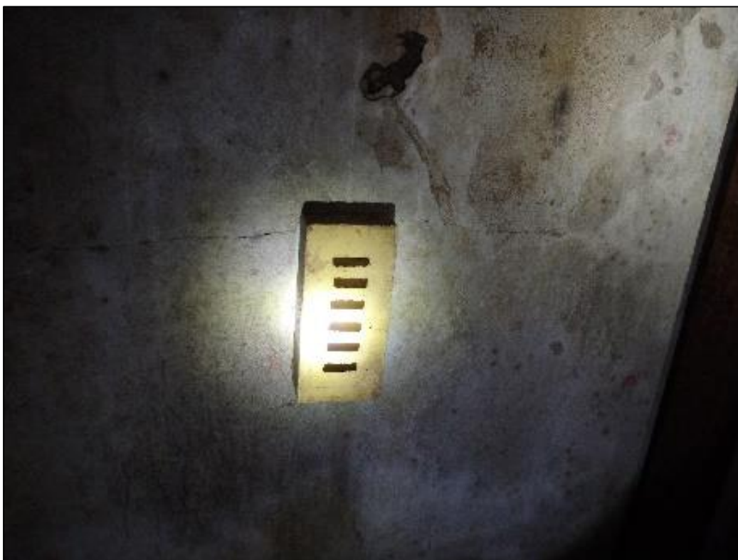
Foto 24. Üheks võimaluseks nahkhiirtele varjepaikade tekitamisel on avadega tellised.