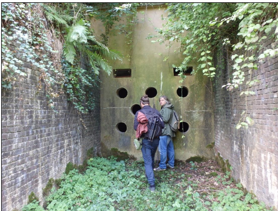
Foto 20. Leidus ka sissepääse, mis olid suletud betoonseinaga, millesse olid jäetud lennuavad. Üldiselt aga pidid sellised lahendused muutma tunnelite sisekliimat ja ka nahkhiireuurijatel puudub sellistesse kohtadesse ligipääs.