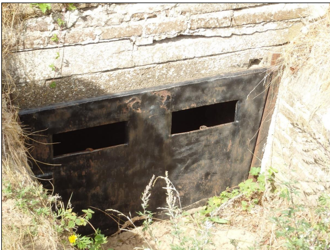
Foto 10. Mõne punkri terasukes on rohkem kui üks lennuava.