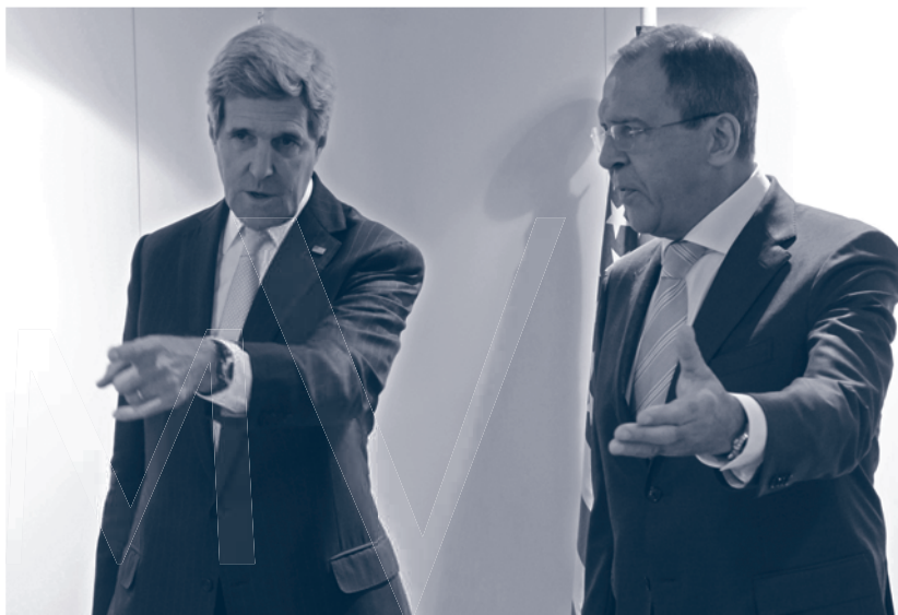
4. detsember 2014 Basel, Šveits. USA välisminister John Kerry (vasakul) räägib Venemaa välisministri Sergei Lavroviga enne kahepoolset kohtumist, mis toimus pärast 21. OSCE Ministrite Nõukogu avaistungit Baseli messikeskuses.

pooltele“ üleskutseid tagada turvalised tingimused OSCE vaatlejaile tavapäraseks tegevuseks. Juttu on olnud ka sellest, et viia OSCE varustus ja sõidukid vastavusse riskantsete oludega – elude päästmiseks on vaja soomusautosid. Vaid imekombel ei ole hukkunuid rohkem kui üks Punase Risti töötaja, kes jättis elu oktoobri algul Donetskis.