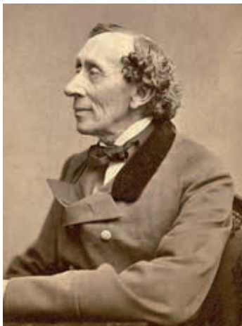
Hans Christian Andersen.

Anderseni tuntuimaks pärandiks on aga tema muinasjutud, mis on kirjutatud ajavahemikus 1835–1872. Ta hakkas muinasjutte kirjutama ajal, kui Euroopa kirjanduses valitses romantism. Üha süvenev huvi folkloori vastu aitas kaasa ka sellele, miks tema muinasjutud kiiresti populaarsuse saavutasid. Andersen ammutas sageli inspiratsiooni ka lapsepõlves kuulud folkloorilugudest, ent vaid 12 tema 156 muinasjutust on nendest inspireeritud. Tema tuntuimateks muinasjuttudeks on „Väike merineitsi“, „Keisri uued rõivad“, „Inetu pardipoeg“, „Lumekuninganna“, „Metsluigid“ jpt.