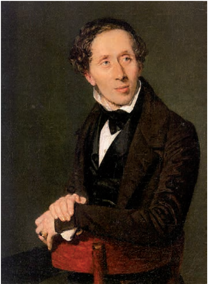
Noor Hans Christian Andersen. Autor Christian Albrecht Jensen