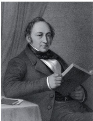
Johan Ludvig Heiberg.

Johan Ludvig Heiberg sündis 1791. aastal Kopenhaagenis kõrgest soost perekonda. Nii tema isa kui ka ema olid Taanis tuntud kirjanikud. Johani ema oli ka muuhulgas kirjanik, kes avaldas oma teoseid varjunime all ja hoidis oma identiteedi saladuses. Johani isa saadeti 1800. aastal oma satiirilise poliitiliste artiklite pärast eksili, millele järgnes vanemate lahutus ning ema uus abielu.