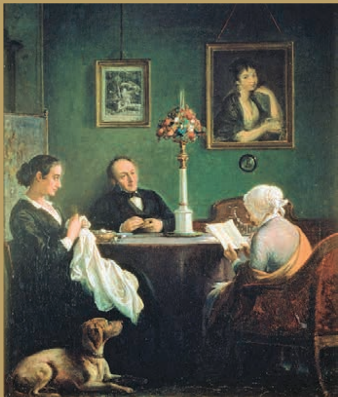
Proua Gyllembourg loeb J. L. Heibergile ja tema abikaasale novelli. Autor Wilhelm Marstrand