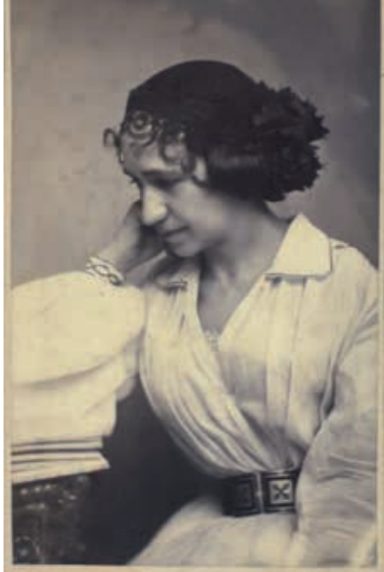
Johanne Luise Heiberg.

Hiljem tuli välja, et tegelikult oli mehe vallandanud Johanne Luise abikaasa Johan Ludvig, kellest oli vahepeal saanud Taani Kuningliku Teatri juht. Johan Ludvigi suhtumine pani aga tema naise väga keerulisse positsiooni. Olles samal ajal teatri direktori naine ning esinäitlejanna, sattus ta kahe sõjajalal oleva poole vahele. Ja loomulikult viis see ideoloogiline võimuvõitlus, pinge vana ja uue koolkonna vahel, mis tõi endaga kaasa Michael Wiehe'i lah-