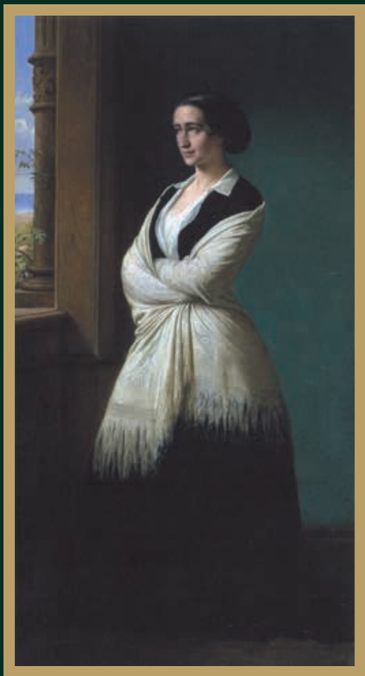
Johanne Luise Heiberg. Autor Wilhelm Marstrand