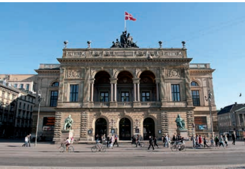
Taani Kuninglik Teater.

Teatri algusaastatel oli trupp tagasihoidlik, koosnedes kaheksast meesnäitlejast, neljast naisnäitlejast, kahest meestantsijast ja ühest naistantsijast. Aastakümnetega kasvas teatrist mitmekülgset repertuaari pakkuv suurteater, mille struktuur on üsna sarnane tänapäevale, kus mängitakse nii draama-, ooperi- ja balletilavastusi kui ka kontserte.