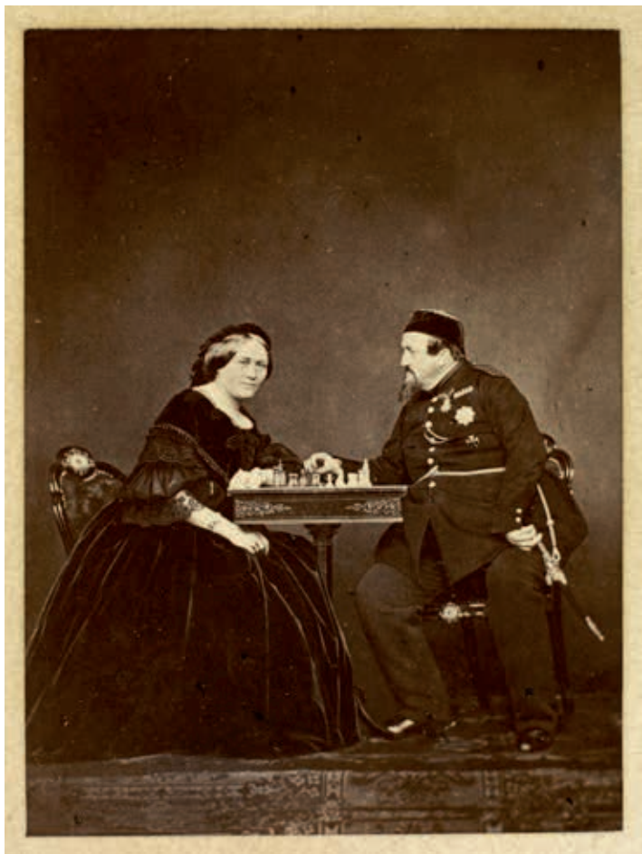
Krahvinna Danner ja kuningas Frederick VII.