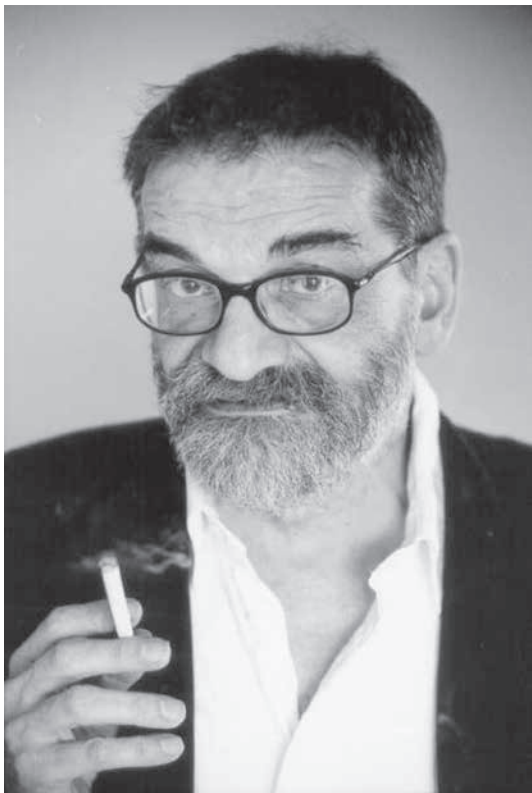
Mogens Rukov