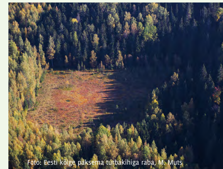
Foto: Eesti kõige paksema turbakihi raba

Vällämäge katab salumets , kus puurindes valitseb kuusk. Lehtpuudest on esindatud haab, vaher, pihlakas ja toomingas. Alusmetsas kasvavad sarapuu, mage sõstar, vaarikas ja kuslapuu. Rohurinne on lopsakas, eriti rohkelt on kevadel õitsvaid taime-