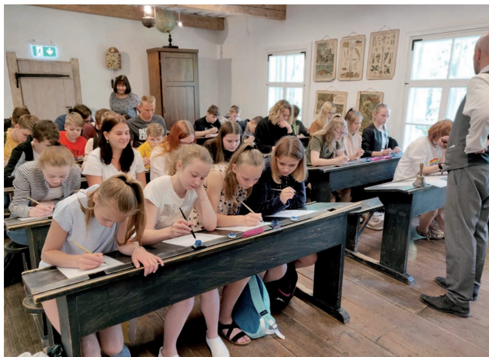
Seekordne õppepäev toimus Palamusel, O. Lutsu „Kevade“ radadel.