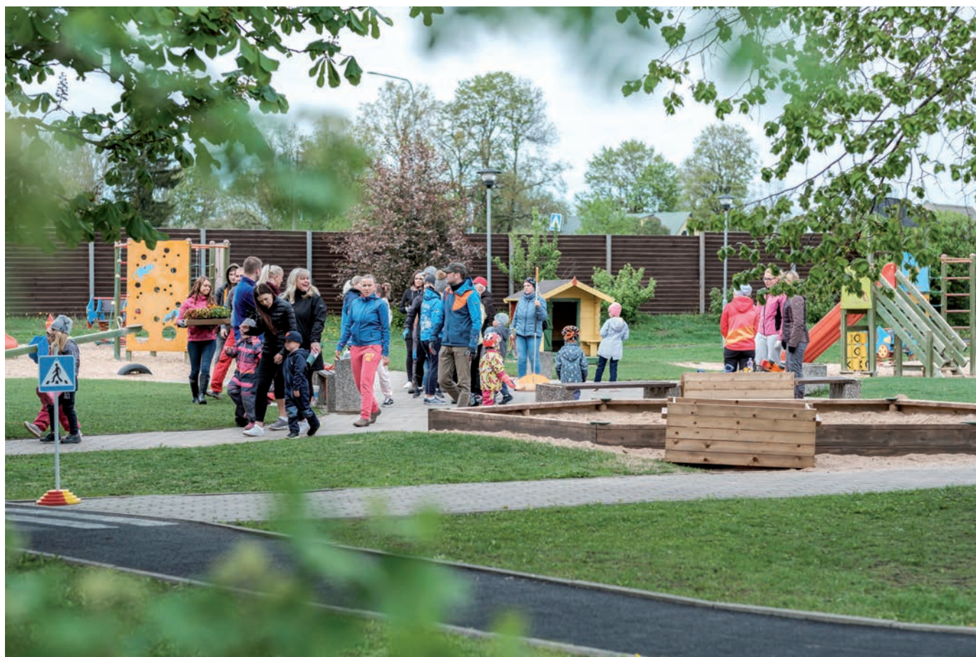
Lapsed võtsid Tartumaa aasta küla 2018 lasteaeda kaasa oma vanemad, et korrastada õueala.