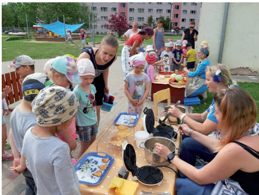
Eesti toidu päev

Perepäeva alustasime pidulikult rahvariietes. O. Ehala "Päikeseratta" saatel toimus kujundliikumine ning tant-siti-lauldi, mida filmis droon. Seejärel