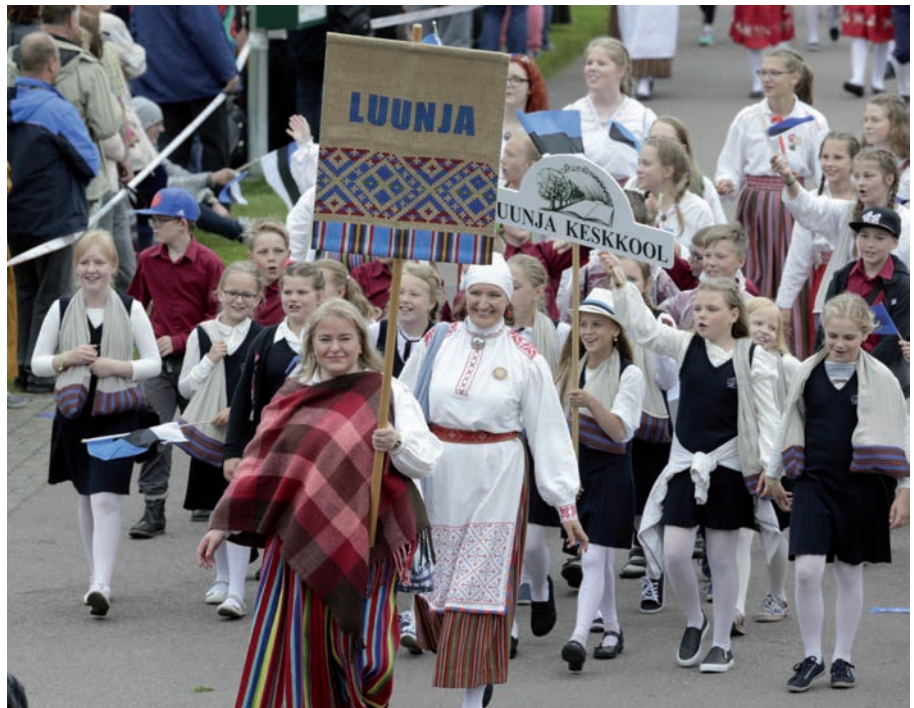
Rongkäik 2017.