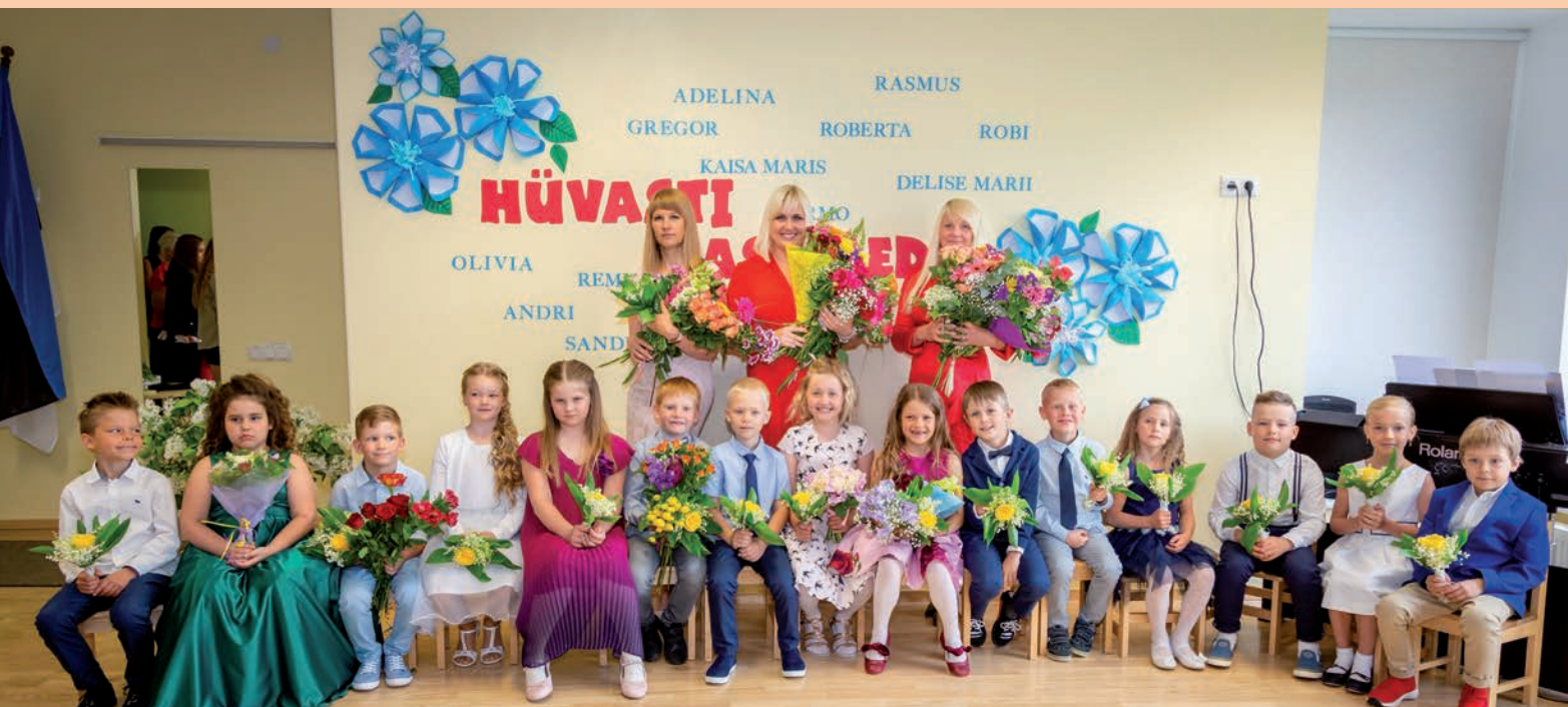
Lohkva lasteaia lõpetajad 2019.