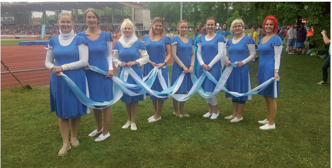
Tartu võimlemispidu.