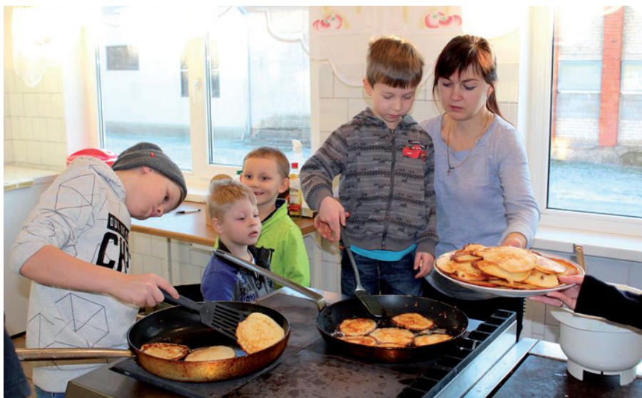
Pannkoogid – siit need tulevad!

Veel tähistasime kõik koos sõbrapäeva. Üheskoos sai peetud maha üks meeleolukas sõbrapäeva pidu. Enne koolivaheaega oli poistenädal, mille raames panime meie lasteaia ja kooli poisid proovile erinevates väljakutsetes. Esmaspäeval pandi proovile poiste sportlikkus, teisipäeval loovus ja meisterdamisoskus, kolmapäeval taiplikkus Ahhaa külastuse