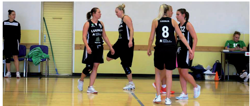
Luunja korvpallinaiskond.