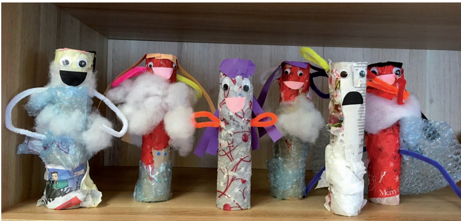
Lohkva prügisõbrad.