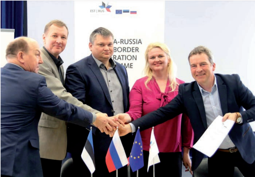
Viie omavalitsuse esindajad löid käed.