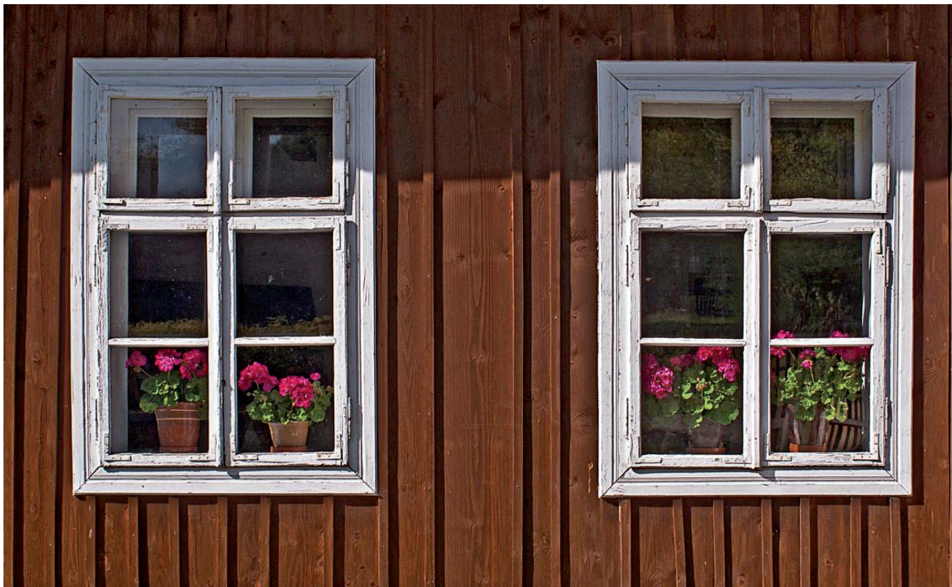
Vaata vana akent!

MTÜ Säästva Renoveerimise Infokeskuse Tartu Ühendus