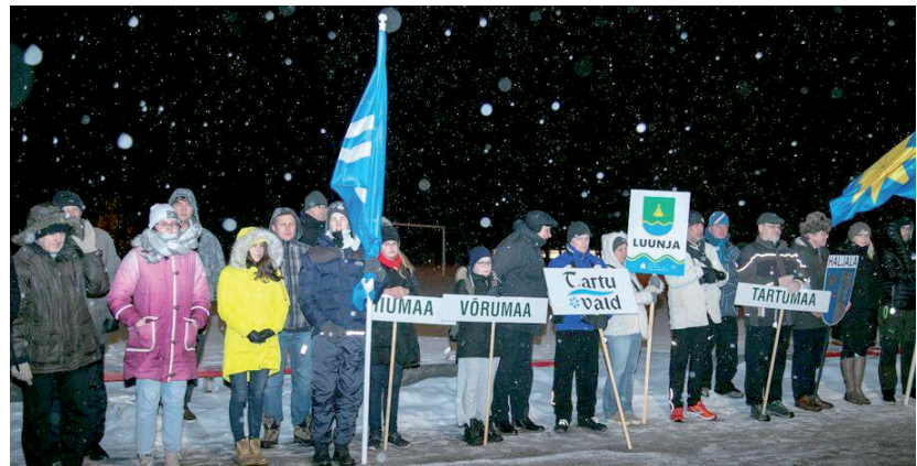
Hetk Eesti omavalitsuste talimängude avadefileelt Kadrinas

Luunja Kultuuri- ja Vabaajakeskuse direktor