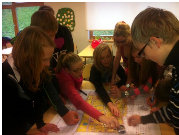
Fotod 10 ja 11: Tartu Kesklinna Kooli 9b klassi õpilased Supilinna kaarti täiendamas – Supilinna üldplaneeringu eskiislahenduse kaardile lisatakse omapoolsed ettepanekud.