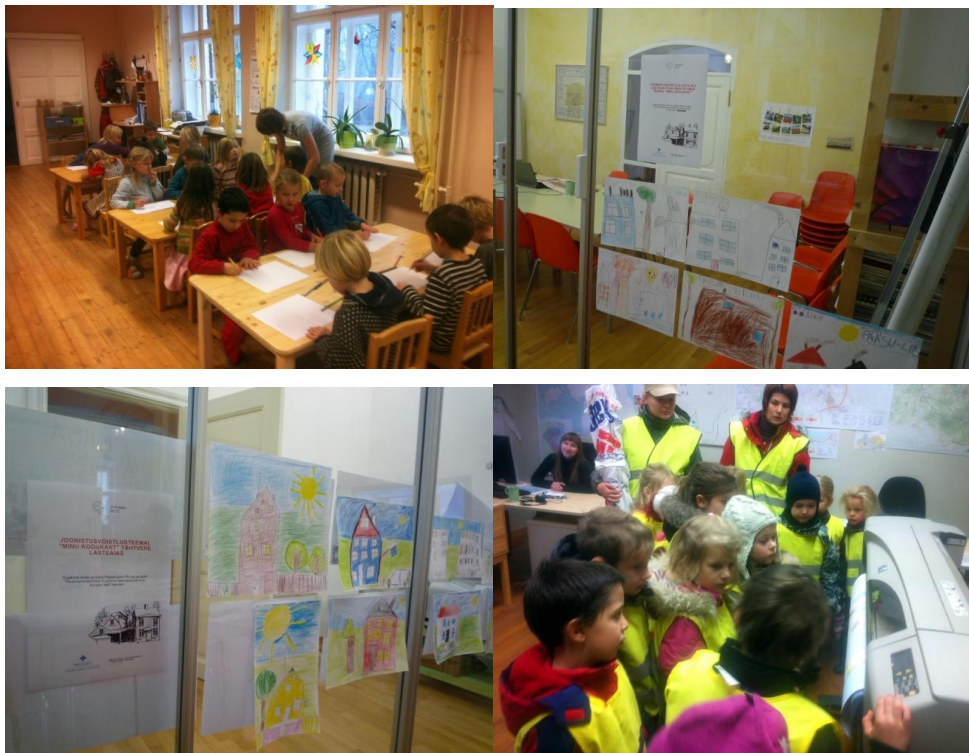
Fotod 5-8: Tartu Katoliku Lasteaia Püha Anna rühma lapsed joonistamas (foto 5); laste väljapandud tööd (fotod 6 ja 7); Tartu Katoliku Lasteaia lapsed näitust vaatamas ja kontoris ekskursioonil (foto 8).

Tegelikkuses puudus joonistamise juures otsene võistlusmoment, parimaid ei valitud. Valminud joonistustest koostati näitus, mida kutsuti vaatama ka autorid koos kasvatajatega. Näitus seati üles OÜ Hendrikson&Ko Tartu kontoris, seda käisid 2. detsembril külastamas Katoliku Lasteaia Püha Anna rühma lapsed (ka joonistajateks olid Püha Anna rühma lapsed). Külastus osutus laste jaoks huvitavaks ja meeleolukaks, nad said võimaluse tutvuda nõ suurte inimeste tööalaste tegemistega.