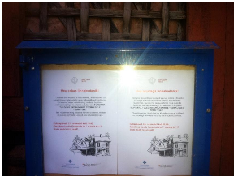
Fotod 2-4: Vestlusringide kuulutused.