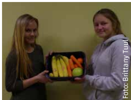
Saak missugune: banaanid ja õun.

vate lillede vahel, mis meile endale meeldisid. Valitud lill oli müüja sõnul 3D-roos, kuid meie arvates oli see täiesti tavaline. Seejärel suundusime koos pakitud roosiga turule, kus müüja vahetas roosi järgmi-