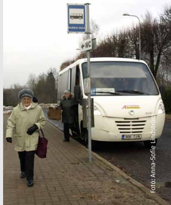
Päeva oodatuim hetk: Tartu buss saabus.

Kuigi noored pole nii usinad ühistranspordikasutajad kui vanemad inimesed, on ka neil oma arvamus. „Kui ma bussiga sõidan, siis ikka Viljandi vahet. Buss teeb pika ringi, mitte ei lähe otse Viljandisse ja sõit kestab kaua,“ rääkis üks Karksi-Nuiast pärit noor. „Oleme nagu kilud karbis,“ lisas ta.