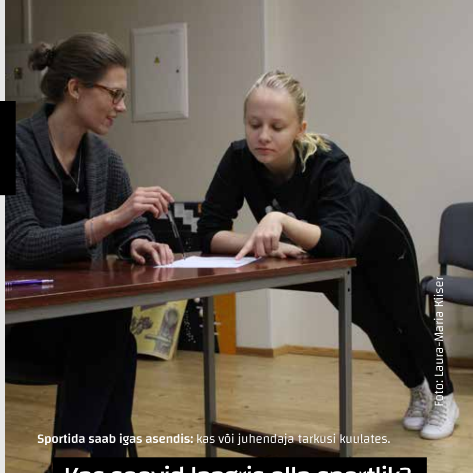
Sportida saab igas asendis: kas või juhendaja tarkusi kuulates.